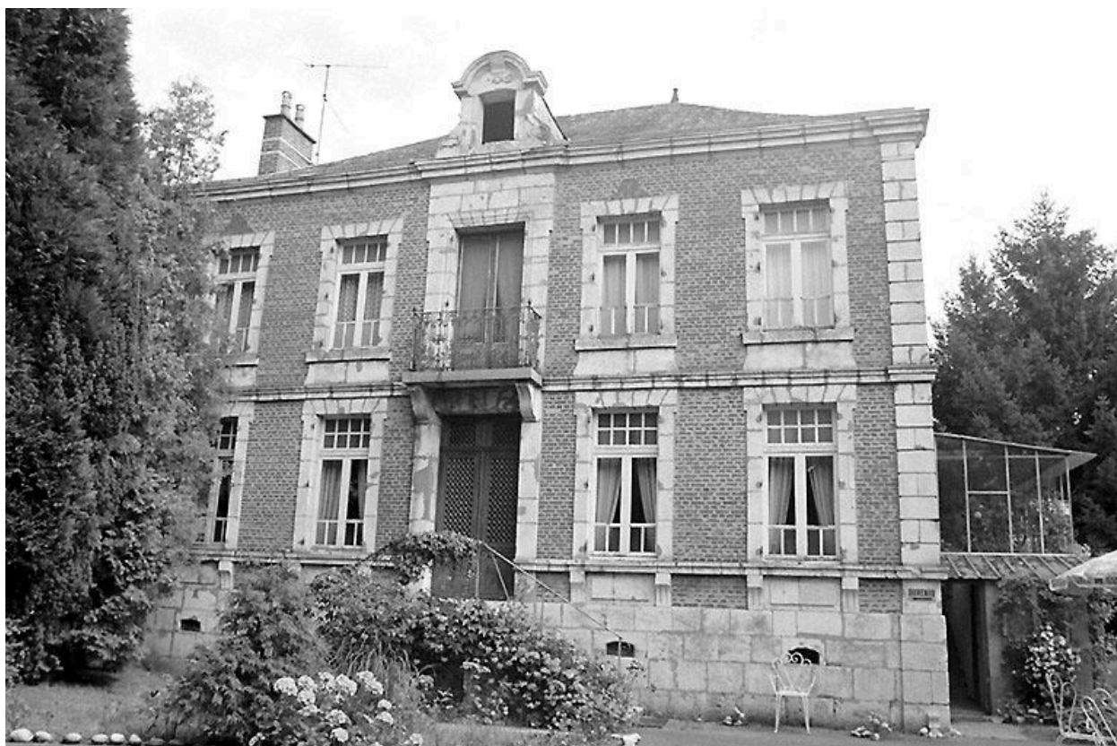
Elévation sud, sur jardin.