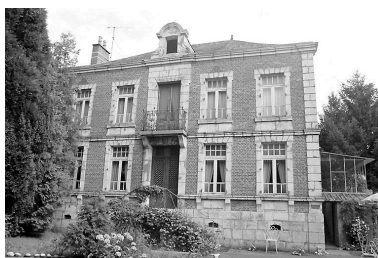
Elévation sud, sur jardin. IVR22_19980203190Z