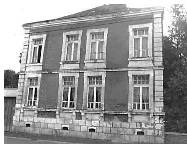
Elévation nord, sur rue. IVR22_19980203191Z