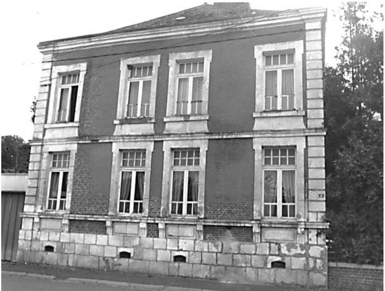
Elévation nord, sur rue.