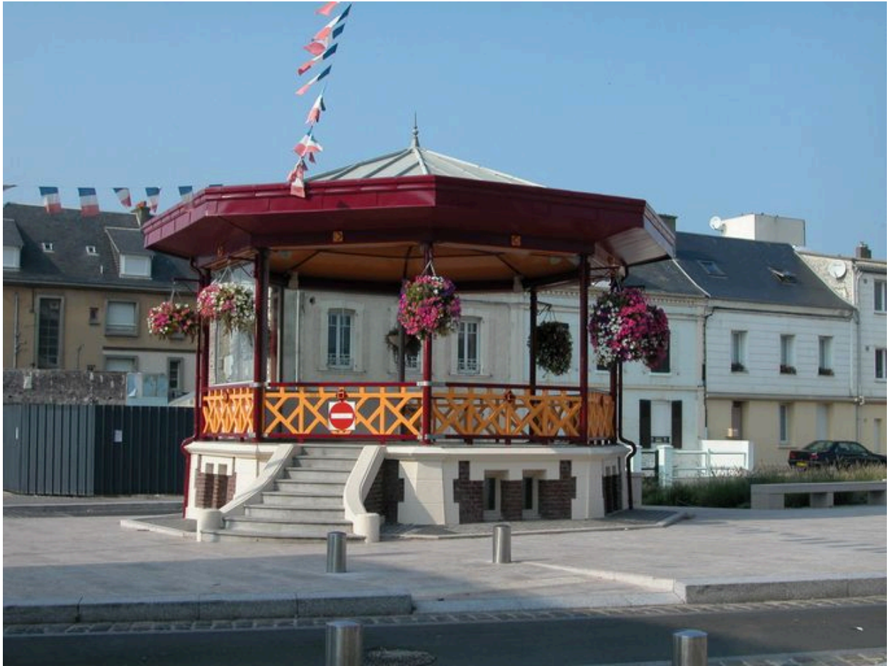
Vue d'ensemble en 2005.