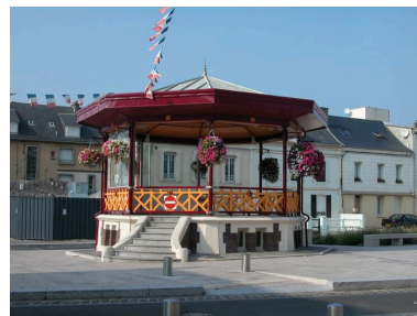
Vue d'ensemble en 2005. IVR22_20058003095NUCA

IVR22_20058000438XAB