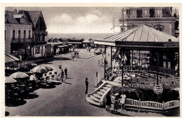
Le kiosque avec son couvrement, carte postale, 1er quart 20e siècle (coll. part.).

Phot. Monnehay-Vulliet Marie-Laure IVR22_20058000437XAB