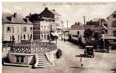
Le kiosque sans son couvrement, carte postale, 1er quart 20e siècle (coll. part.).

Phot. Monnehay-Vulliet Marie-Laure IVR22_20058000437XAB