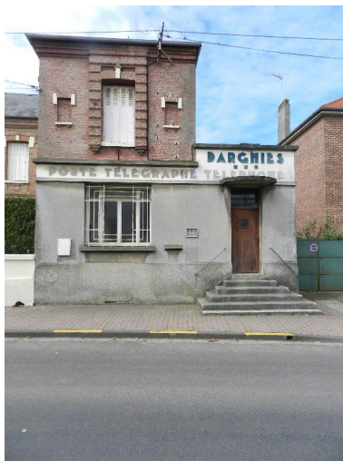
L'élévation principale. IVR22_20138015978NUC1A