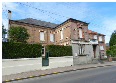
Vue générale. IVR22_20138016008NUC1A