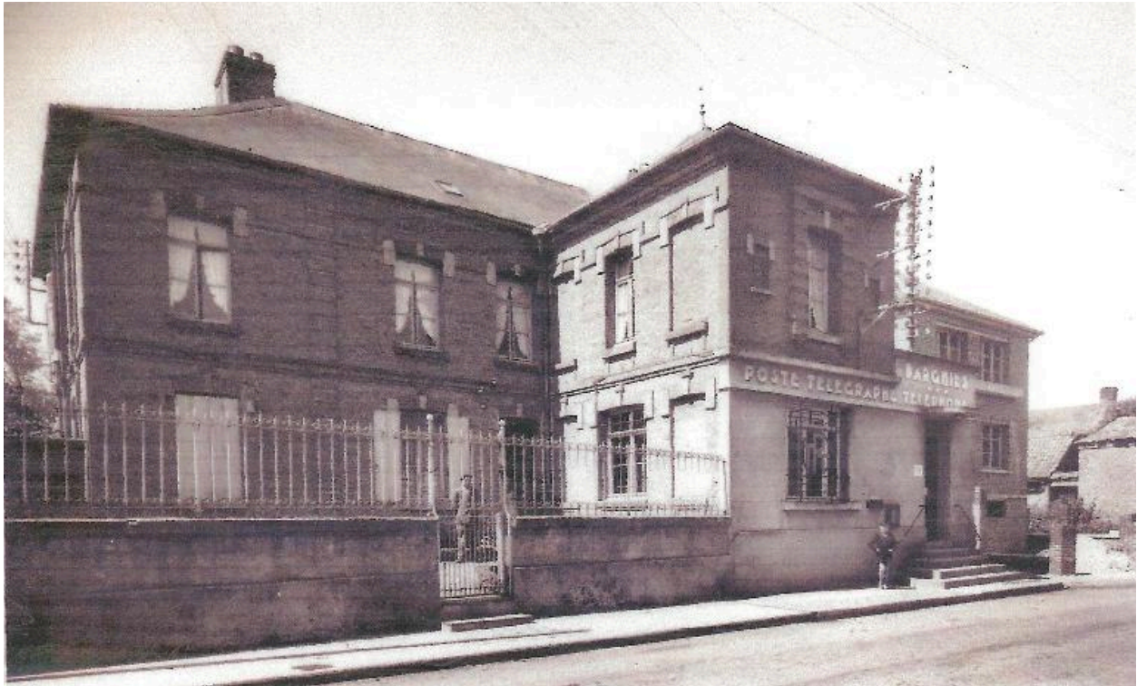
Le bureau de poste, vers 1950.