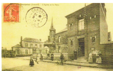
La mairie, l'église et la poste, vers 1915 (coll. part.). IVR22_20128005233NUC1A