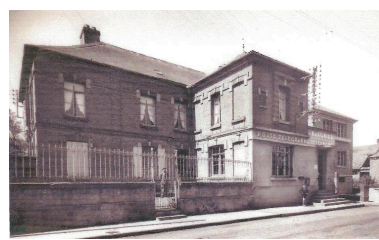
Le bureau de poste, vers 1950 (coll. part.).