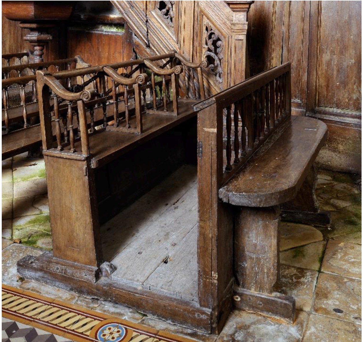
Banc de famille, côté nord.