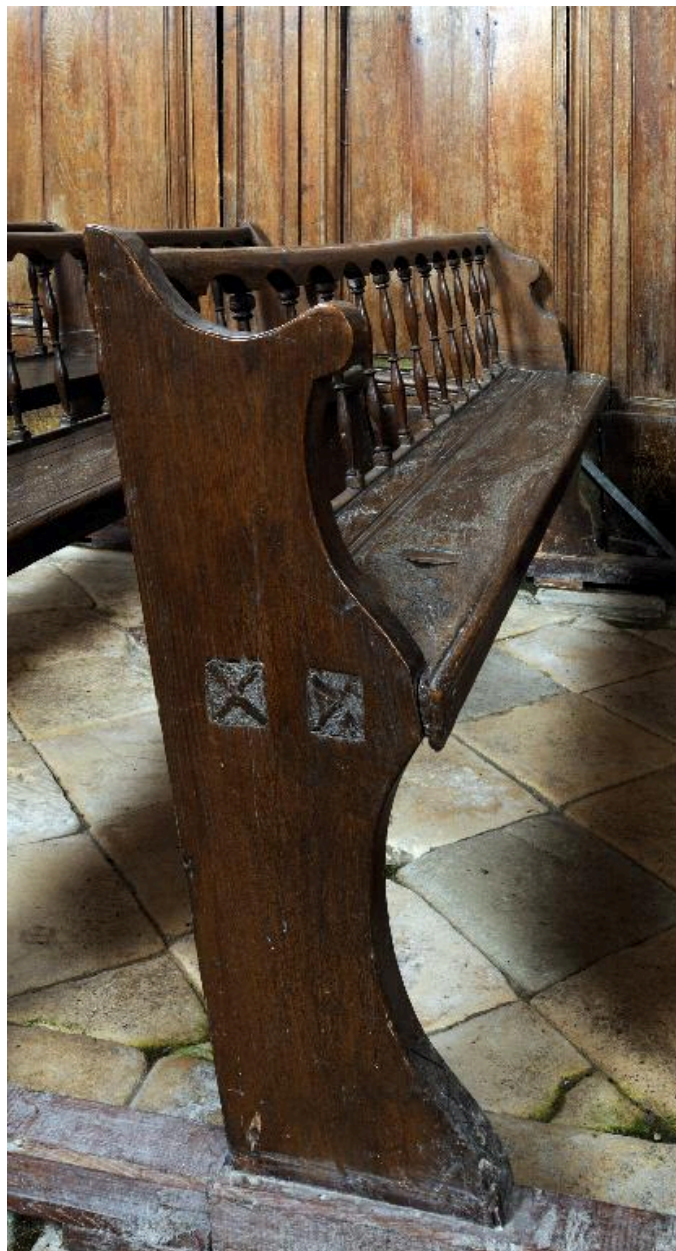
Détail d'un banc.