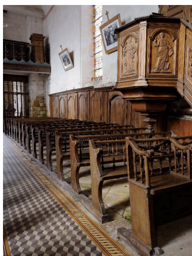
Bancs de la nef, rangée nord. IVR22_20148000087NUC2A