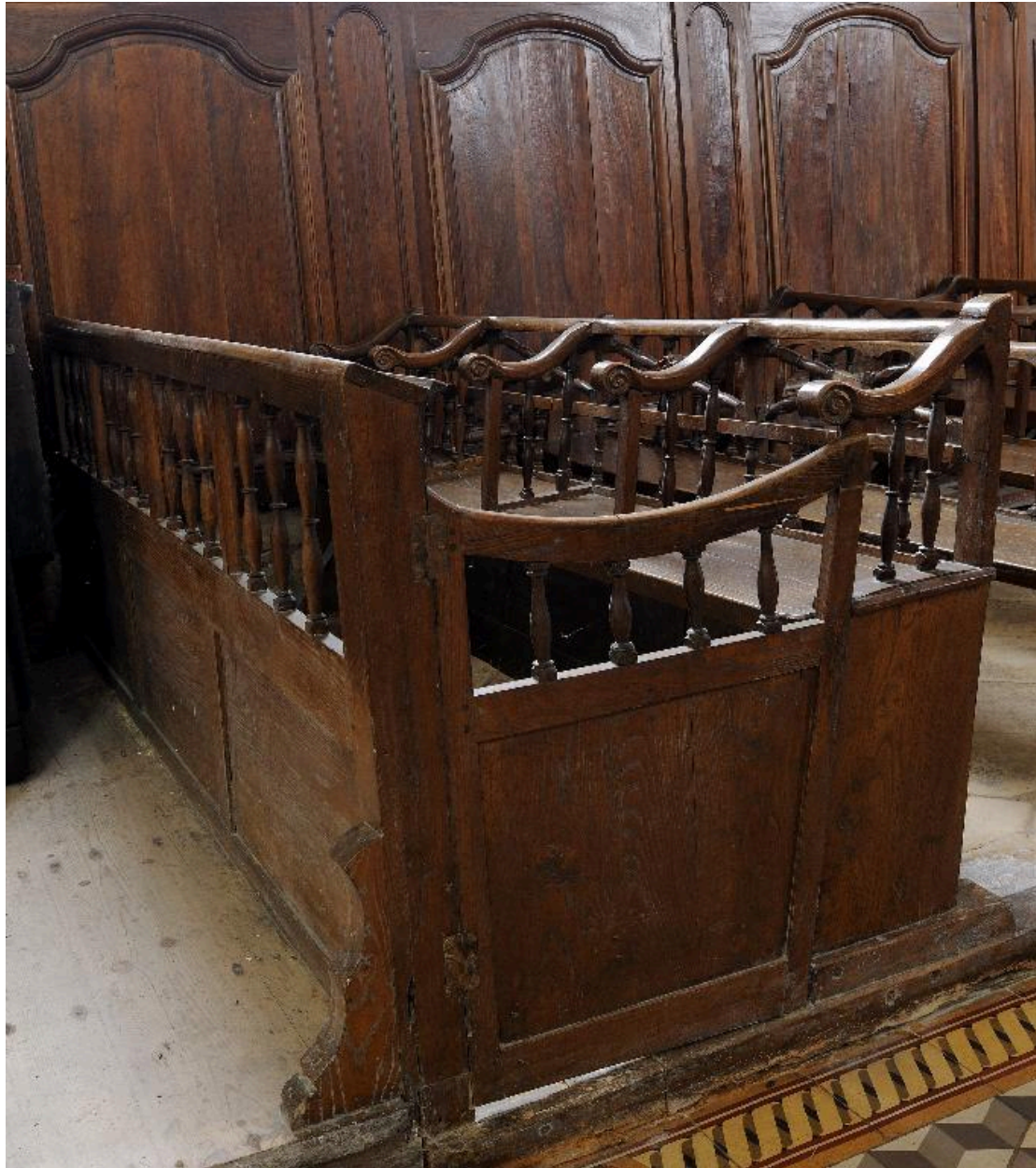
Banc de famille, côté sud.