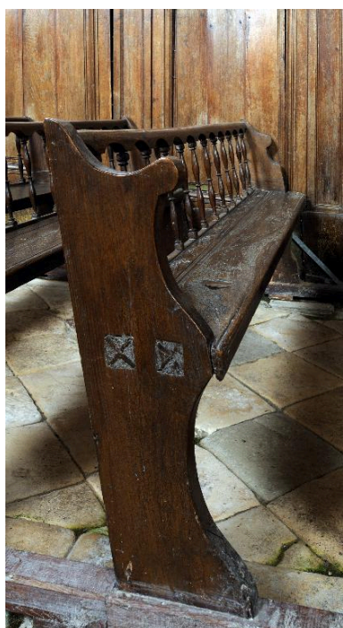
Détail d'un banc.