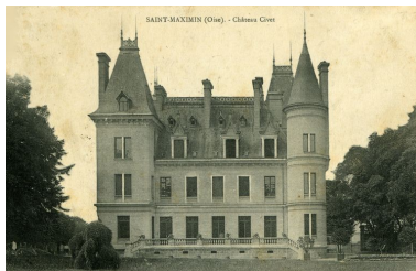
Façade postérieure du château Civet (collection particulière). IVR22_20106003164NUCAB