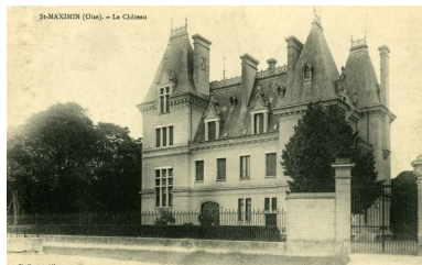
Façade antérieure du château Civet (collection particulière). IVR22_20106003165NUCAB