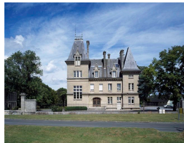
Vue générale du château Civet. IVR22_20106000835VA