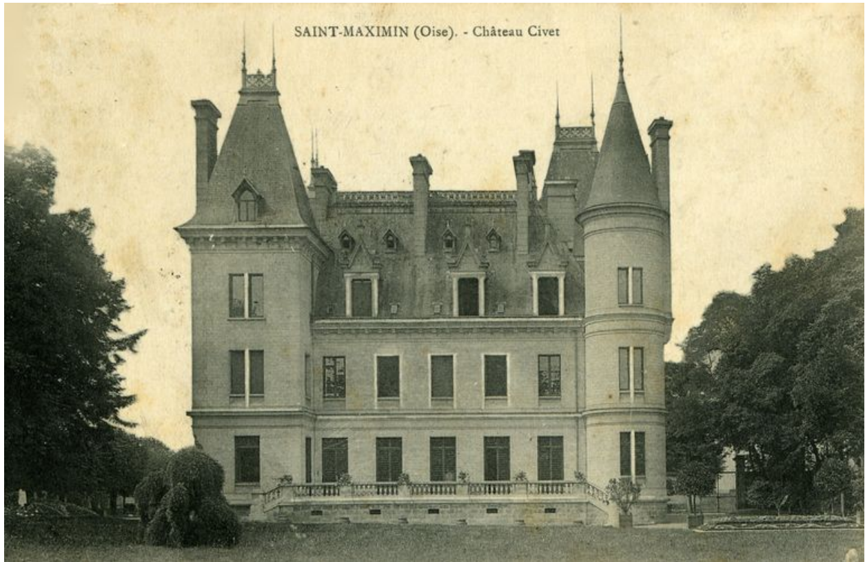
Façade postérieure du château Civet.