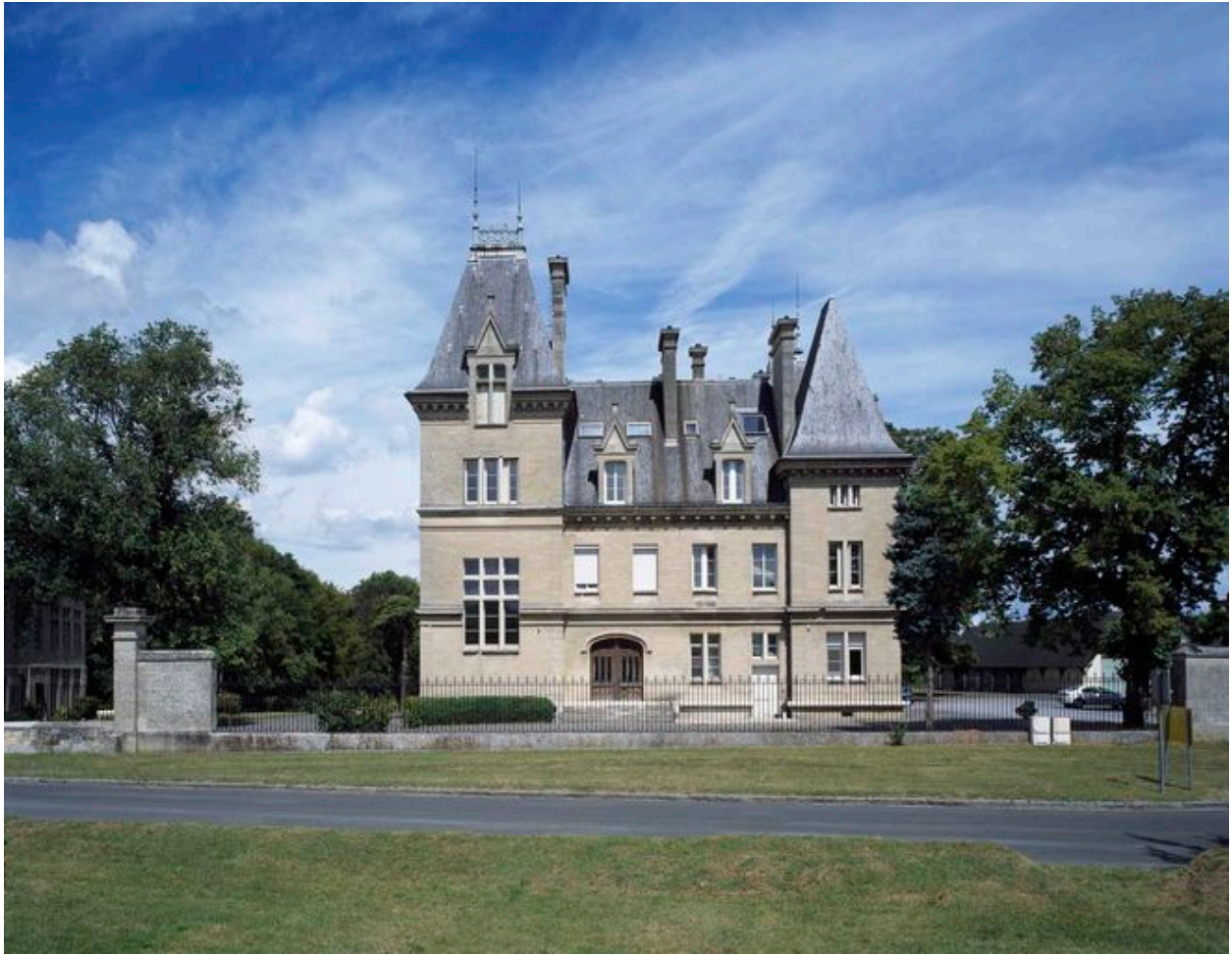
Vue générale du château Civet.