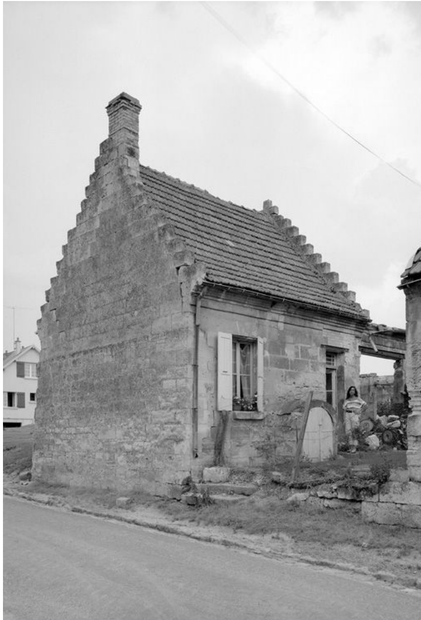
Ancienne grange transformée en logement.