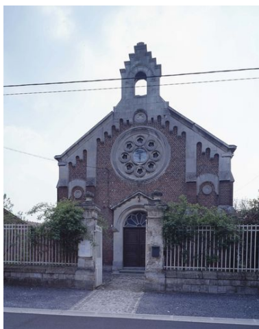
Vue générale. IVR31_20095902065VA