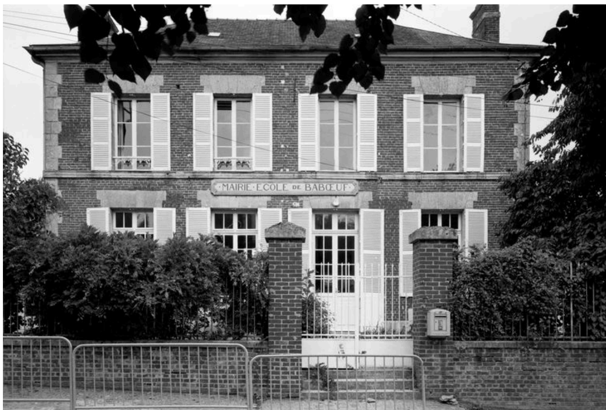
Marie-école. Élévation antérieure.