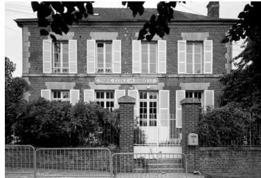
Marie-école. Elévation antérieure.