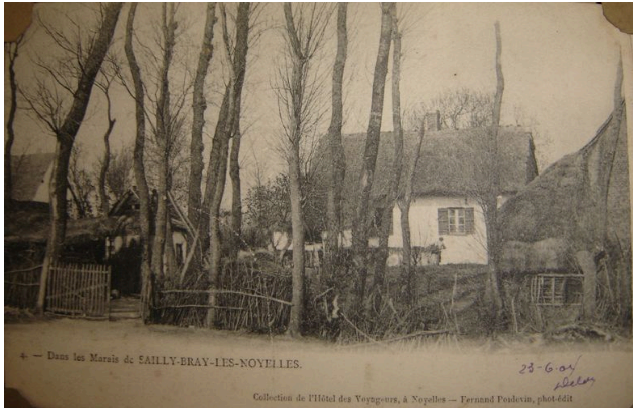
Vue de maisons situées dans les marais de Sailly-Bray au début du 20e siècle.