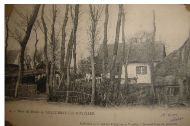
Vue de maisons situées dans les marais de Sailly-Bray au début du 20e siècle. IVR22_20068005060NUCAB