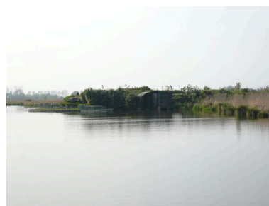
Vue de la Hutte des 400 coups.