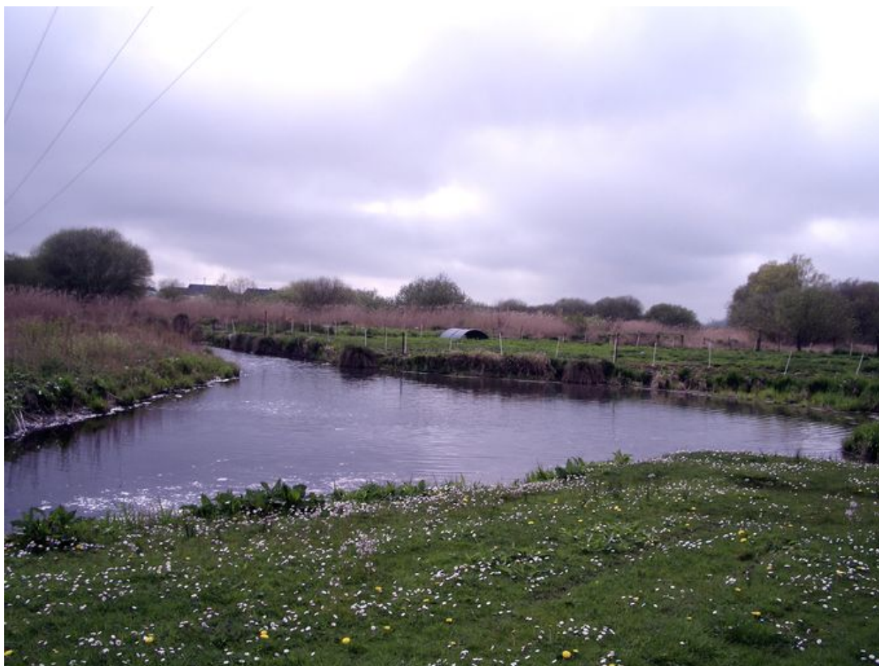
Vue des marais au bout de l'Impasse Colasse.