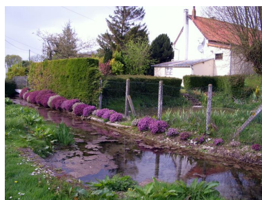
Vue du rû au pied des habitations dans l'Impasse Colasse.