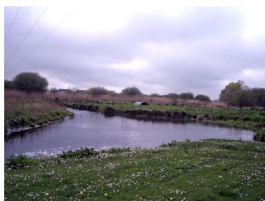
Vue des marais au bout de l'Impasse Colasse. IVR22_20058005647NUCA