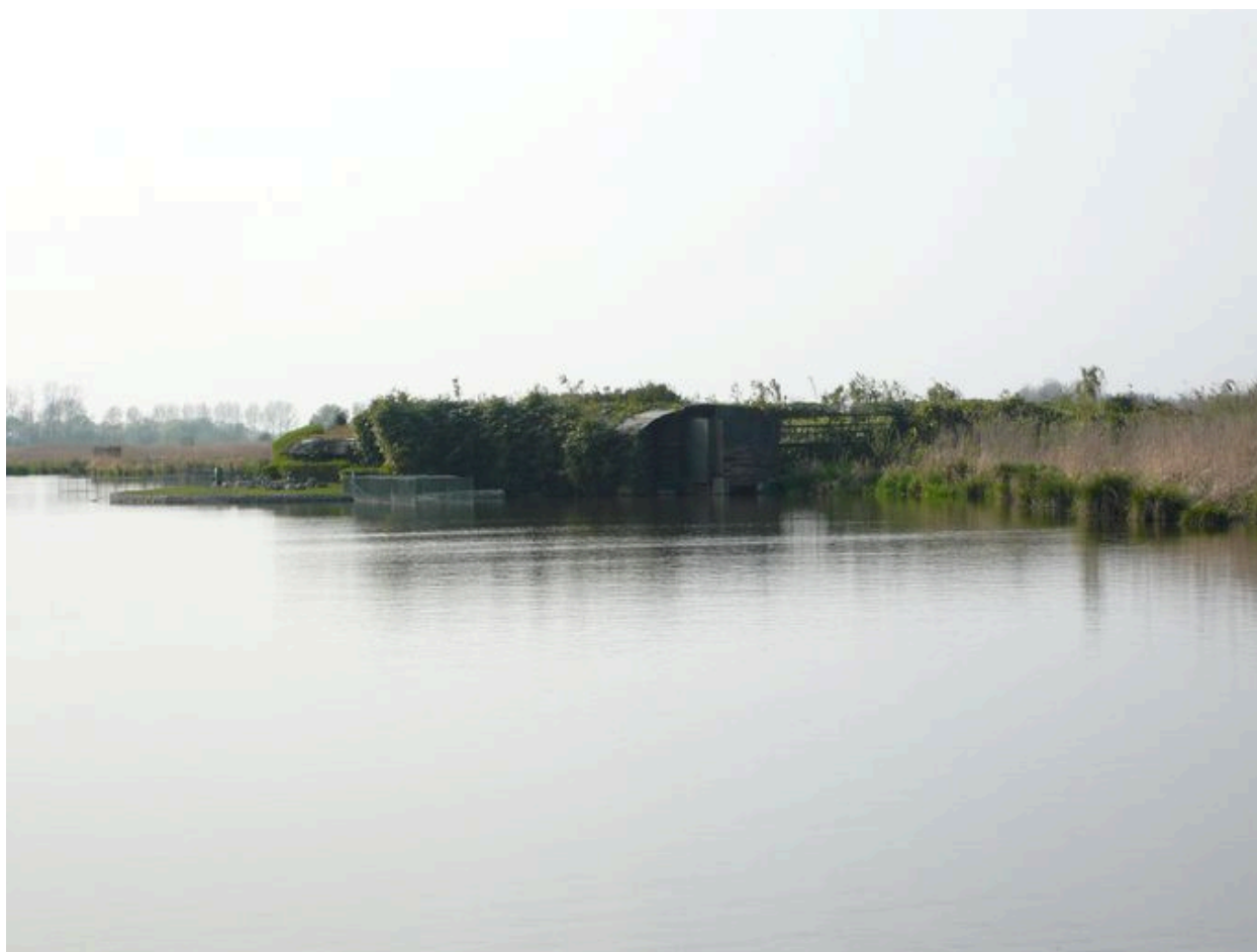
Vue de la Hutte des 400 coups.