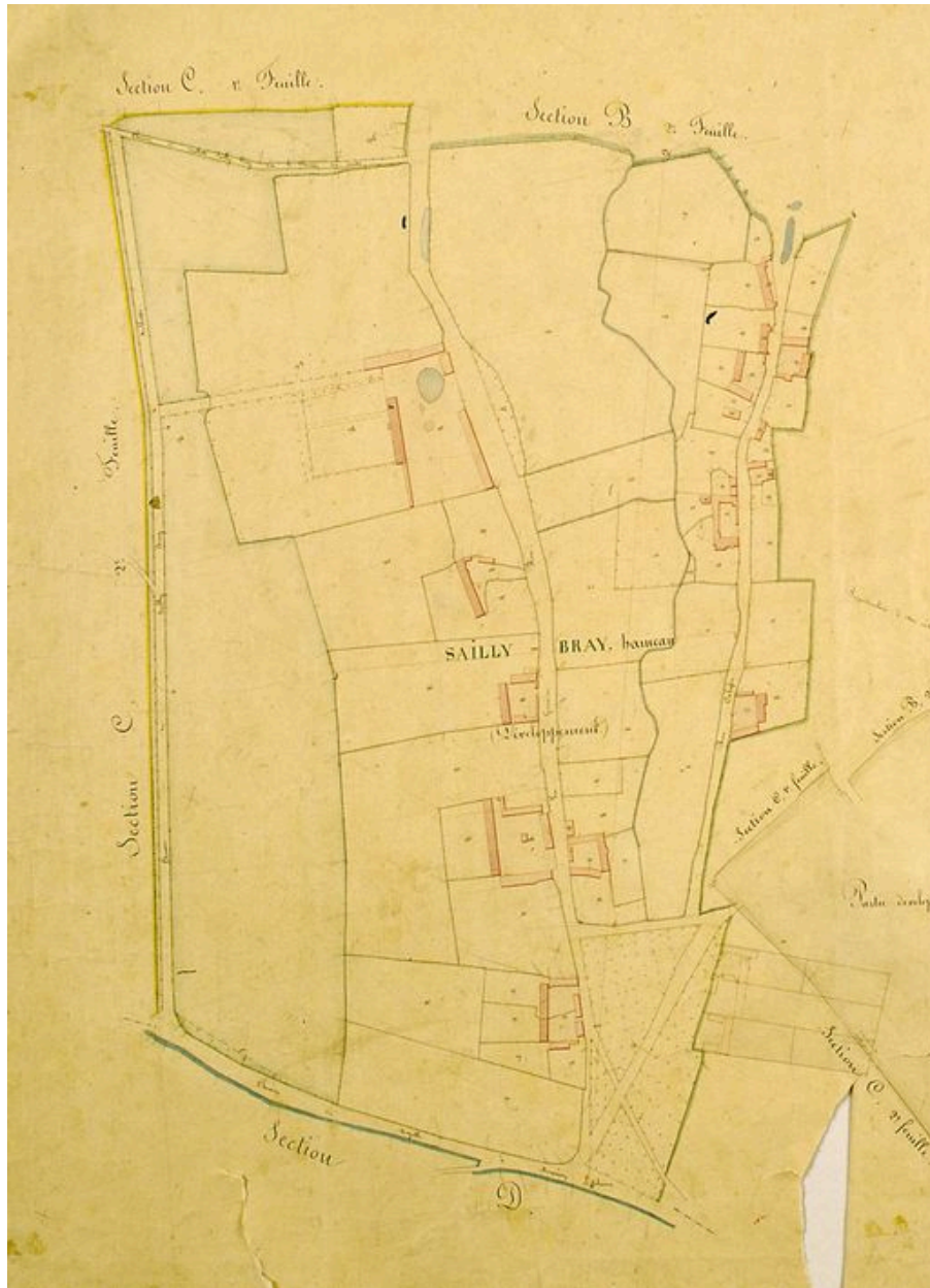
Cadastre napoléonien de la section de Saily-Bray.