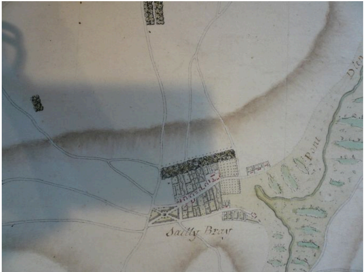
Plan du hameau au 18e siècle.