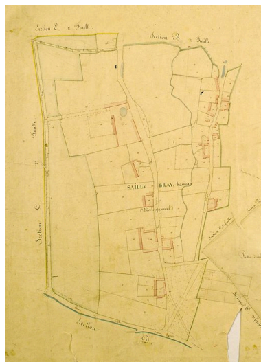
Cadastre napoléonien de la section de Sailly-Bray. IVR22_20068005704XAB