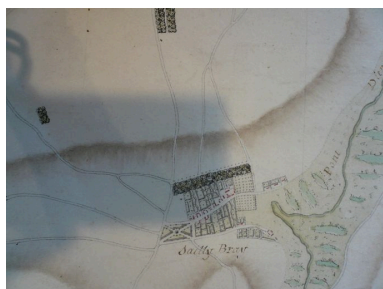
Plan du hameau au 18e siècle. IVR22_20068005979NUCAB