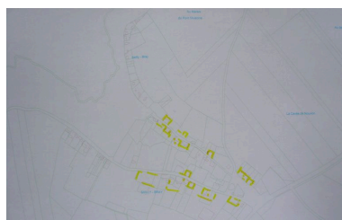
Superposition des cadastres napoléonien et actuel présentant l'évolution du bâti au cours du 19e siècle à Sailly-Bray.