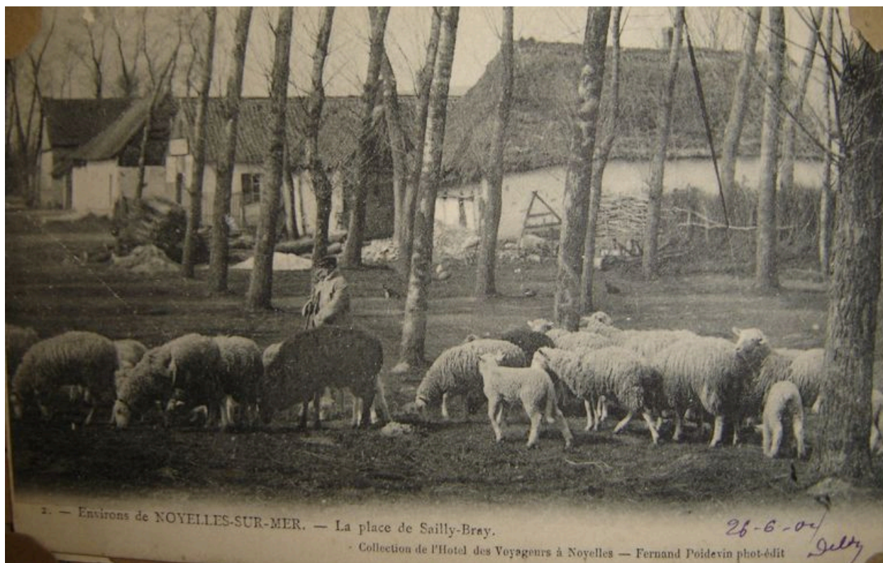
Vue de la place de Sailly-Bray au début du 20e siècle.