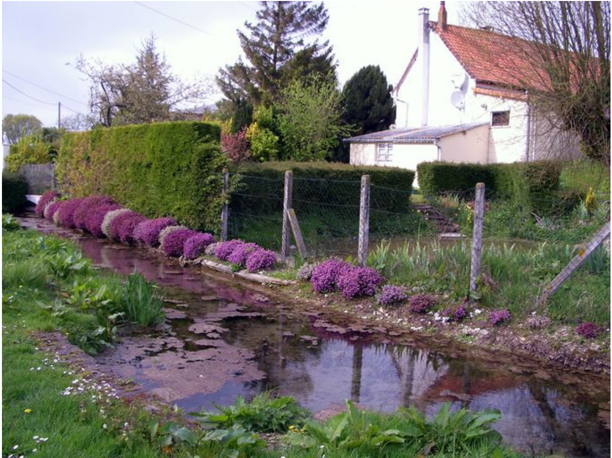
Vue du rû au pied des habitations dans l'Impasse Colasse.