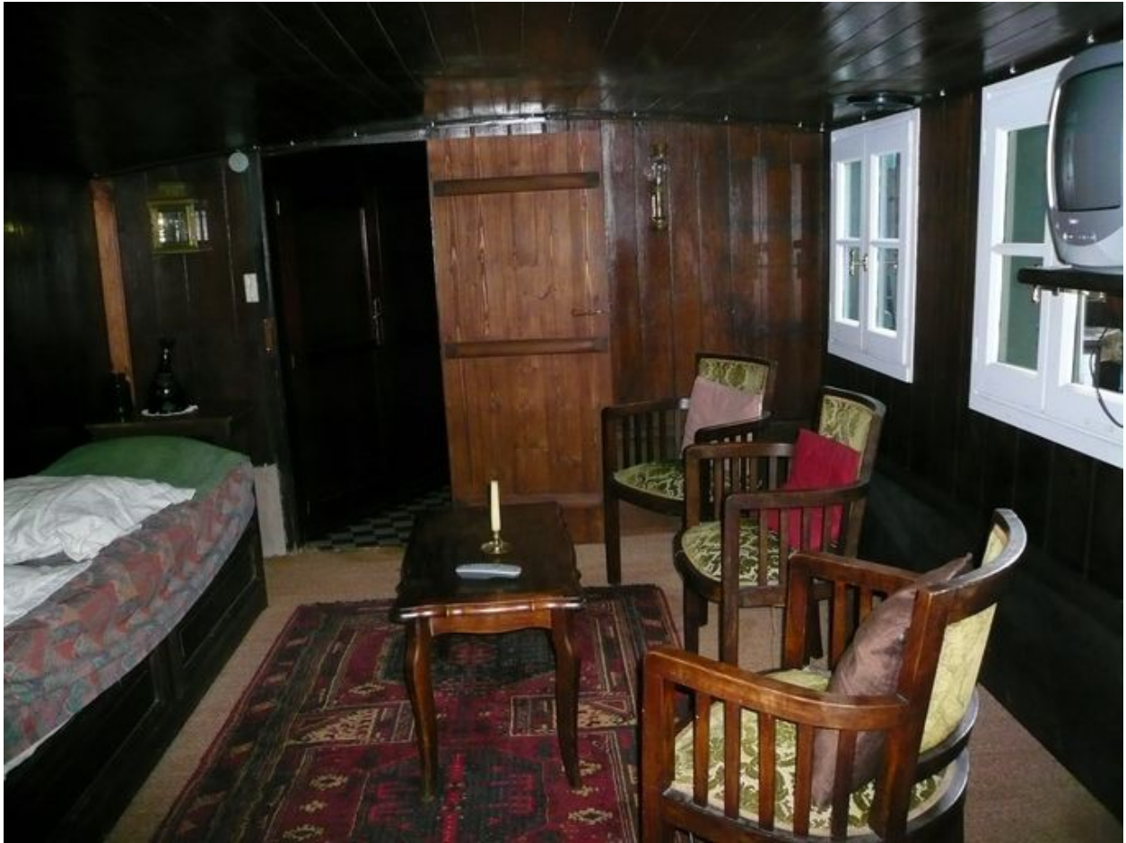
Vue intérieure de la hutte.