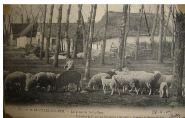
Vue de la place de Sailly-Bray au début du 20e siècle. IVR22_20068005061NUCAB