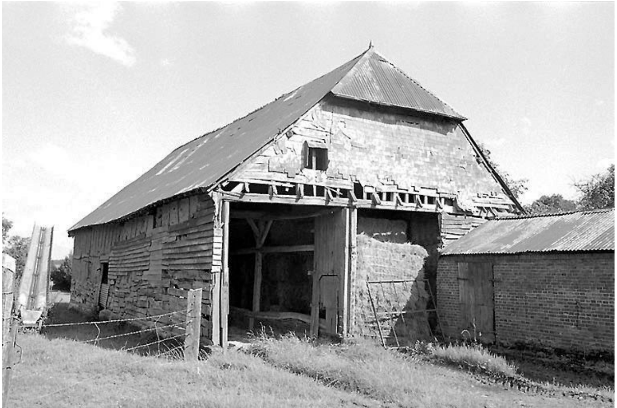
Grange vue depuis le nord-est et porcherie attenante.