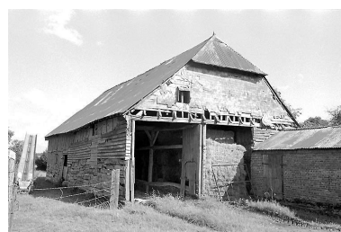
Grange vue depuis le nord-est et porcherie attenante.

IVR22_19980202354Z