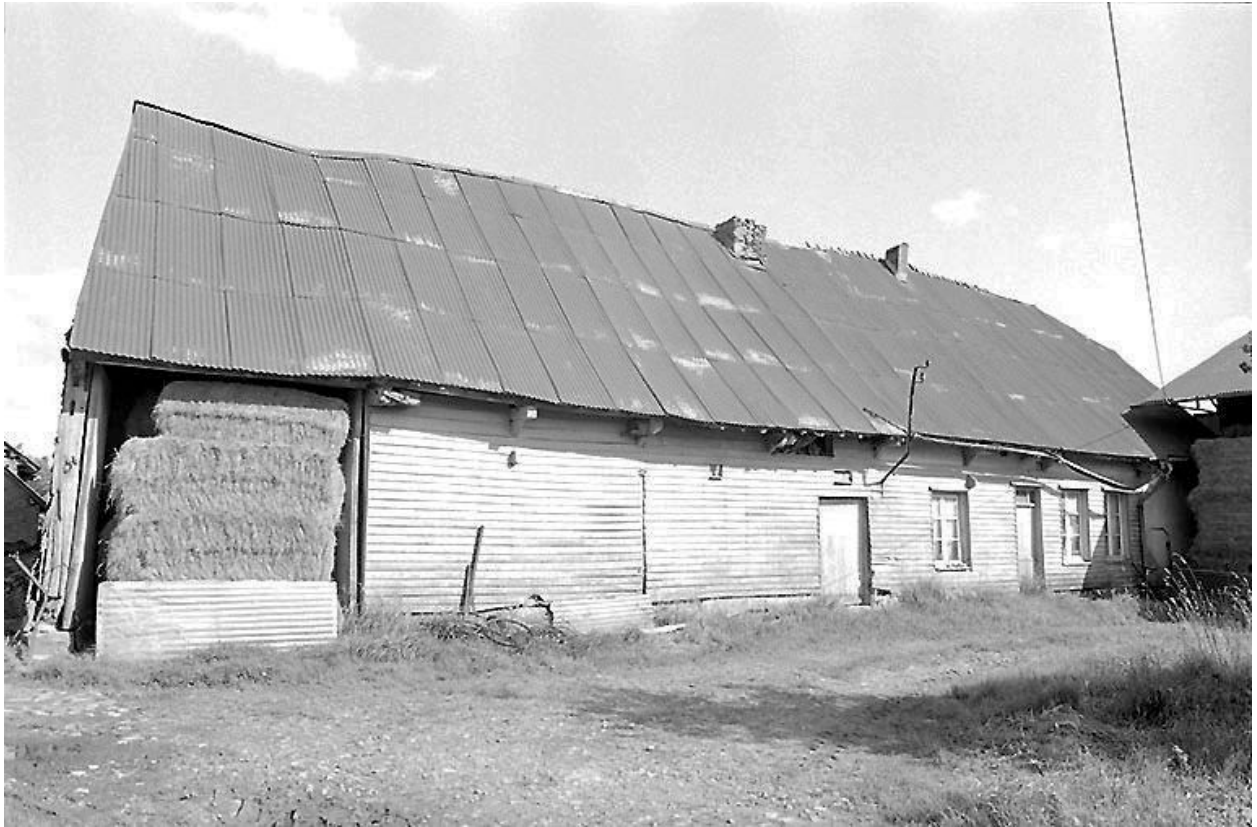
Vue générale du logis et de l'étable attenante.