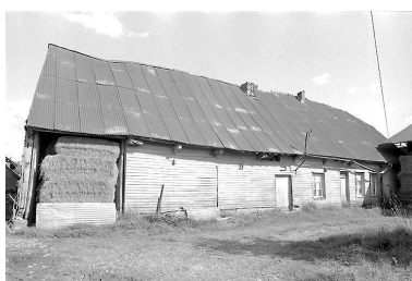
Vue générale du logis et de l'étable attenante.

Phot. Monnehay-Vulliet Marie-Laure IVR22_20080290128NUCA