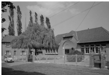
Vue générale. IVR22_19856000743X