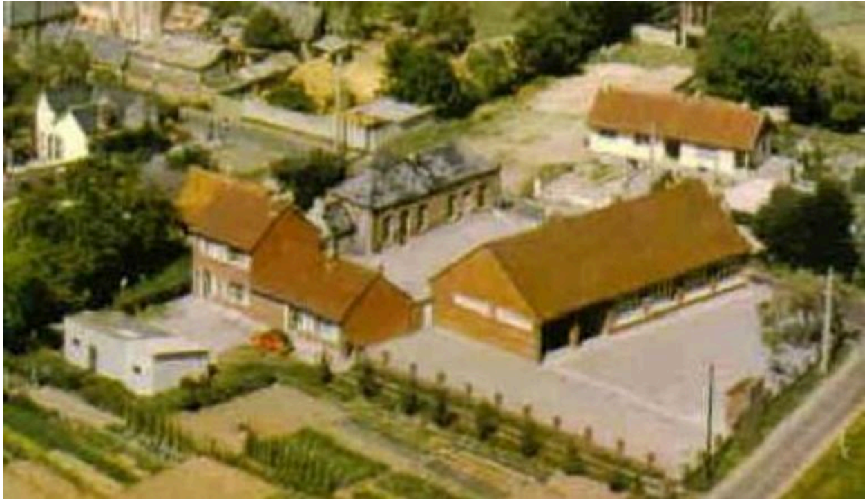
Vue générale, vers 1960 (coll. part.).