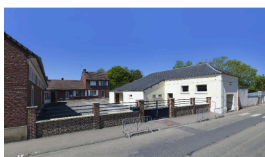
Cour et ancien logement des instituteurs. IVR22_20158000421NUC2AQ