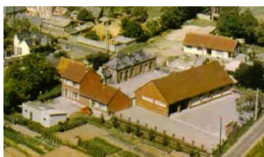
Vue générale, vers 1960 (coll. part.).