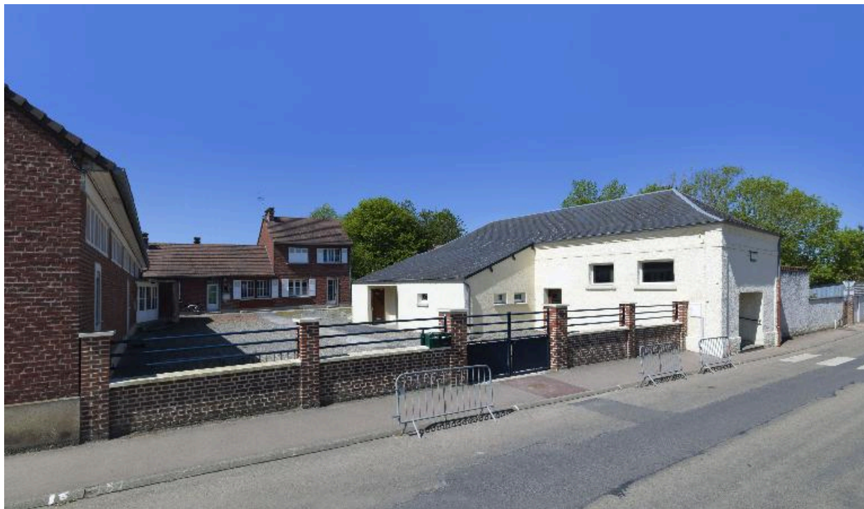
Cour et ancien logement des instituteurs.