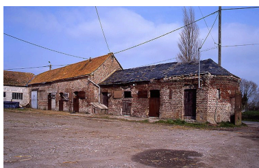
Vue des étables et de la grange à l'ouest de la cour. IVR22_20078000095XA