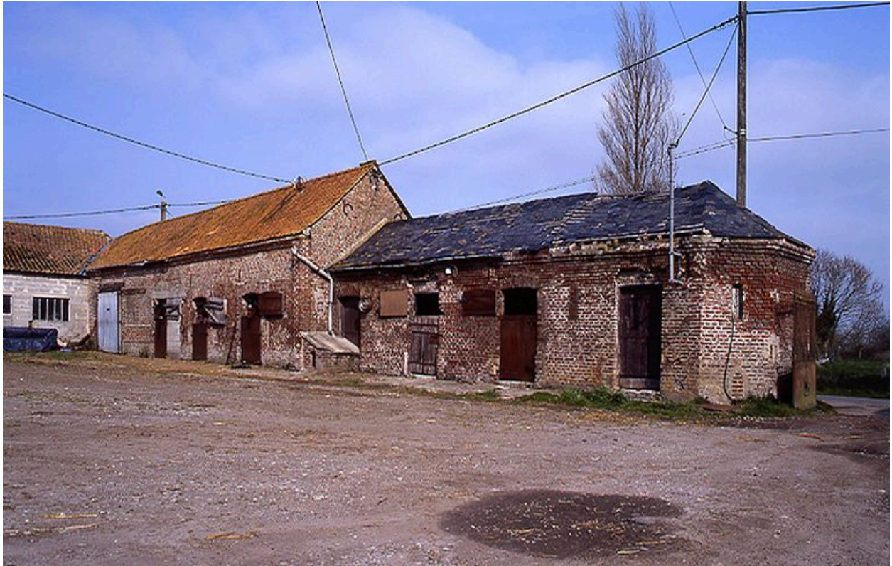
Vue des étables et de la grange à l'ouest de la cour.