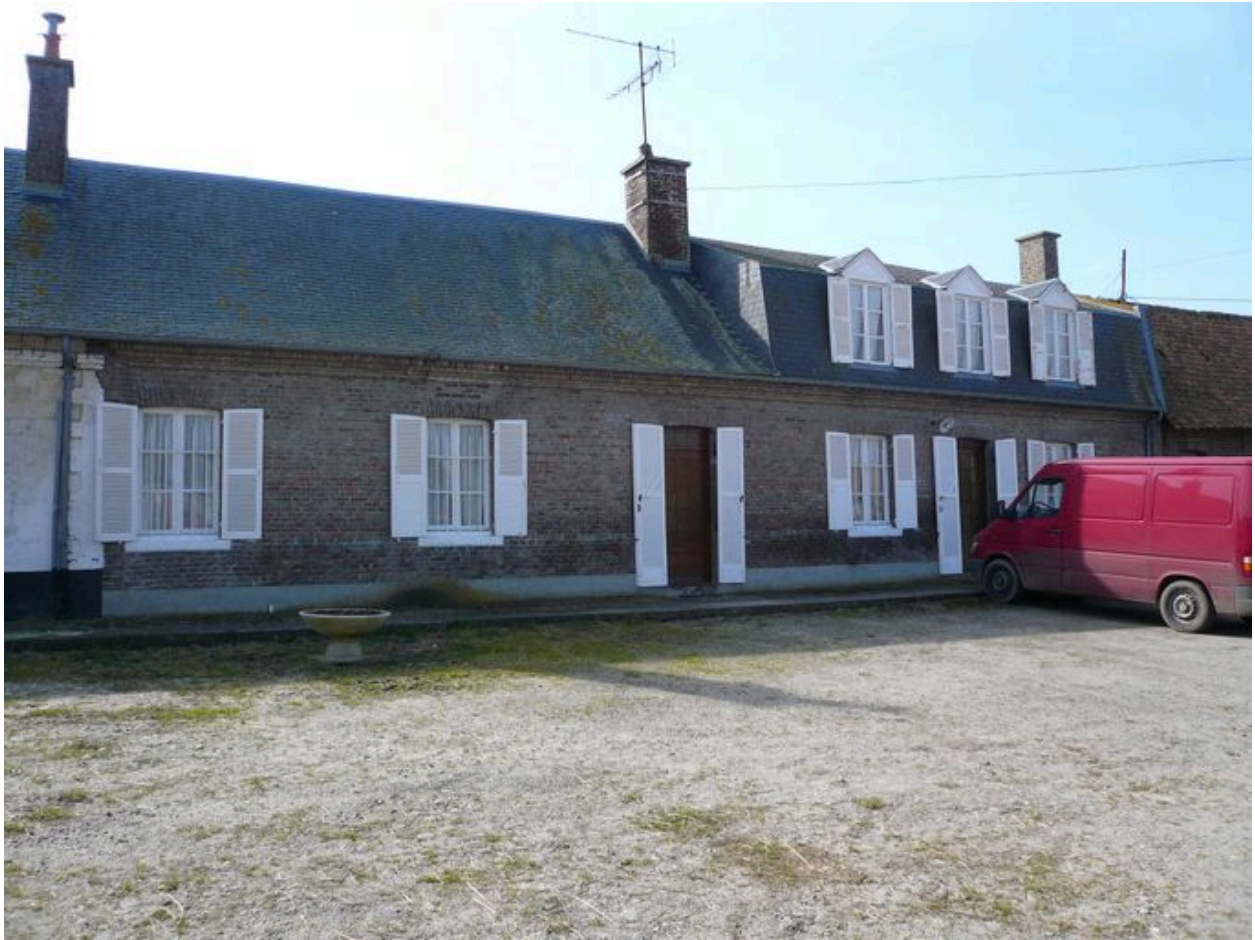
Vue sur le logis en brique et sur les écuries qui lui sont attenantes.