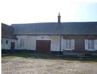
Vue de l'ancien logis en pierre de taille au sud-est de la cour.