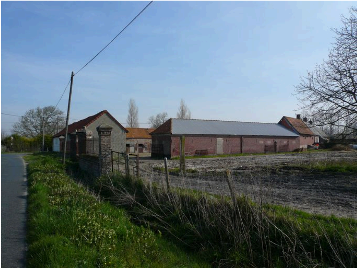
Vue générale de l'ensemble agricole depuis la sud-ouest.