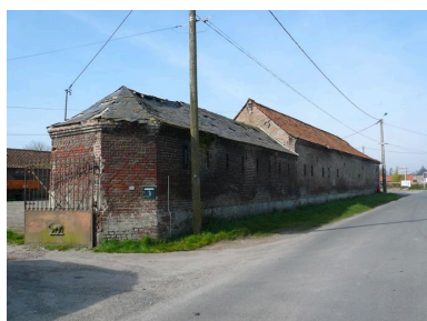
Vue sur les étables depuis la rue datées par les ancrs de 1900 et sur l'entrée principale. IVR22_20058001611NUCA