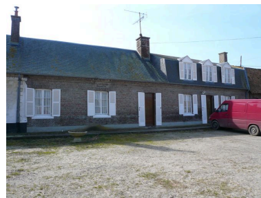
Vue sur le logis en brique et sur les écuries qui lui sont attenantes. IVR22_20058001614NUCA