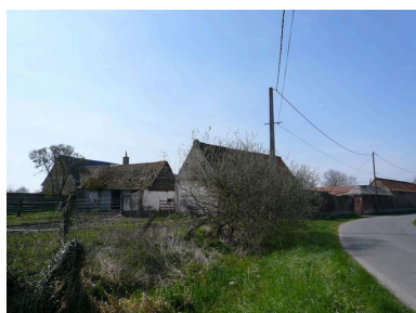
Vue postérieure des étables à l'est. IVR22_20058001612NUCA