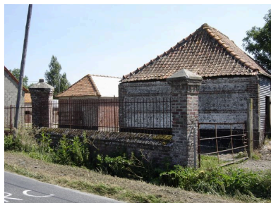
Vue sur l'angle sud-ouest de l'ensemble avant la destruction des bâtiments. IVR22_20058001609NUCA