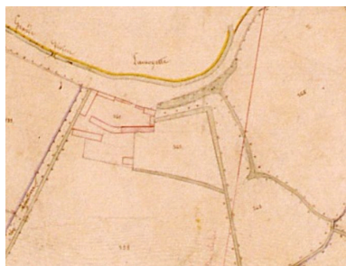
Extrait du cadastre napoléonien présentant le plan de la ferme en 1828.

Phot. Monnehay-Vulliet Marie-Laure IVR22_20078005784XAB