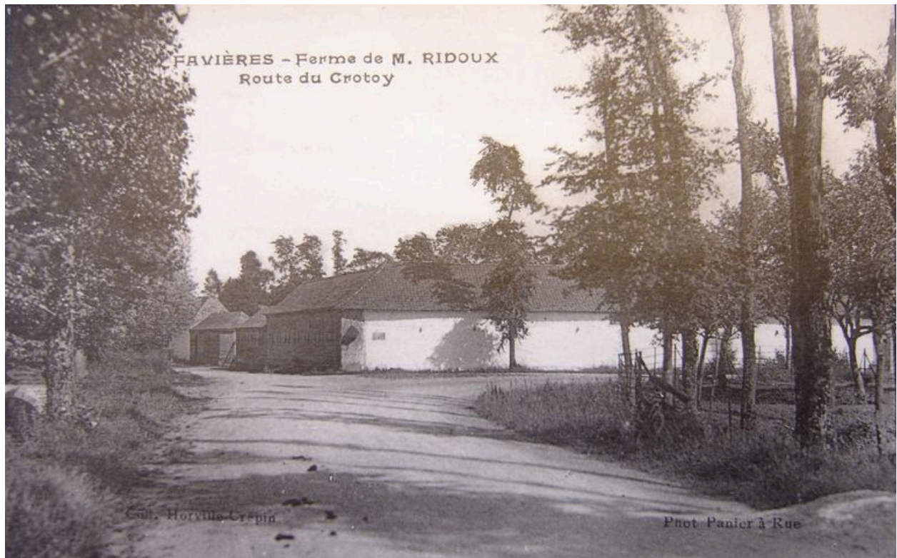
Vue de la ferme au début du 20e siècle.