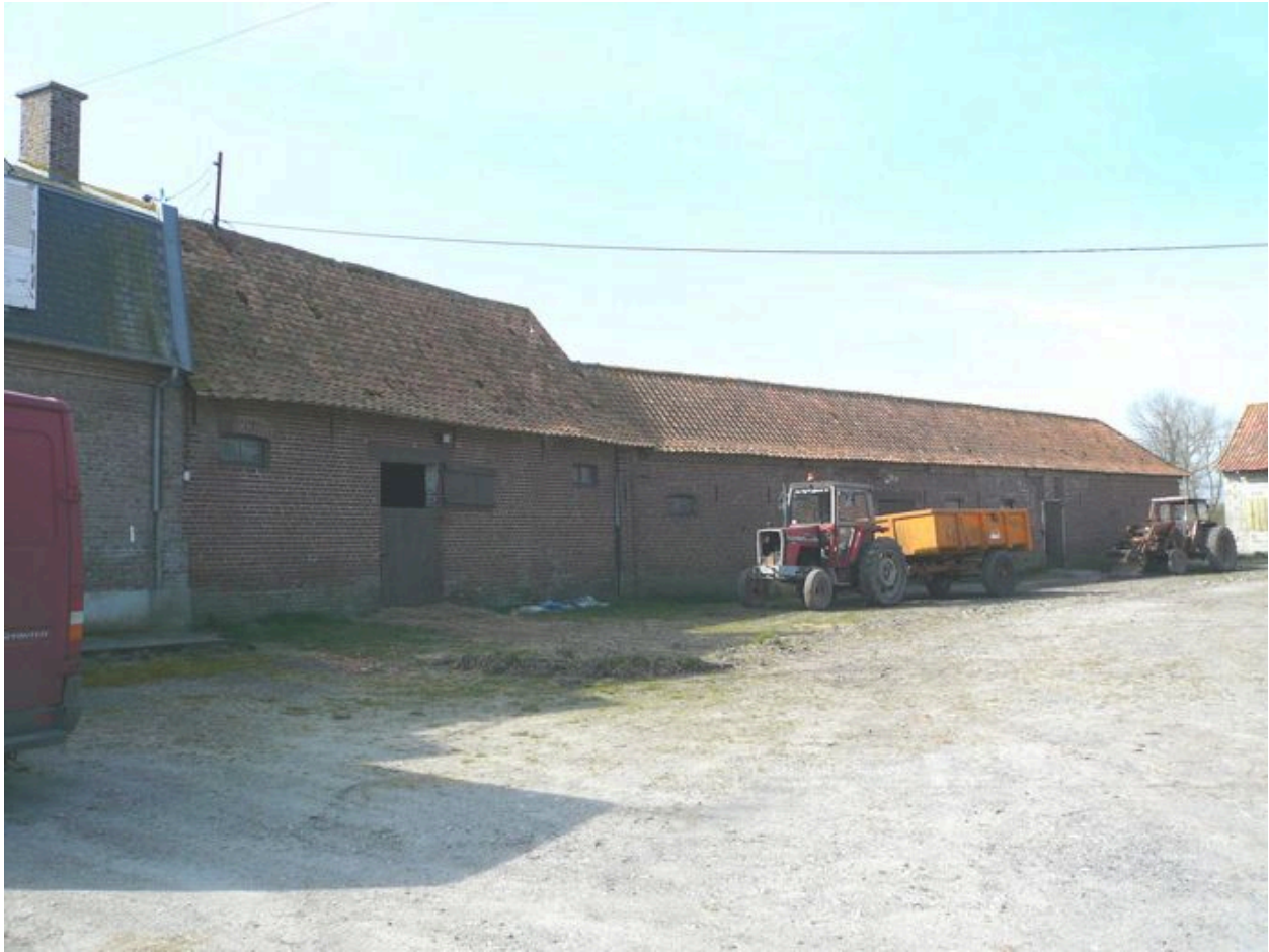
Vue des écuries dans le prolongement du logis.