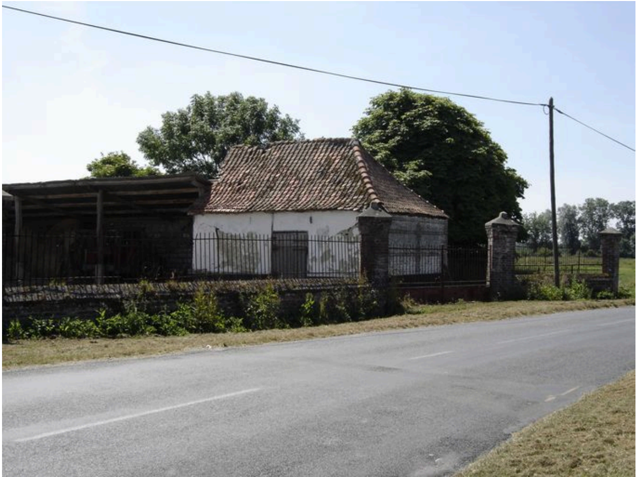
Vue sur l'entrée à l'ouest.