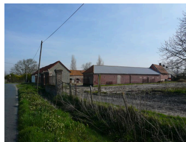
Vue générale de l'ensemble agricole depuis la sud-ouest.

IVR22_20078005791NUCAB