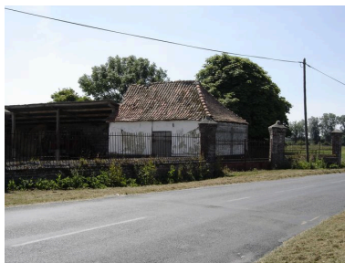
Vue sur l'entrée à l'ouest. IVR22_20058001608NUCA