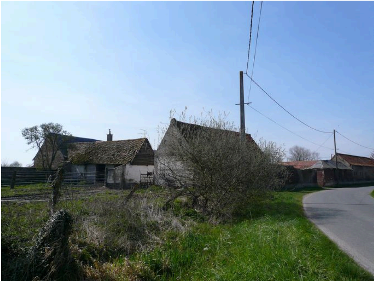
Vue postérieure des étables à l'est.