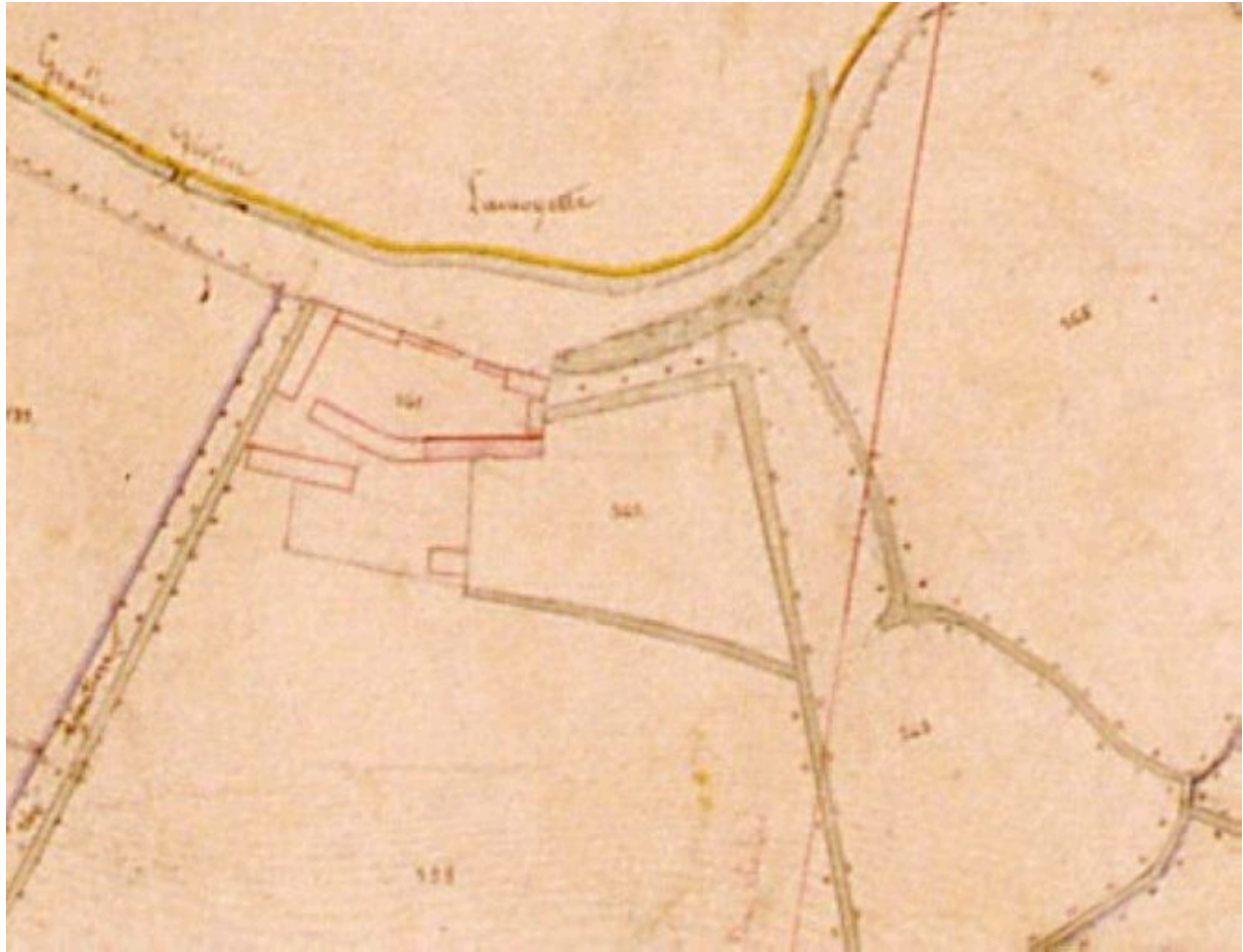
Extrait du cadastre napoléonien présentant le plan de la ferme en 1828.