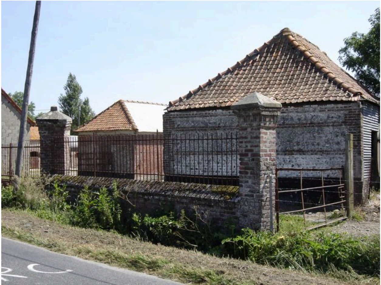
Vue sur l'angle sud-ouest de l'ensemble avant la destruction des bâtiments.