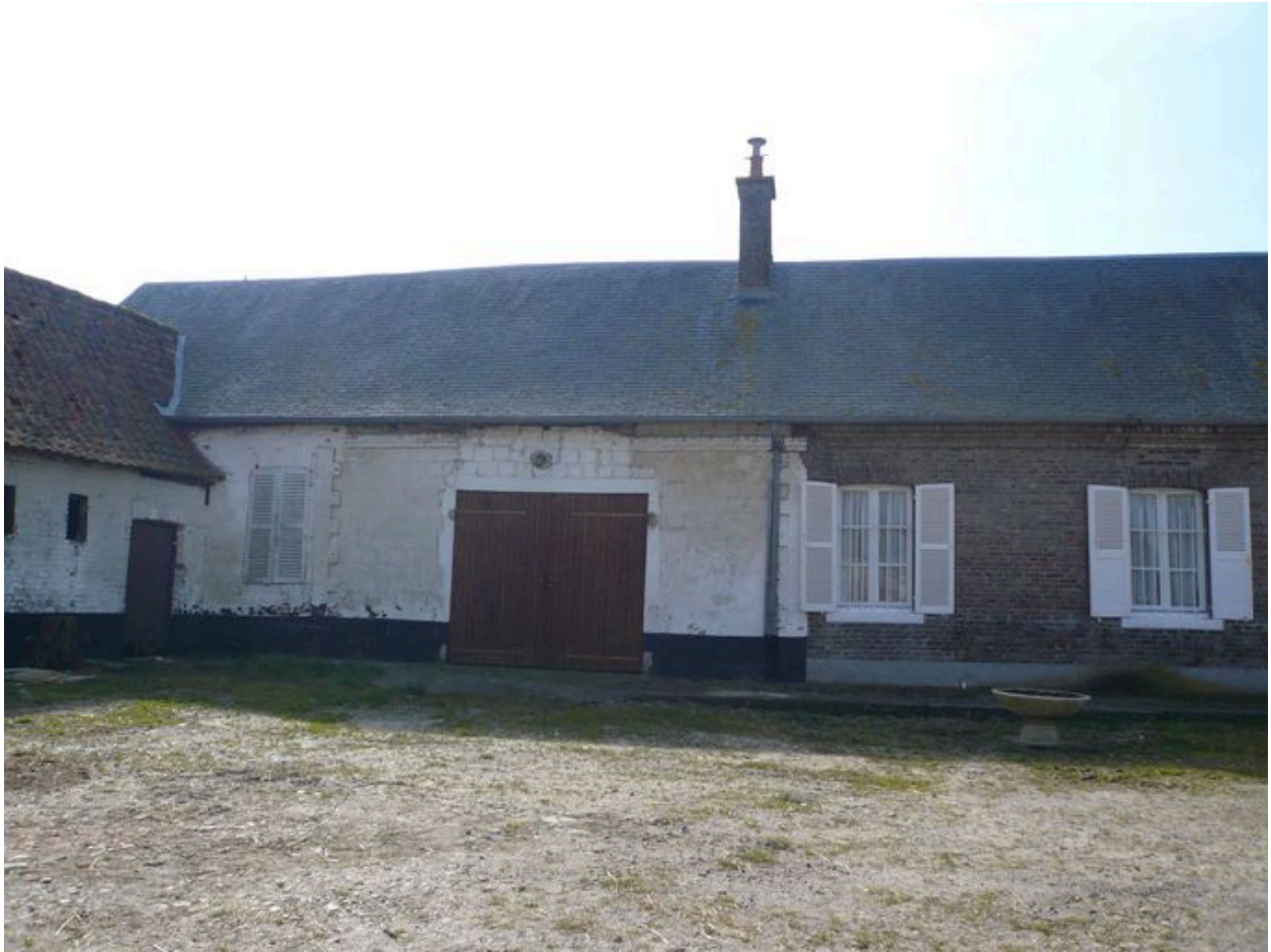
Vue de l'ancien logis en pierre de taille au sud-est de la cour.