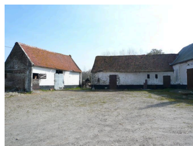
Vue des écuries sur rue et des étables à l'est de la cour. IVR22_20078005906NUCA