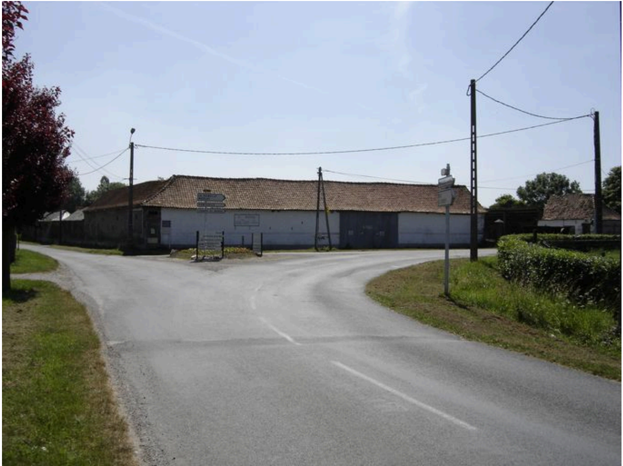
Vue de la grange depuis la rue des Forges.