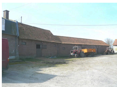
Vue des écuries dans le prolongement du logis.