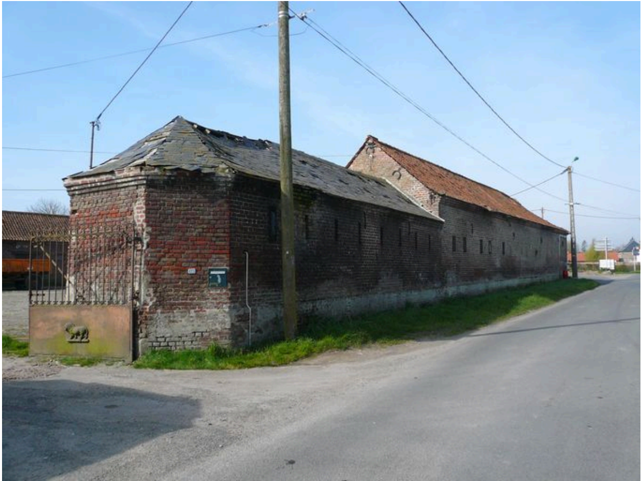
Vue sur les étables depuis la rue datées par les ancrs de 1900 et sur l'entrée principale.