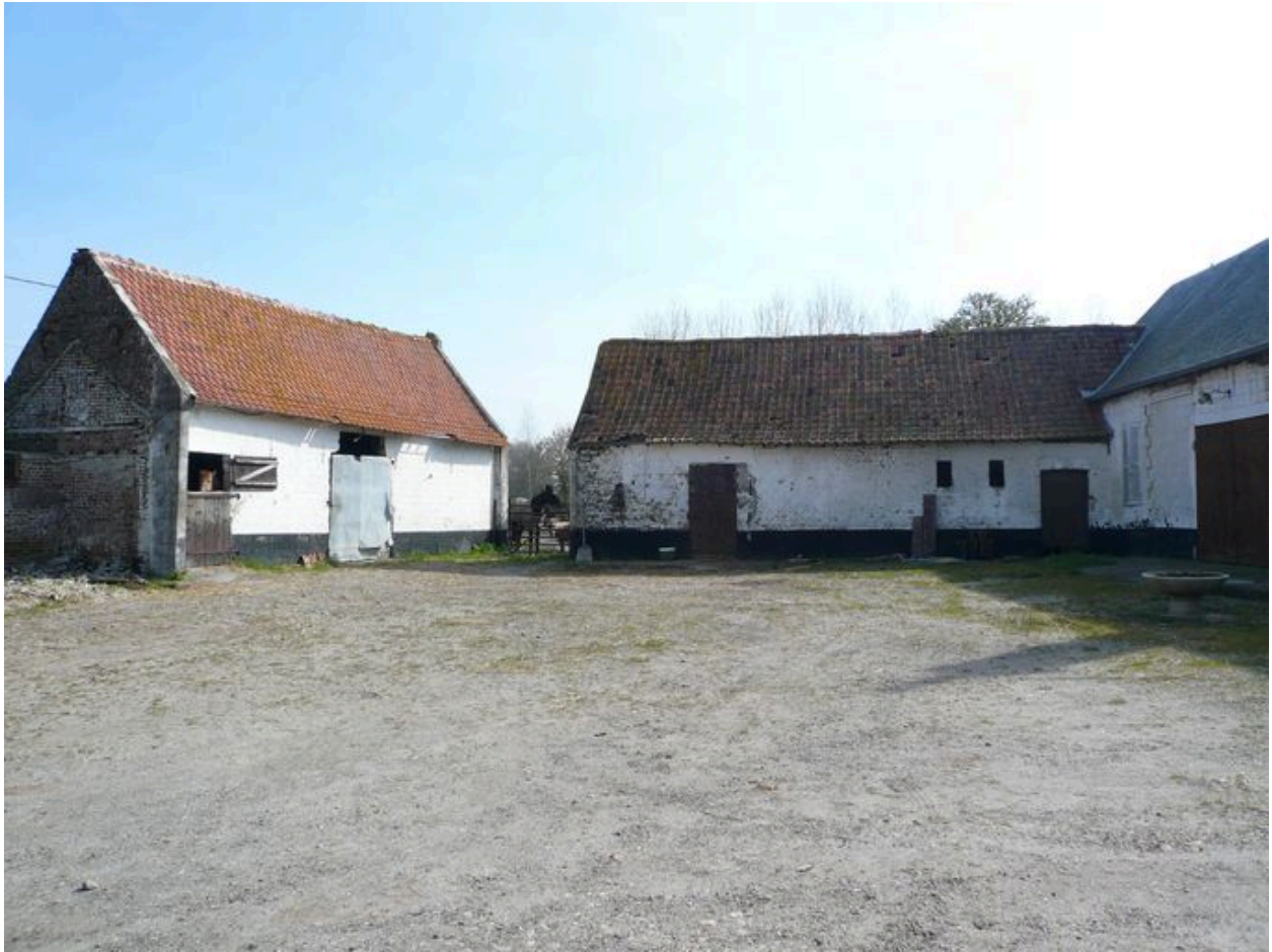
Vue des écuries sur rue et des étables à l'est de la cour.