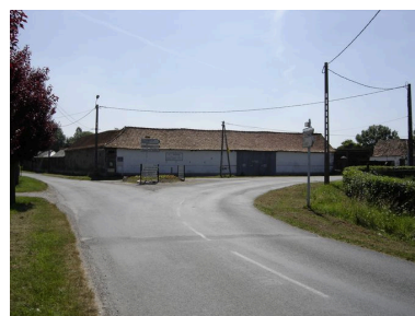
Vue de la grange depuis la rue des Forges.