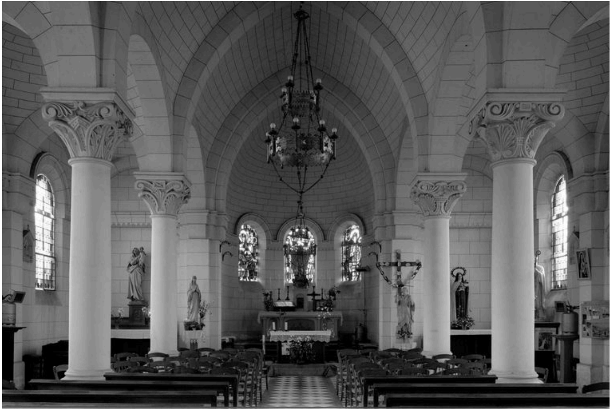
Vue intérieure vers le chœur.