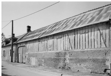
Élévation sur rue. IVR22_19856000871X