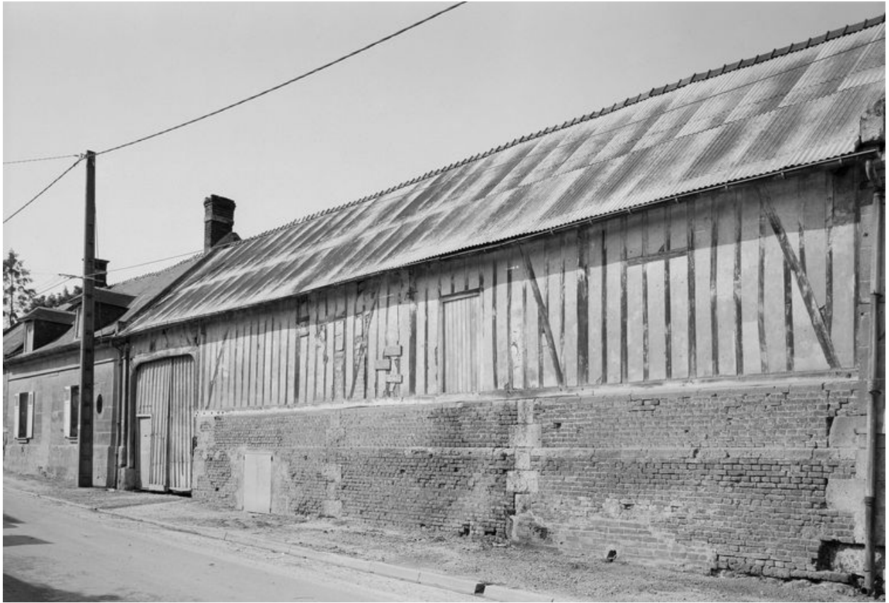
Elévation sur rue.