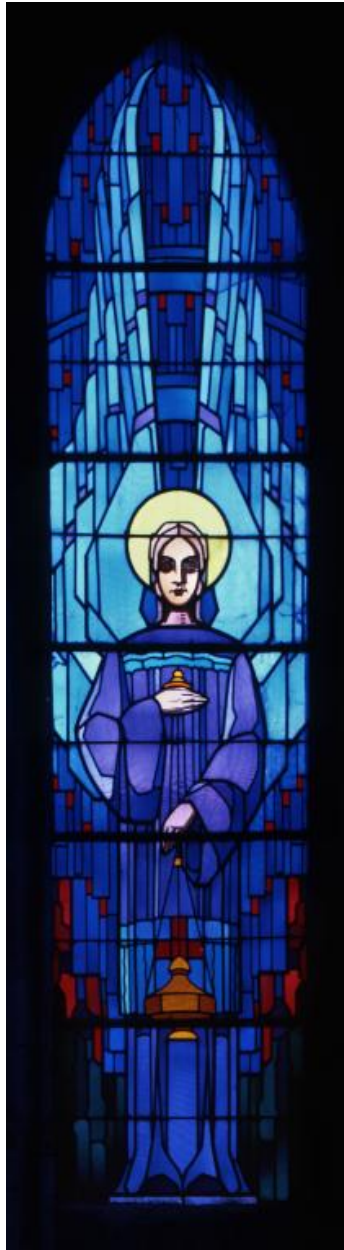
Vue générale de la baie 1