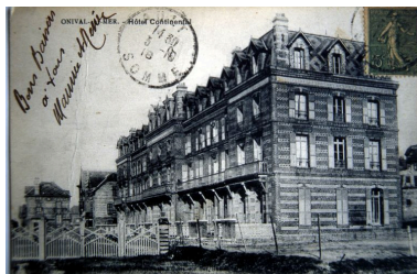
Carte postale, 1er quart 20e siècle (coll. part.).

Phot. Monnehay-Vulliet Marie-Laure IVR22_20058000580XAB