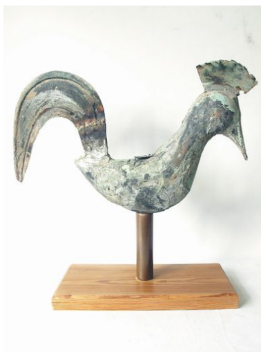
Vue générale, côté droit