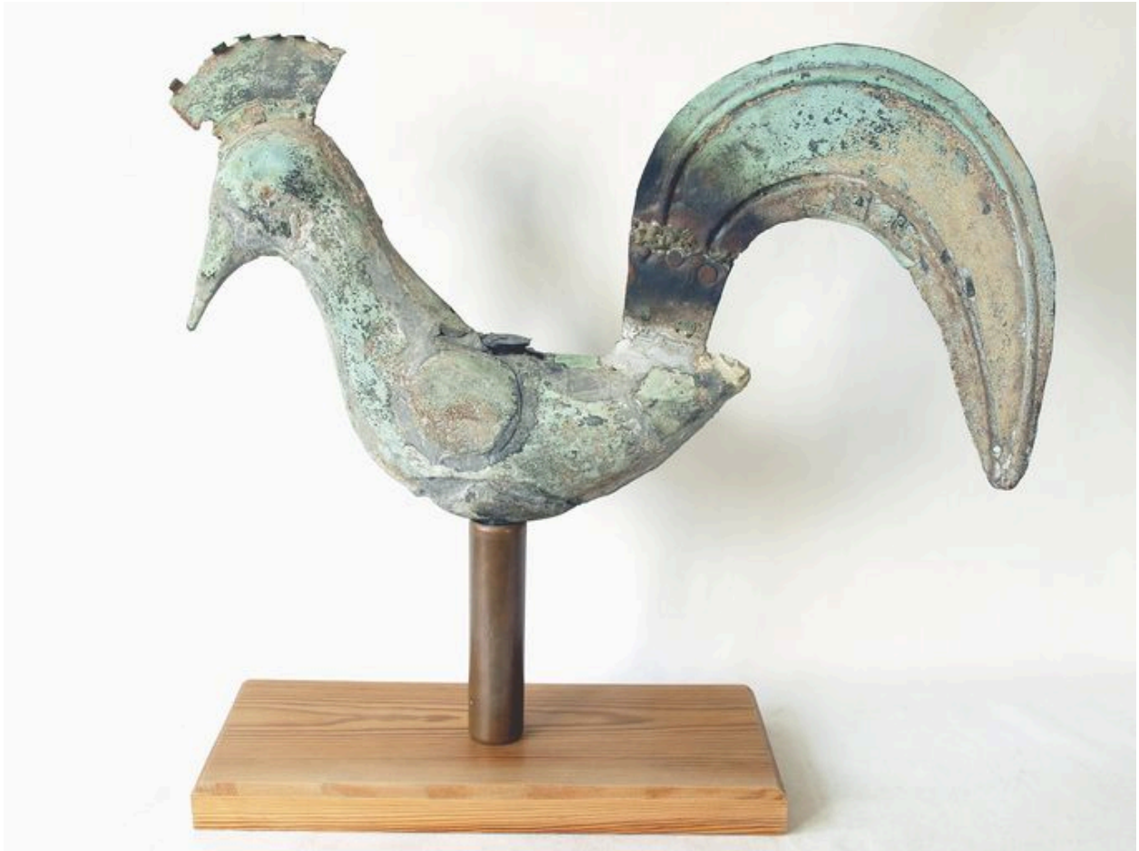
Vue générale, côté gauche