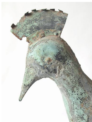
Vue de détail, tête IVR31_20106203277NUCA