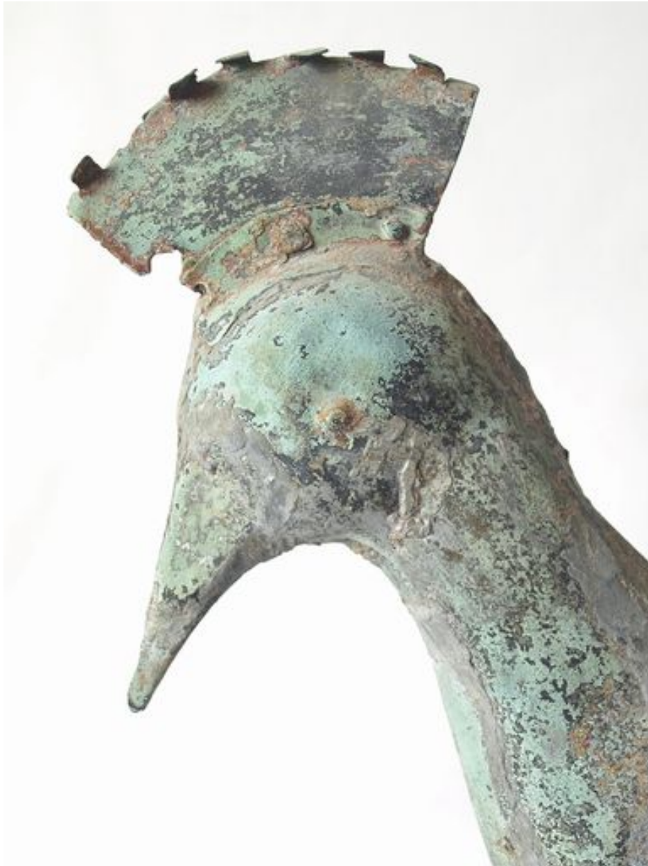
Vue de détail, tête