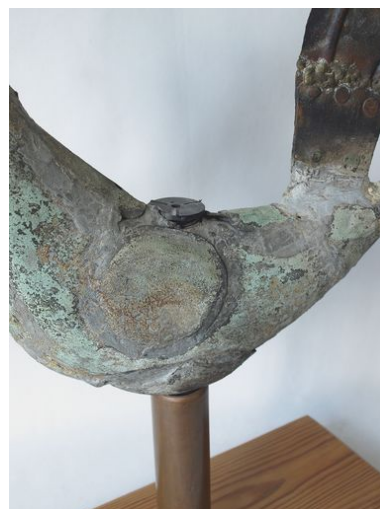
Vue de détail, corps IVR31_20106203278NUCA