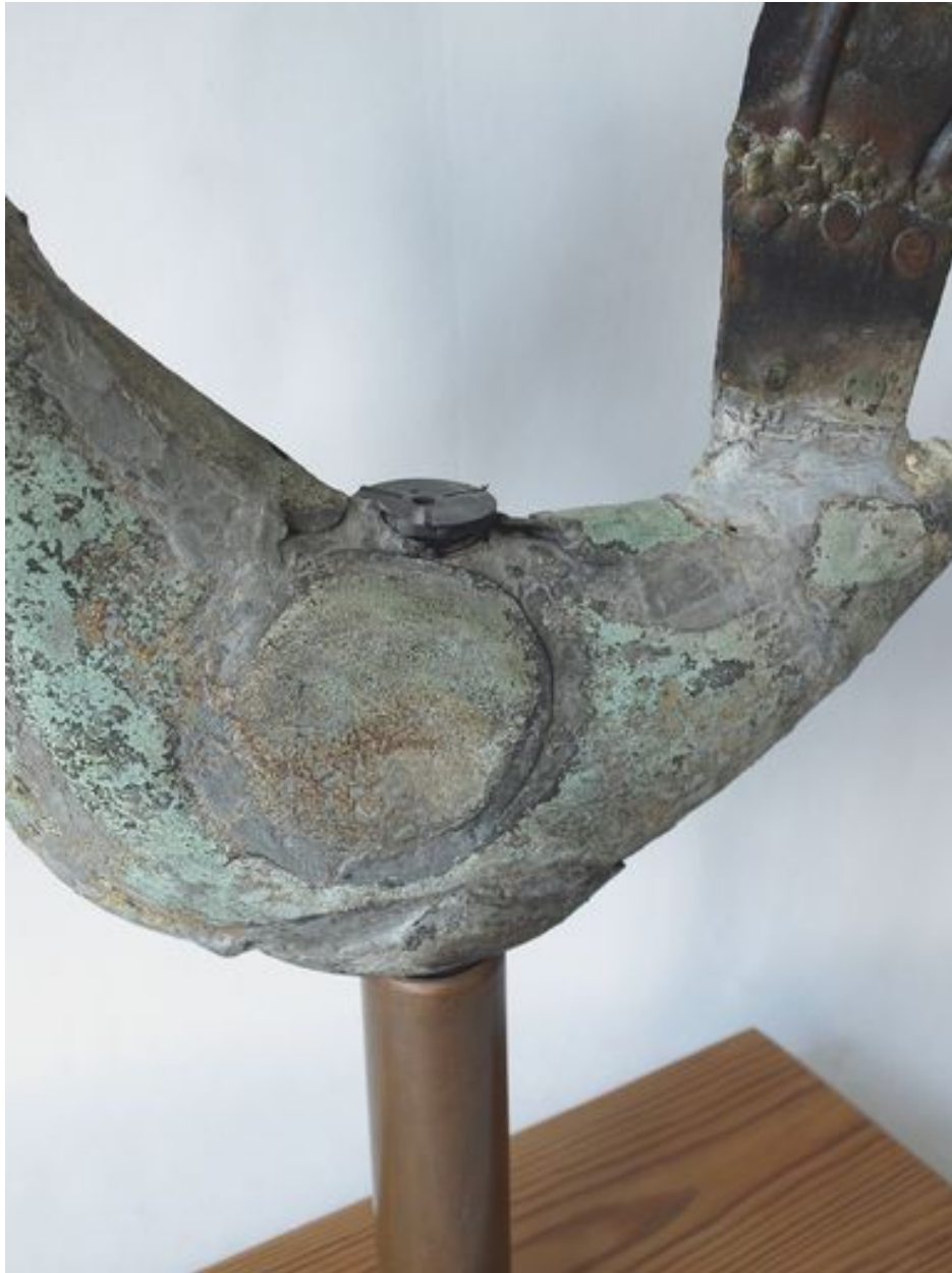
Vue de détail, corps