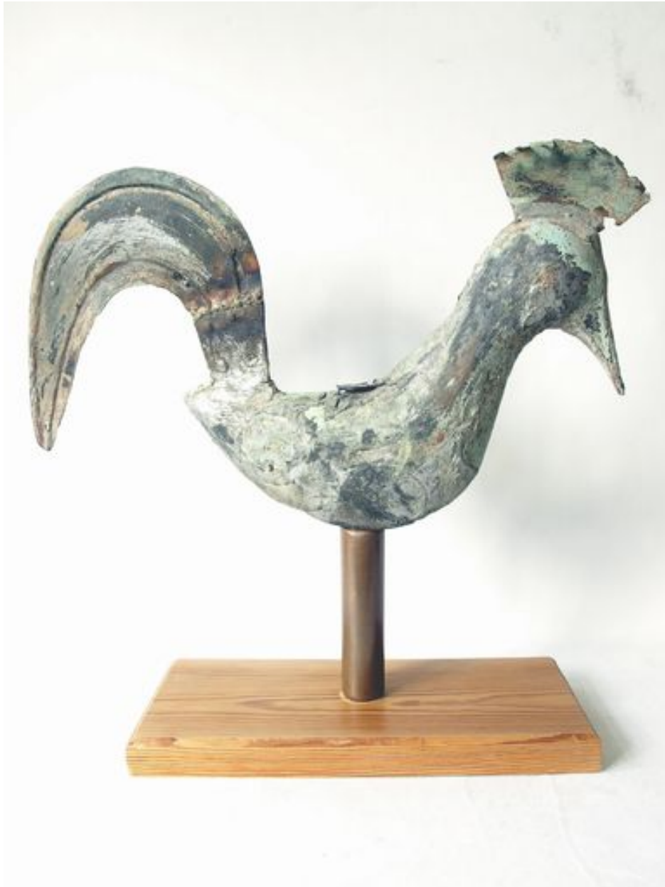
Vue générale, côté droit