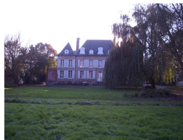
Vue postérieure du château.