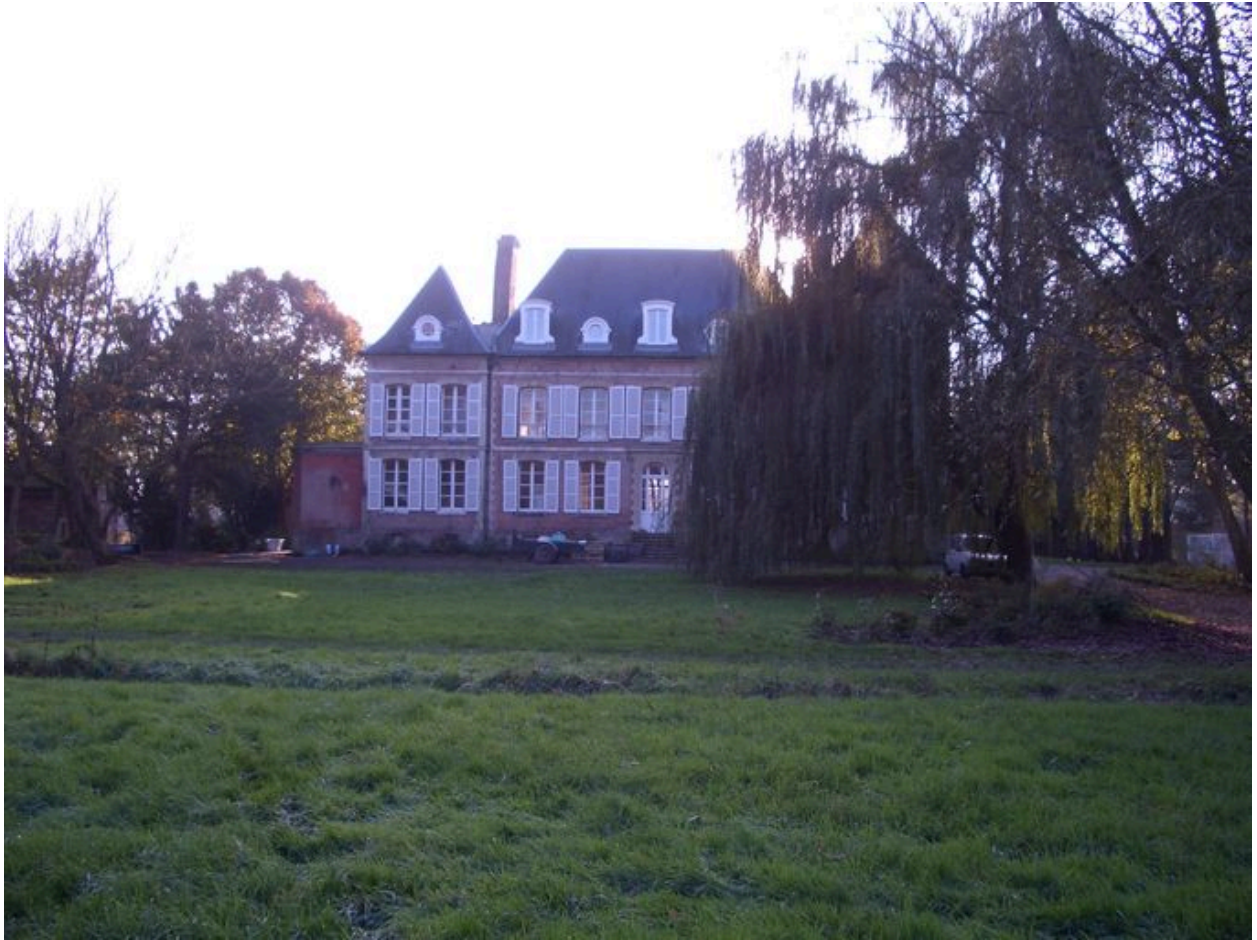
Vue postérieure du château.