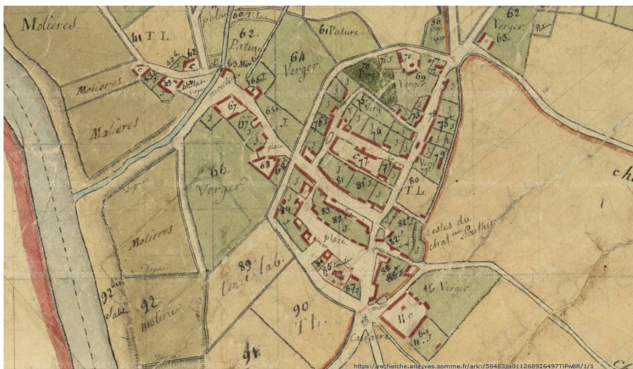
Extrait du plan par masse de culture, 1804 (AD Somme ; 3P 1053).