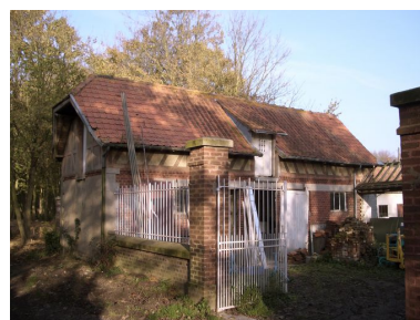
Vue des dépendances agricoles situées à l'est de la propriété. IVR22_20058005195NUCA