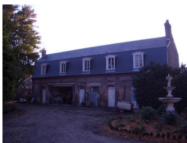
Vue postérieure de la conciergerie.