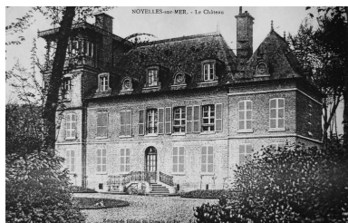
Vue ancienne latérale.