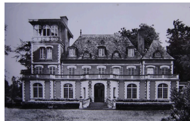
Vue ancienne du château. IVR22_20058005189NUCAB