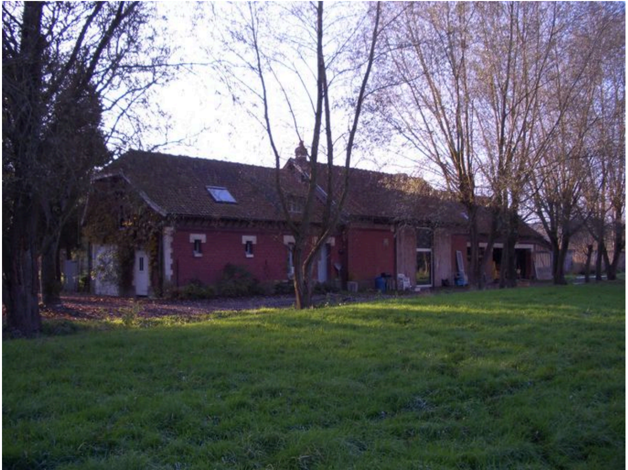
Vue de la même maison depuis le parc.