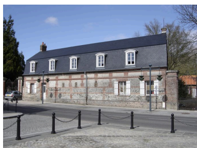
Vue de la conciergerie depuis la rue.