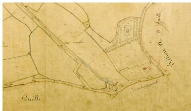
Vue détaillée de la section du cadastre napoléonien présentant le plan du château et de son parc. IVR22_20058001041XAB