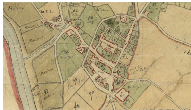
Extrait du plan par masse de culture, 1804 (AD Somme ; 3P 1053). IVR32_20208005212NUCA