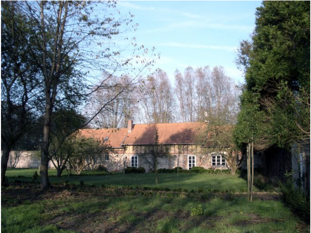
Vue de la maison depuis le sud.