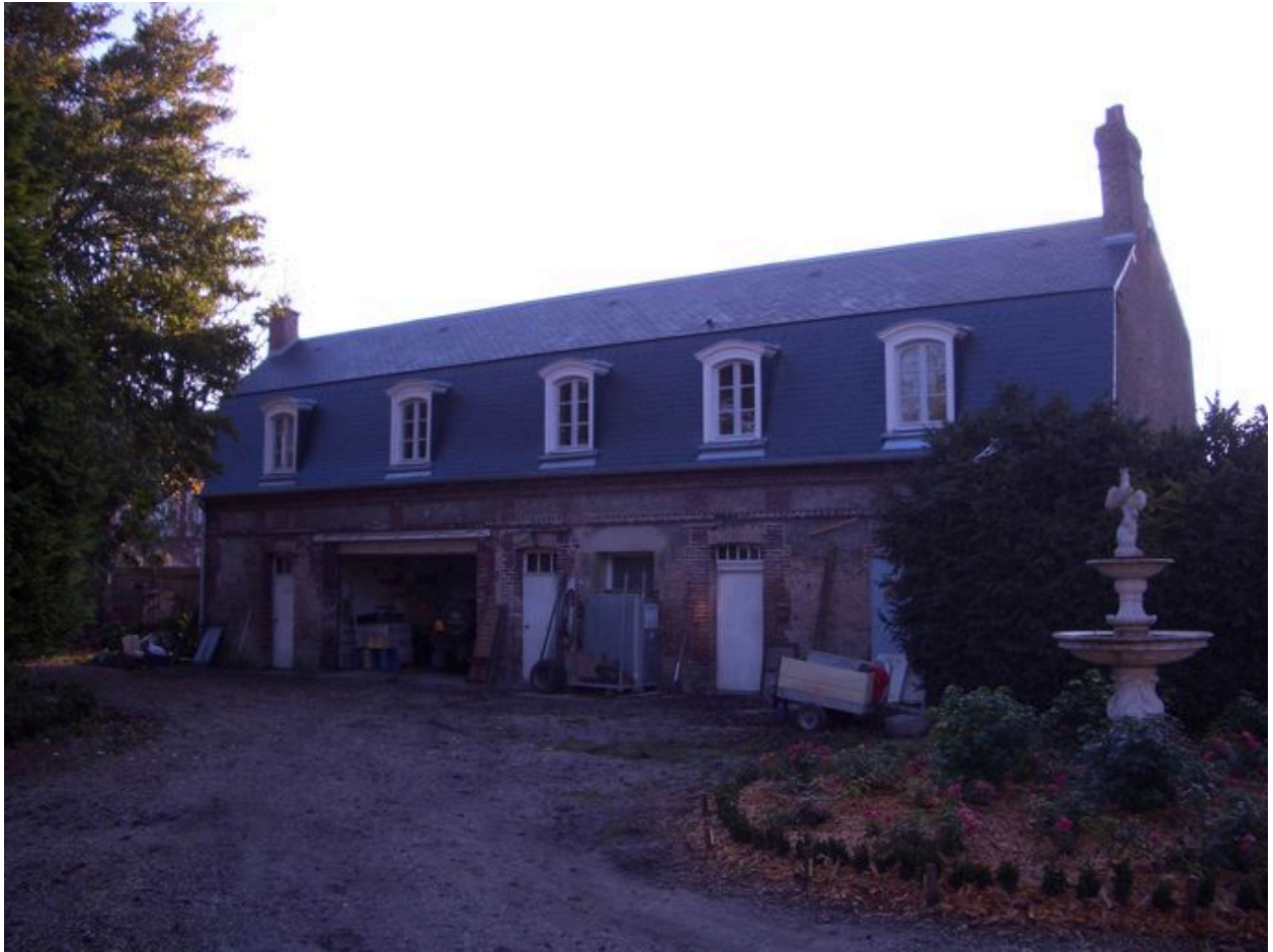
Vue postérieure de la conciergerie.