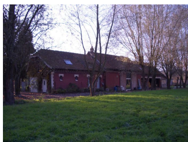
Vue de la même maison depuis le parc.