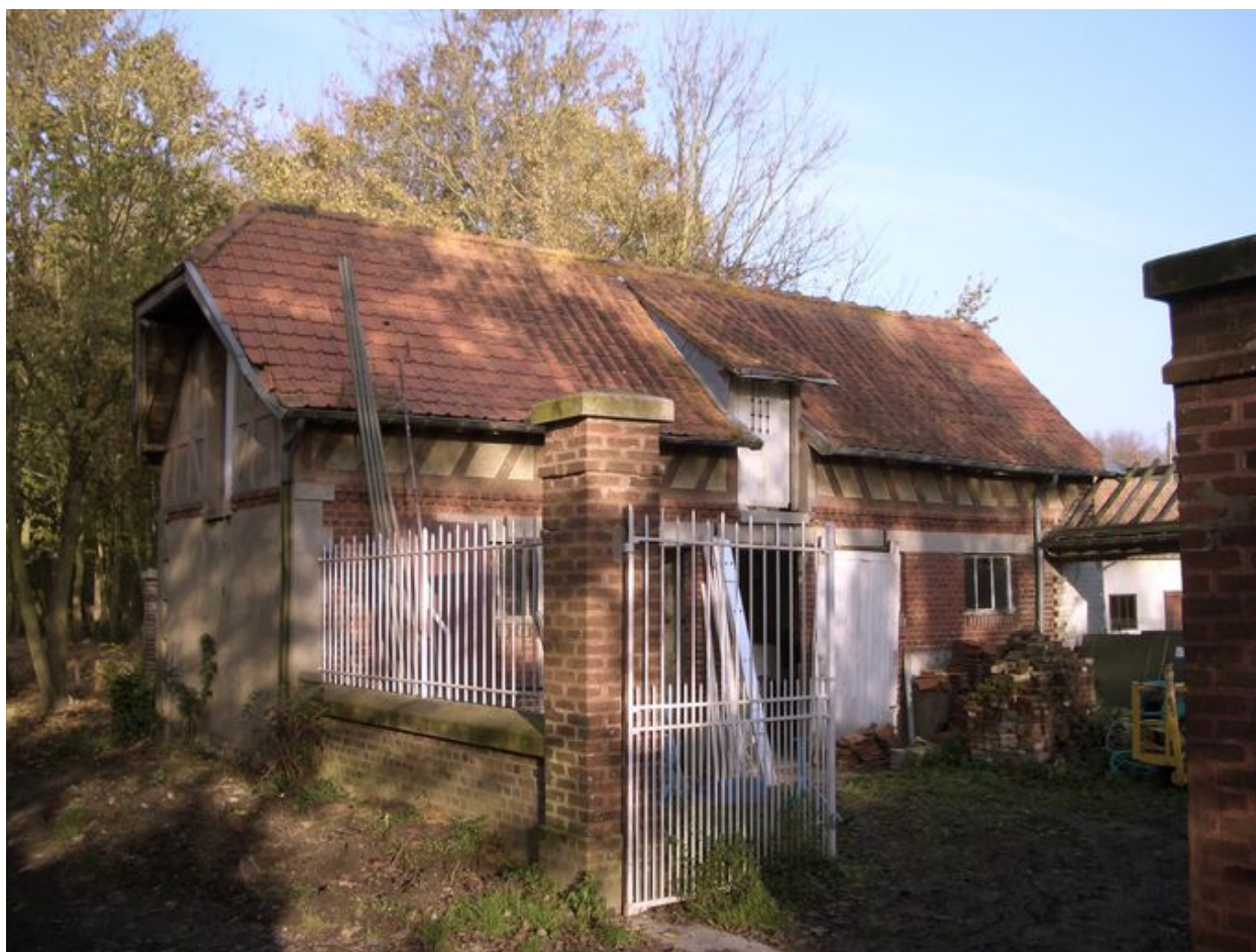
Vue des dépendances agricoles situées à l'est de la propriété.