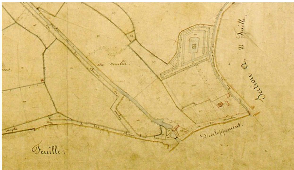
Vue détaillée de la section du cadastre napoléonien présentant le plan du château et de son parc.