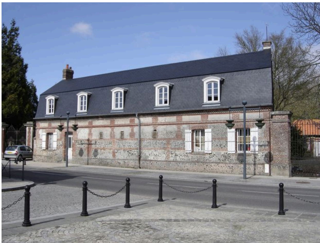
Vue de la conciergerie depuis la rue.