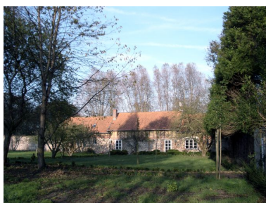
Vue de la maison depuis le sud.