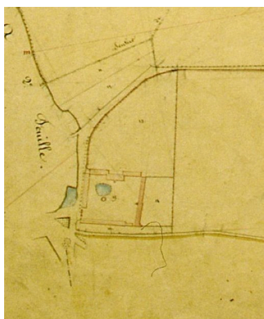
Vue de la propriété en 1833, extrait du cadastre napoléonien.