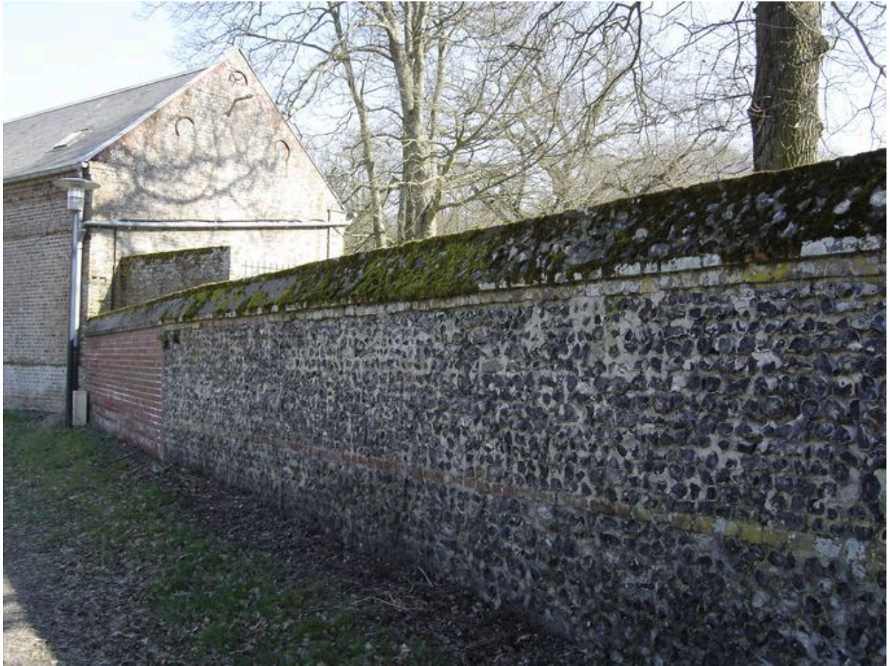
Vue du mur de clôture sur la rue du 8 Mai.