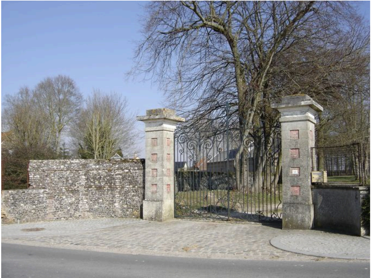
Vue du portail d'entrée sur la rue principale de Noyelles.