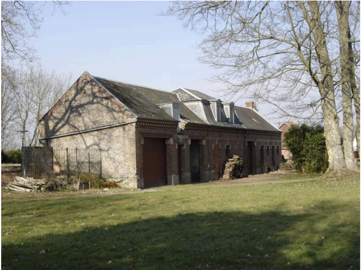
Vue des dépendances agricoles depuis la propriété.