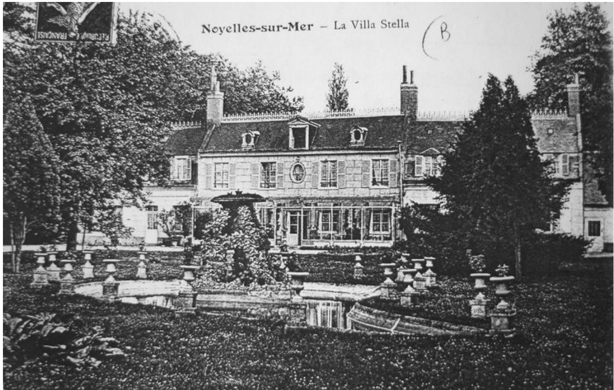
Vue ancienne de la villa avant la Première Guerre mondiale.