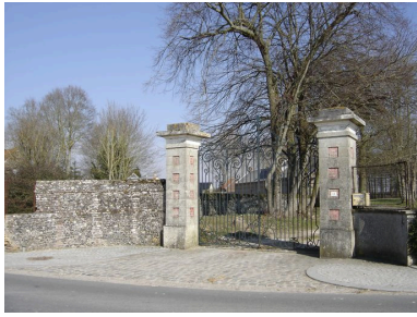
Vue du portail d'entrée sur la rue principale de Noyelles.