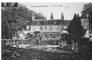
Vue ancienne de la villa avant la Première Guerre mondiale.