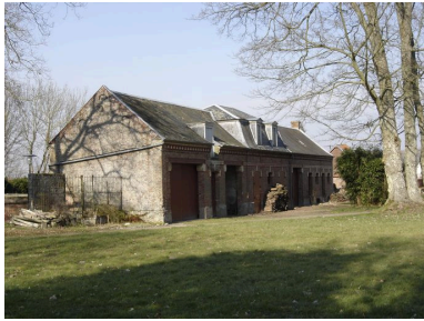
Vue des dépendances agricoles depuis la propriété. IVR22_20058005295NUCA