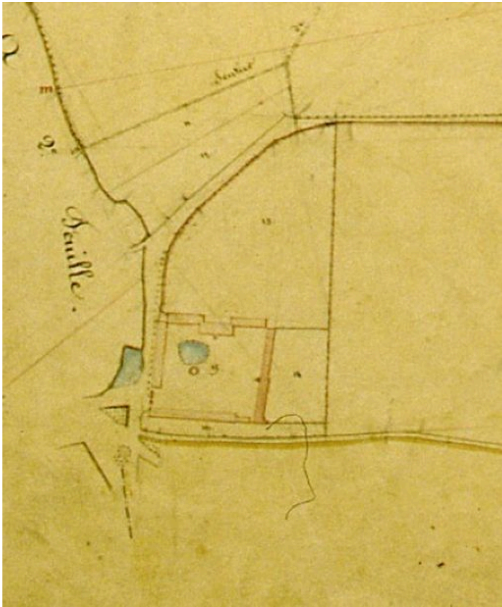
Vue de la propriété en 1833, extrait du cadastre napoléonien.