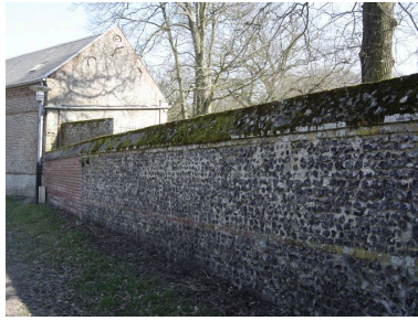
Vue du mur de clôture sur la rue du 8 Mai.