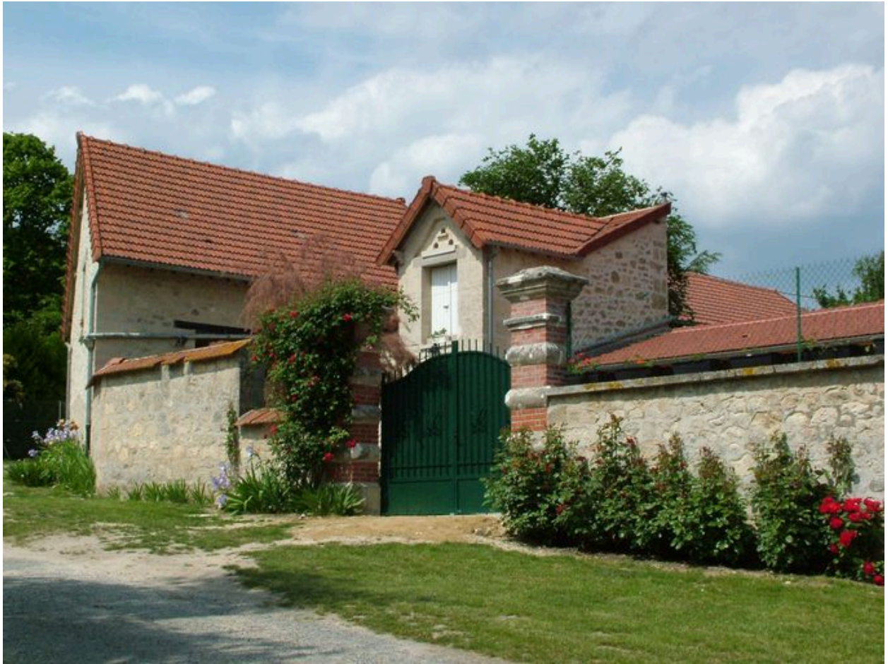
Vue des bâtiments agricoles situés à l'arrière du logis.