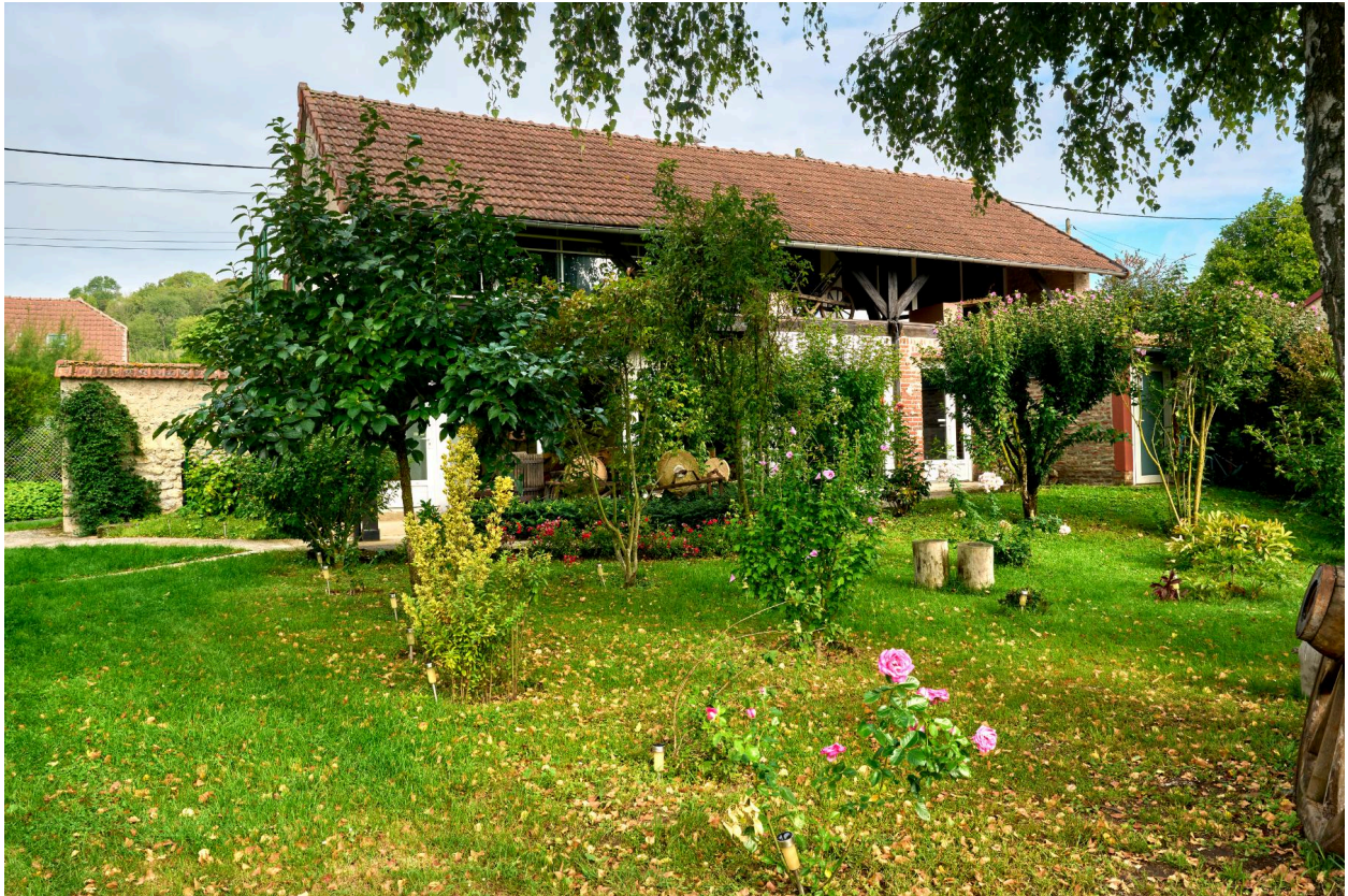
Hangar sur la cour de l'atelier, actuel bâtiment des expositions du musée de Vassogne, vue sud.