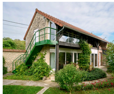
Hangar sur la cour de l'atelier, actuel bâtiment des expositions du musée de Vassogne, vue sud-ouest. IVR32_20230200112NUCA