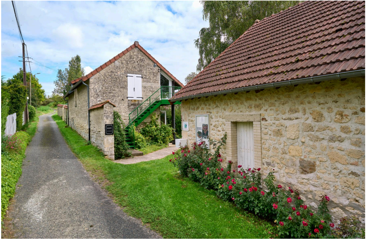
Accès à la cour de l'atelier, vue nord portail ouvert.