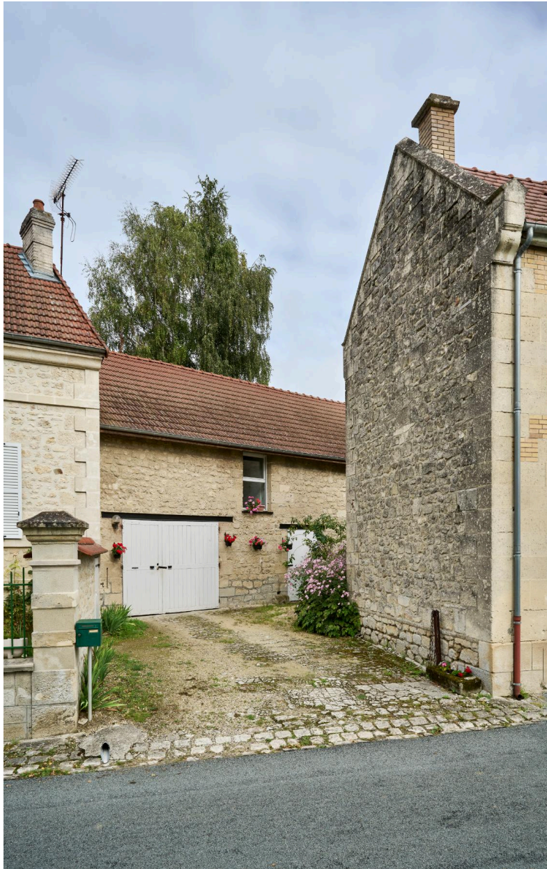
Remise de l'atelier, vue sud.