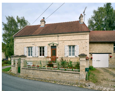
Maison, vue sud. IVR32_20230200117NUCA