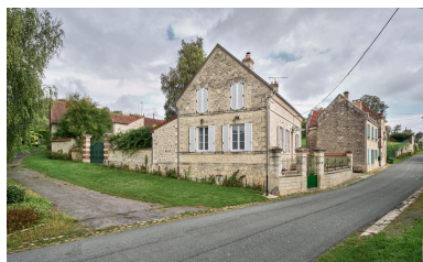
Maison et sa cour, vue ouest sur façade. IVR32_20230200116NUCA