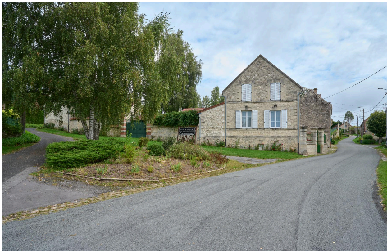
Maison et sa cour, vue ouest sur le carrefour.