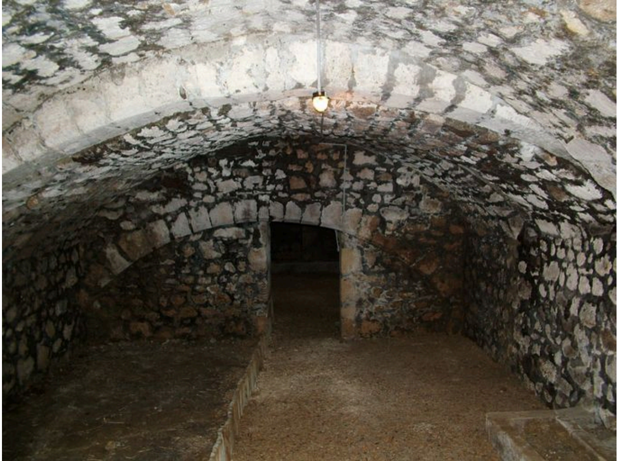
Vue de l'ancienne cave, peut-être du XVIIIe siècle.