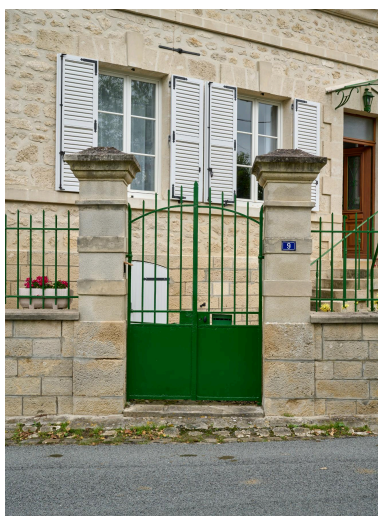
Portillon de la maison, vue sud.