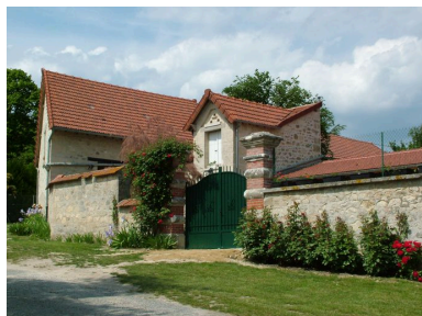
Vue des bâtiments agricoles situés à l'arrière du logis. IVR22_20030203004NUCA