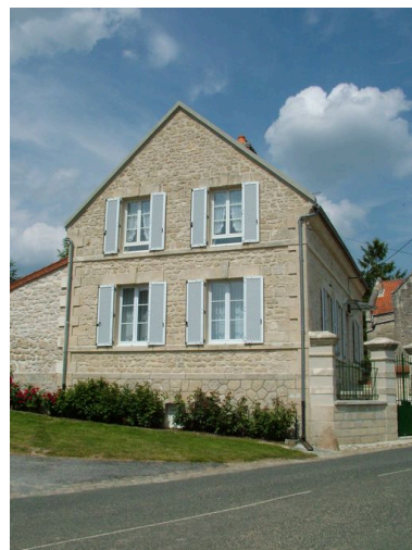
Vue latérale.