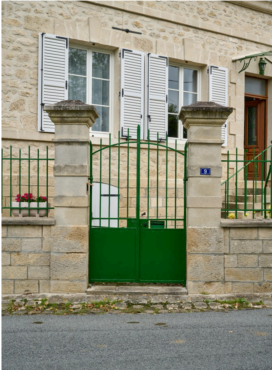
Portillon de la maison, vue sud.