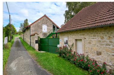
Accès à la cour de l'atelier, vue nord portail fermé.