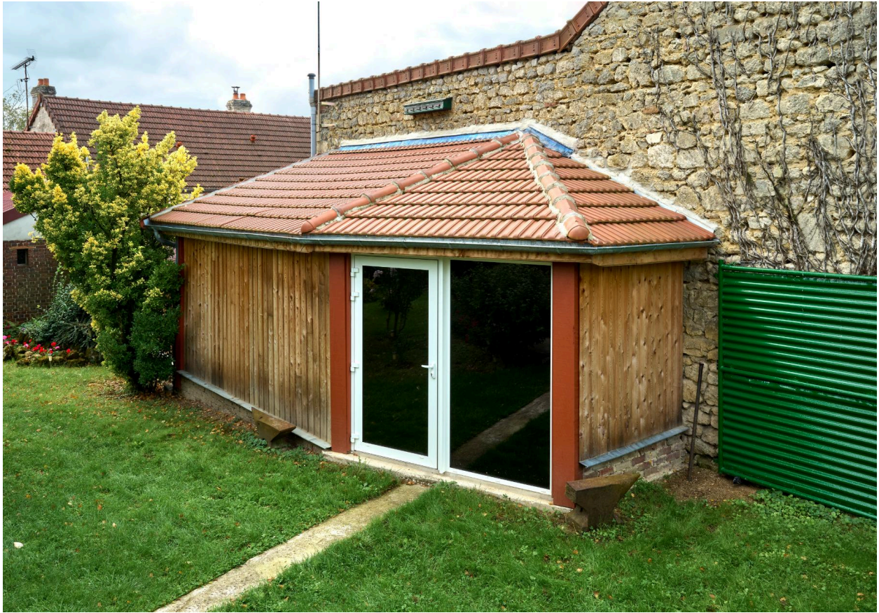
Musée de Vassogne, entrée de la partie Conservatoire des collections et accès à la grange agricole, vue est.