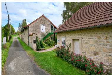
Accès à la cour de l'atelier, vue nord portail ouvert. IVR32_20230200114NUCA