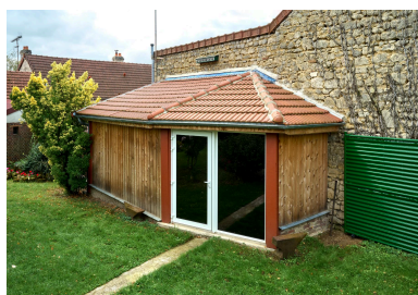
Musée de Vassogne, entrée de la partie Conservatoire des collections et accès à la grange agricole, vue est. IVR32_20230200113NUCA