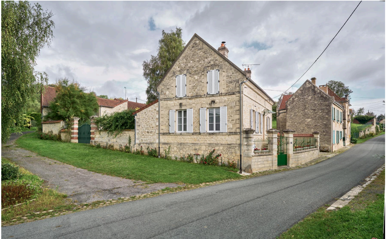
Maison et sa cour, vue ouest sur façade.