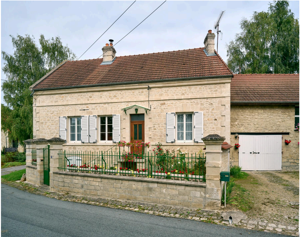
Maison, vue sud.