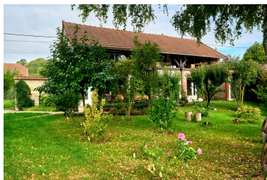
Hangar sur la cour de l'atelier, actuel bâtiment des expositions du musée de Vassogne, vue sud. IVR32_20230200111NUCA