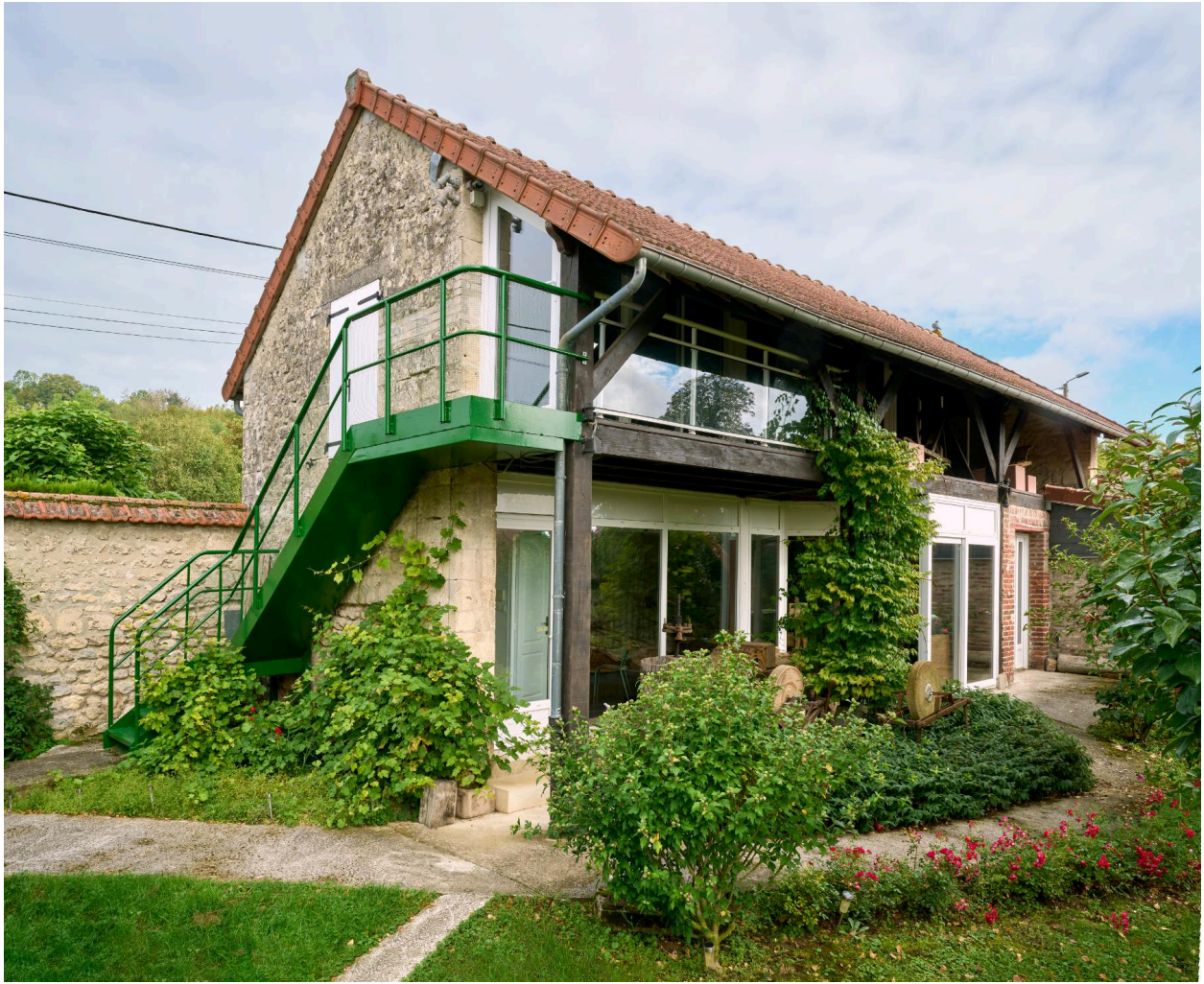
Hangar sur la cour de l'atelier, actuel bâtiment des expositions du musée de Vassogne, vue sud-ouest.