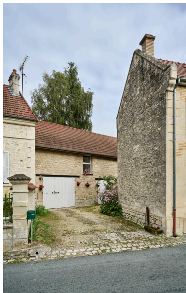
Remise de l'atelier, vue sud. IVR32_20230200118NUCA