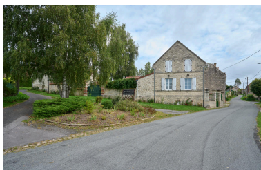
Maison et sa cour, vue ouest sur le carrefour. IVR32_20230200120NUCA