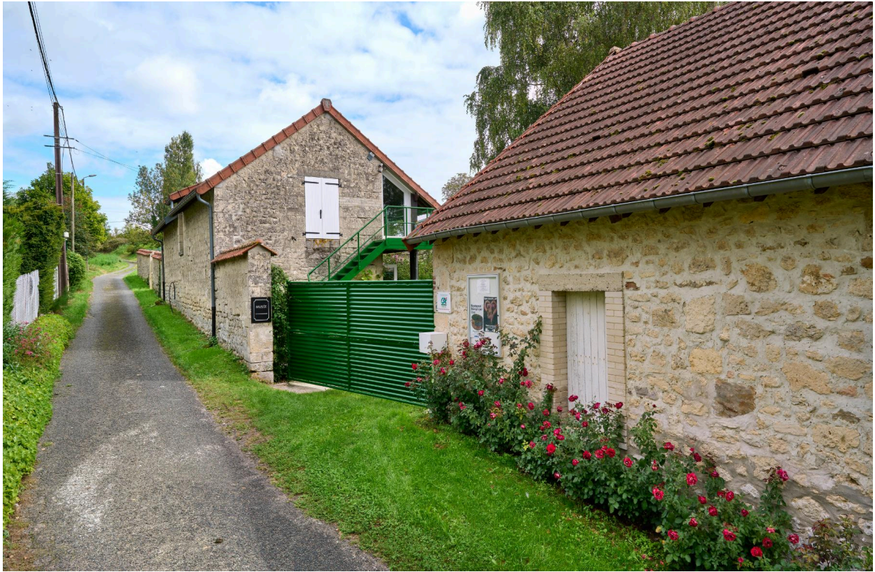
Accès à la cour de l'atelier, vue nord portail fermé.