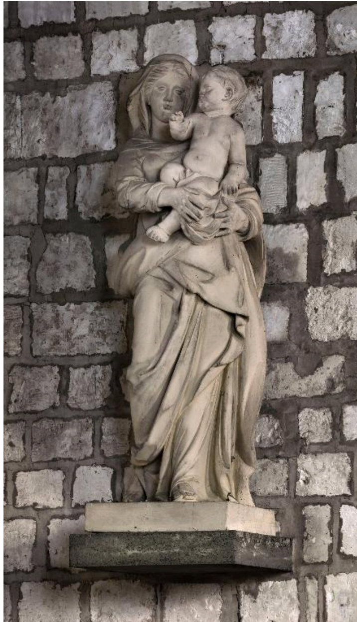
Vierge à l'Enfant.