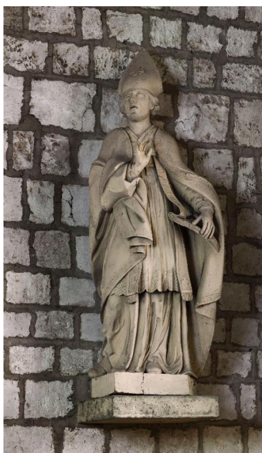
Saint Ouen. IVR22_20148000025NUC2A