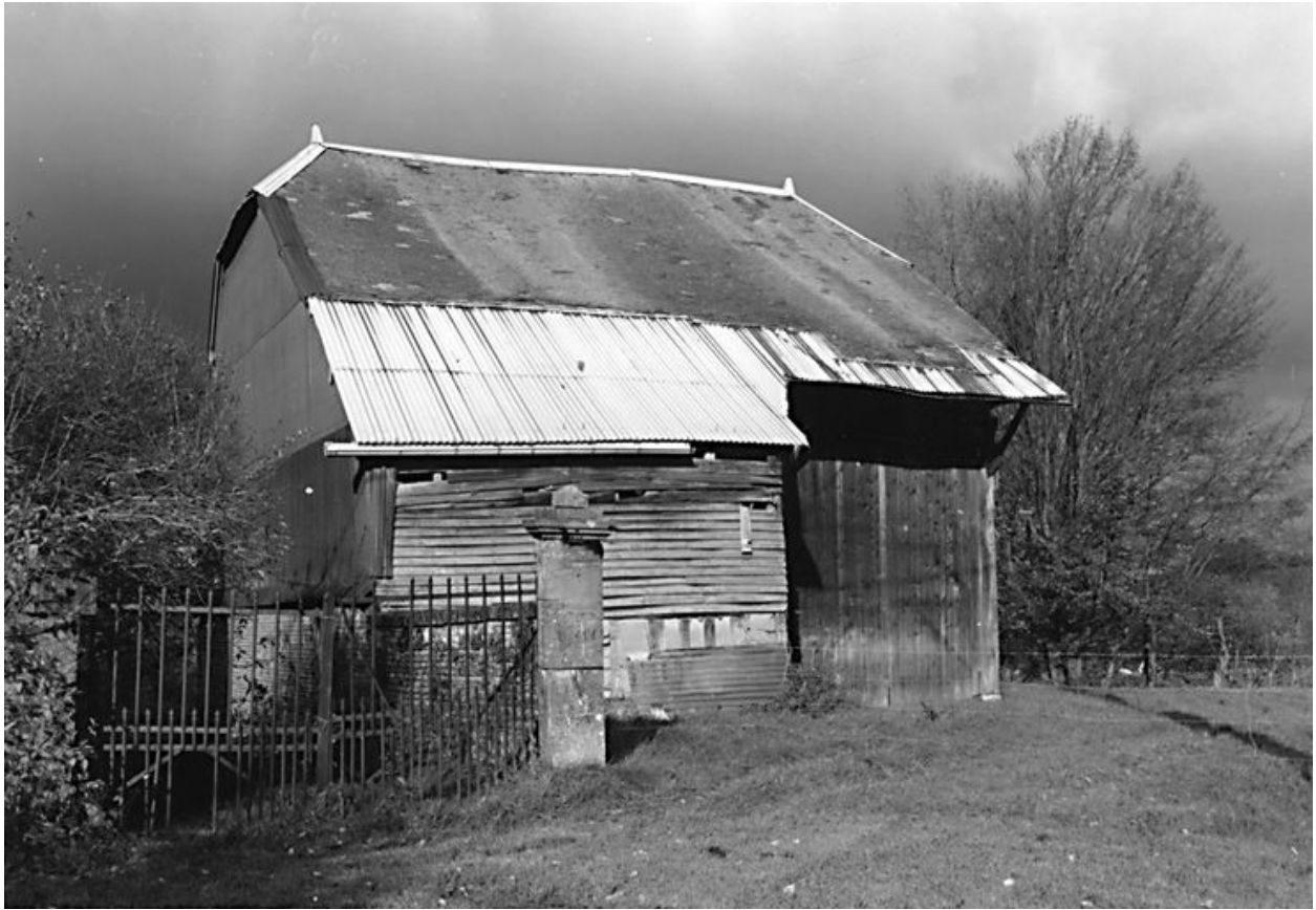
Vue de la grange traversante.