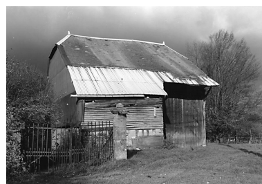
Vue de la grange traversante.