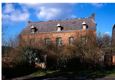
Vue du logis. IVR22_19980205222XA

IVR22_20080290117NUCA