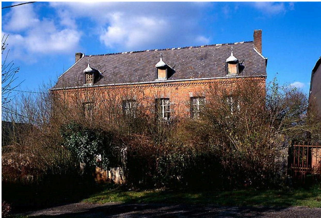
Vue du logis.