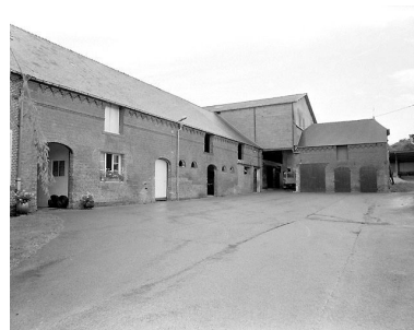
Etable à vaches attenante au logis et grange. IVR22_19980201021X