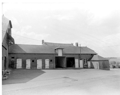
Grange, étable à chevaux et remise agricole. IVR22_19980201019X