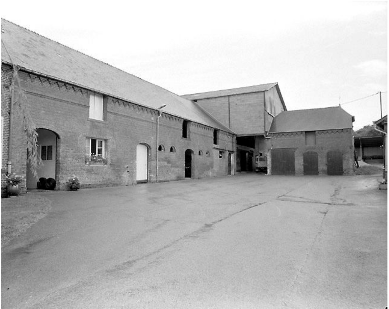
Etable à vaches attenante au logis et grange.