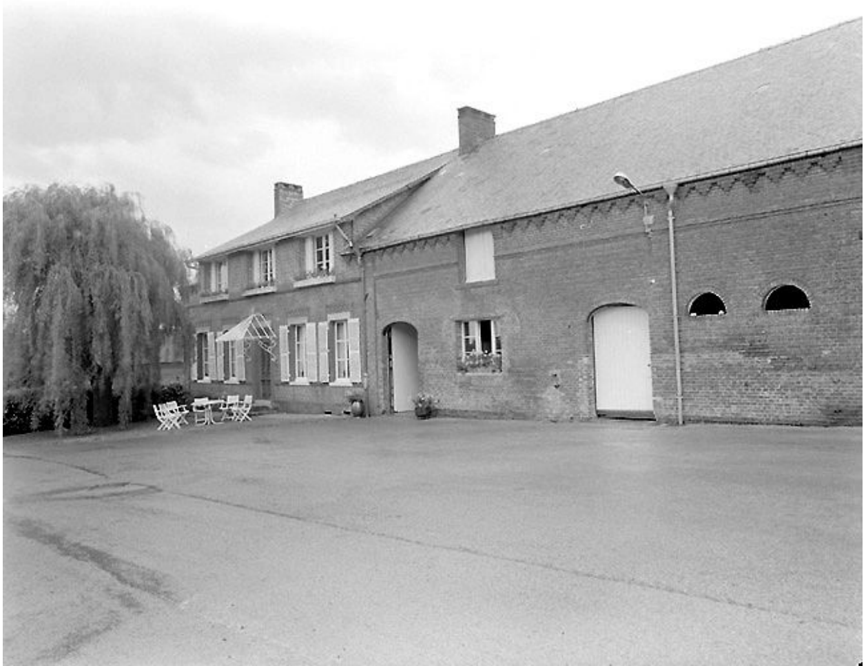
Logis et étable attenante.