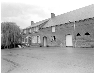
Logis et étable attenante. IVR22_19980201018X