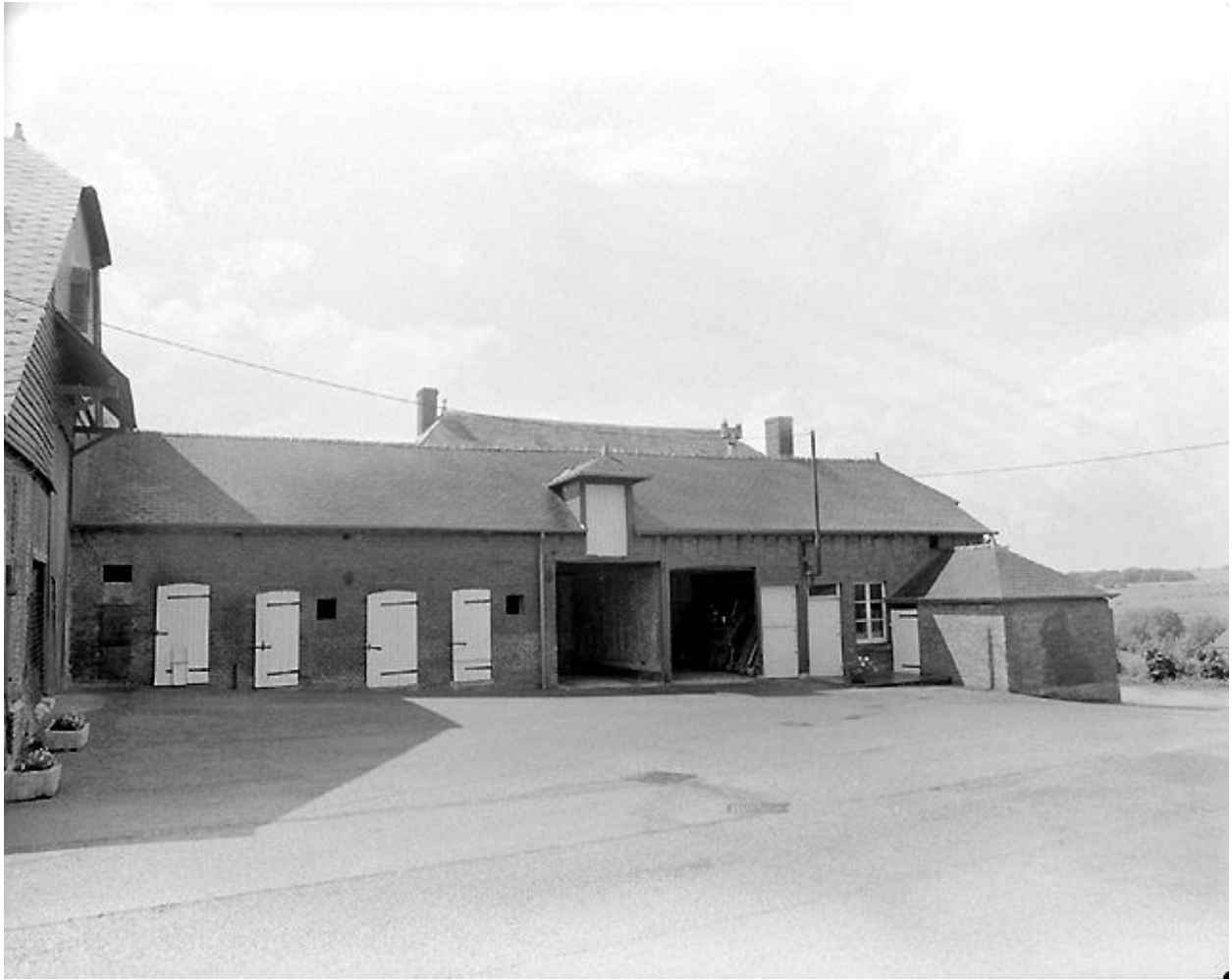
Grange, étable à chevaux et remise agricole.