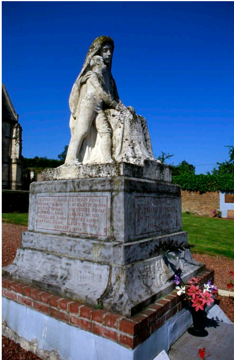
Vue de trois-quarts.