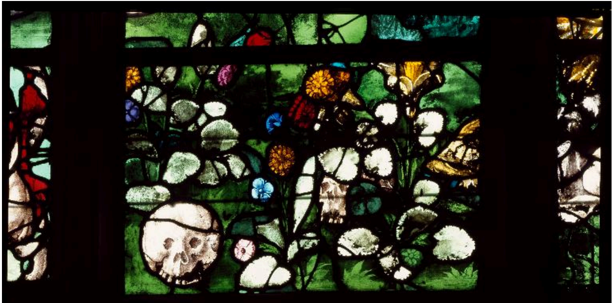
Vue de détail de la lancette centrale : deux crânes parmi les fleurs.