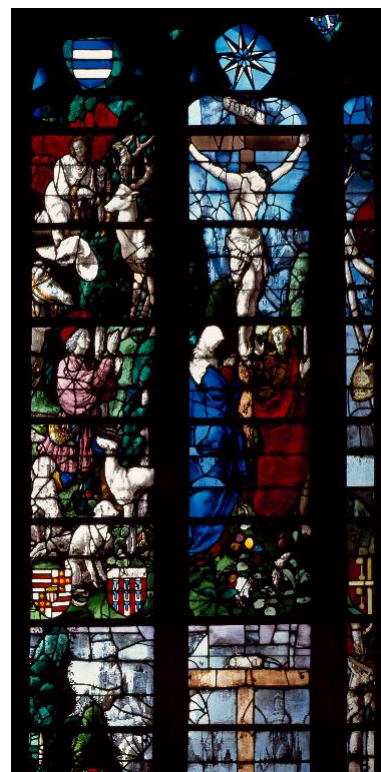
Vue du registre supérieur de la lancette gauche et de la lancette centrale : saint Hubert et le Calvaire. IVR22_19976000464XA