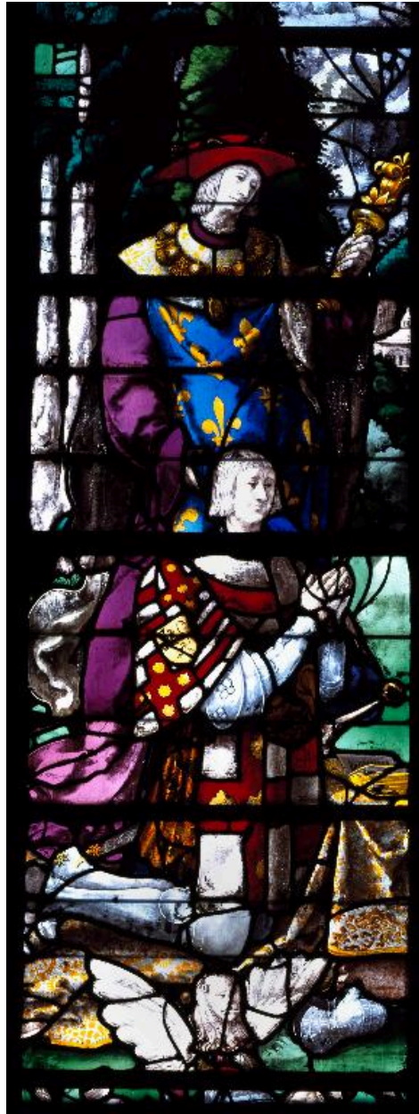
Vue du registre inférieur de la lancette gauche : Louis de Roncherolles présenté par saint Louis.