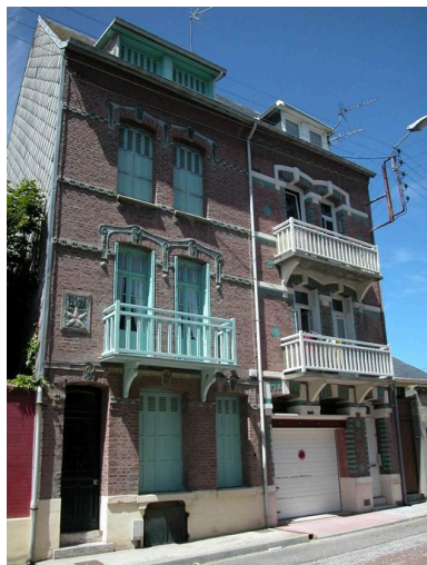
Vue d'ensemble.