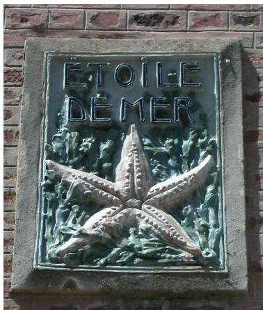
Détail du carreau de grès flammé du numéro 14. IVR22_20038005246NUCA