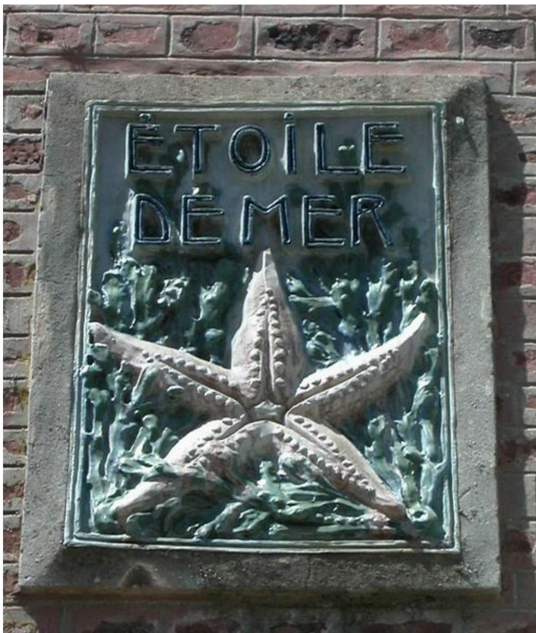
Détail du carreau de grès flammé du numéro 14.