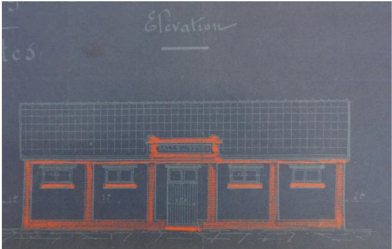
Élévation, plan de 1928 (AD Somme ; 99 O 3882).