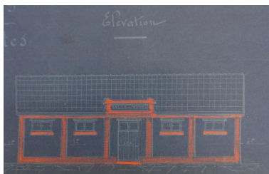
Élévation, plan de 1928 (AD Somme ; 99 O 3882).

IVR22_20158005209NUCA