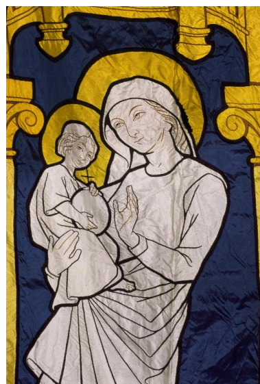
Détail de la Vierge à l'Enfant. IVR22_20030200606ZA