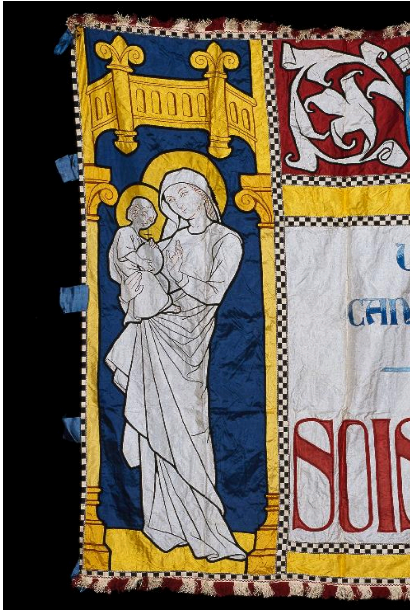
Détail du décor : la Vierge et l'Enfant Jésus sous un dais.