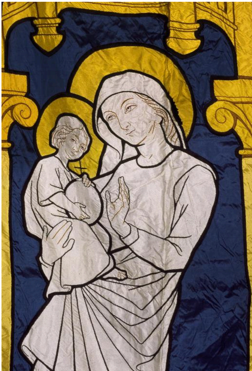
Détail de la Vierge à l'Enfant.