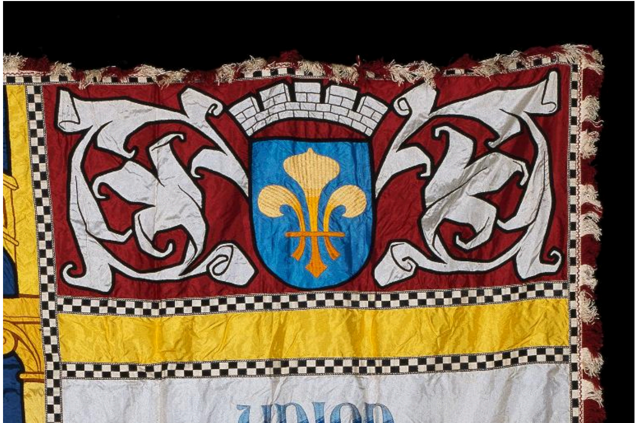
Détail du décor : les armoiries de la ville de Soissons.