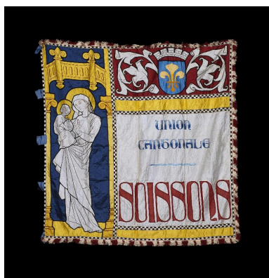
Vue générale. IVR22_20020200533XA