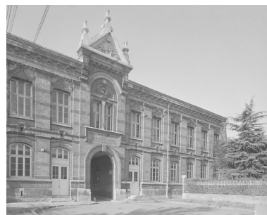
Vue partielle de la façade principale sur la cour d'honneur. IVR22_19978000716V