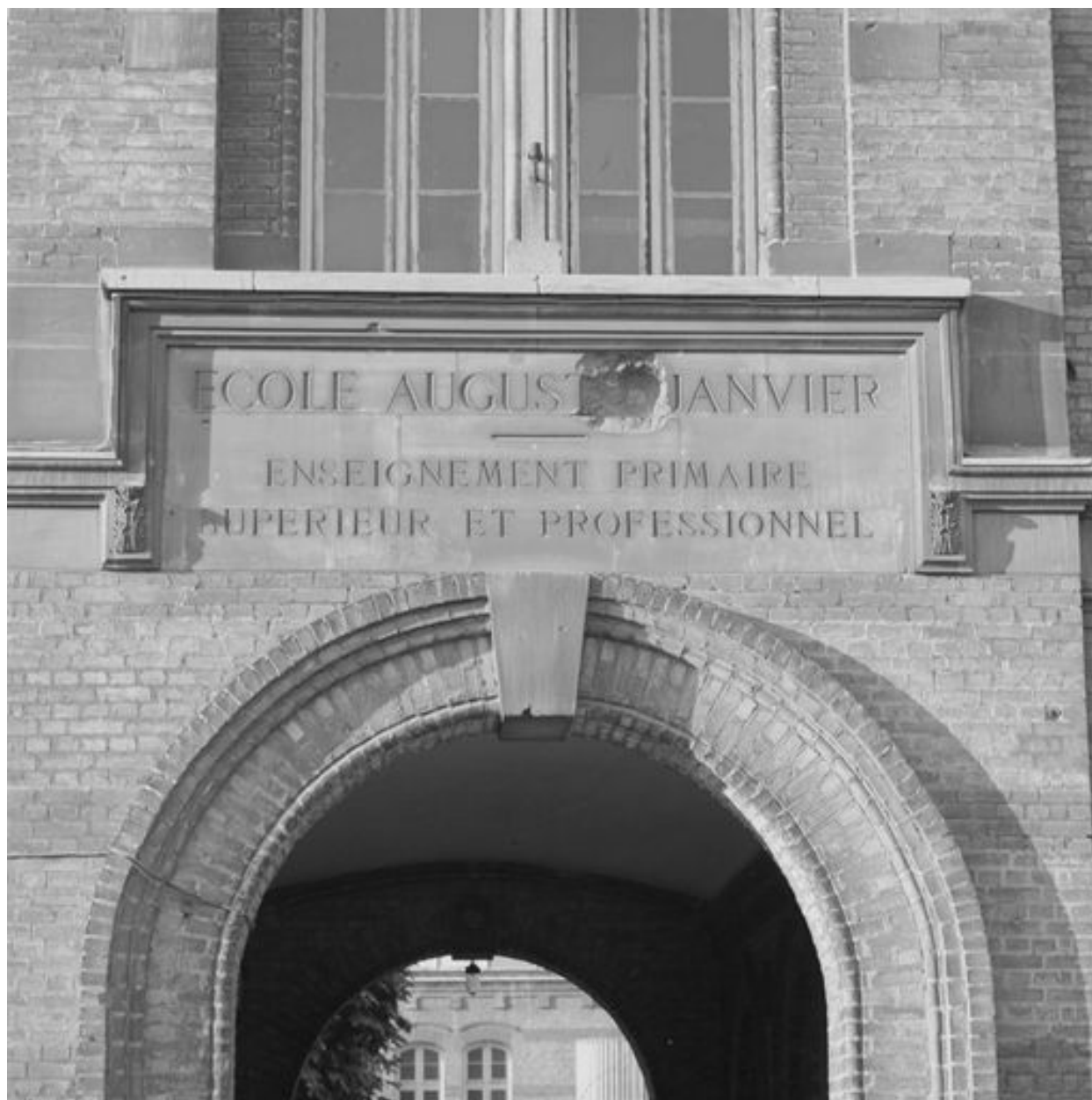
Détail sur l'inscription relative à la dénomination de l'édifice.