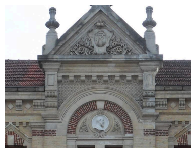
Vue de détail : portrait en médaillon.