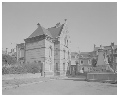
Vue de la cour d'honneur et de la conciergerie.