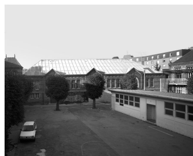
Le gymnase. IVR22_19978000707V