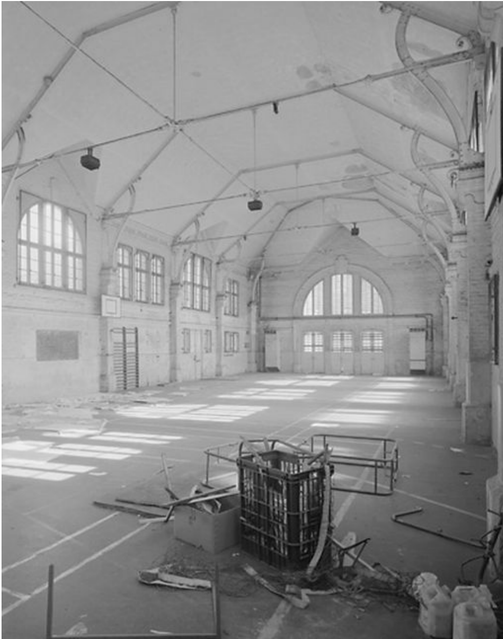
Le gymnase. Vue intérieure.