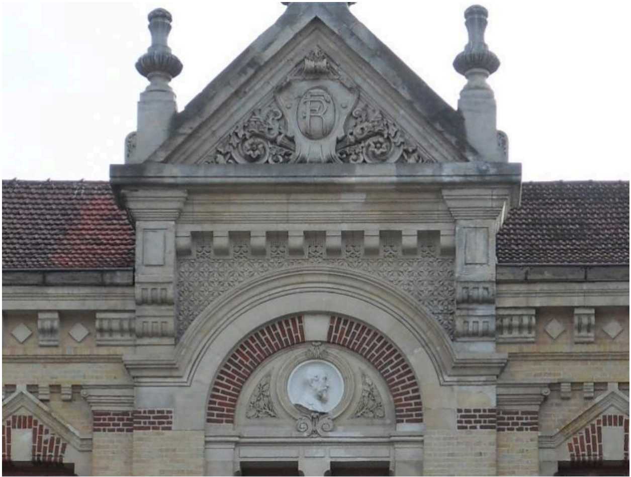
Vue de détail : portrait en médaillon.