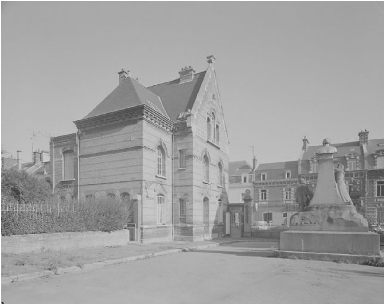
Vue de la cour d'honneur et de la conciergerie.