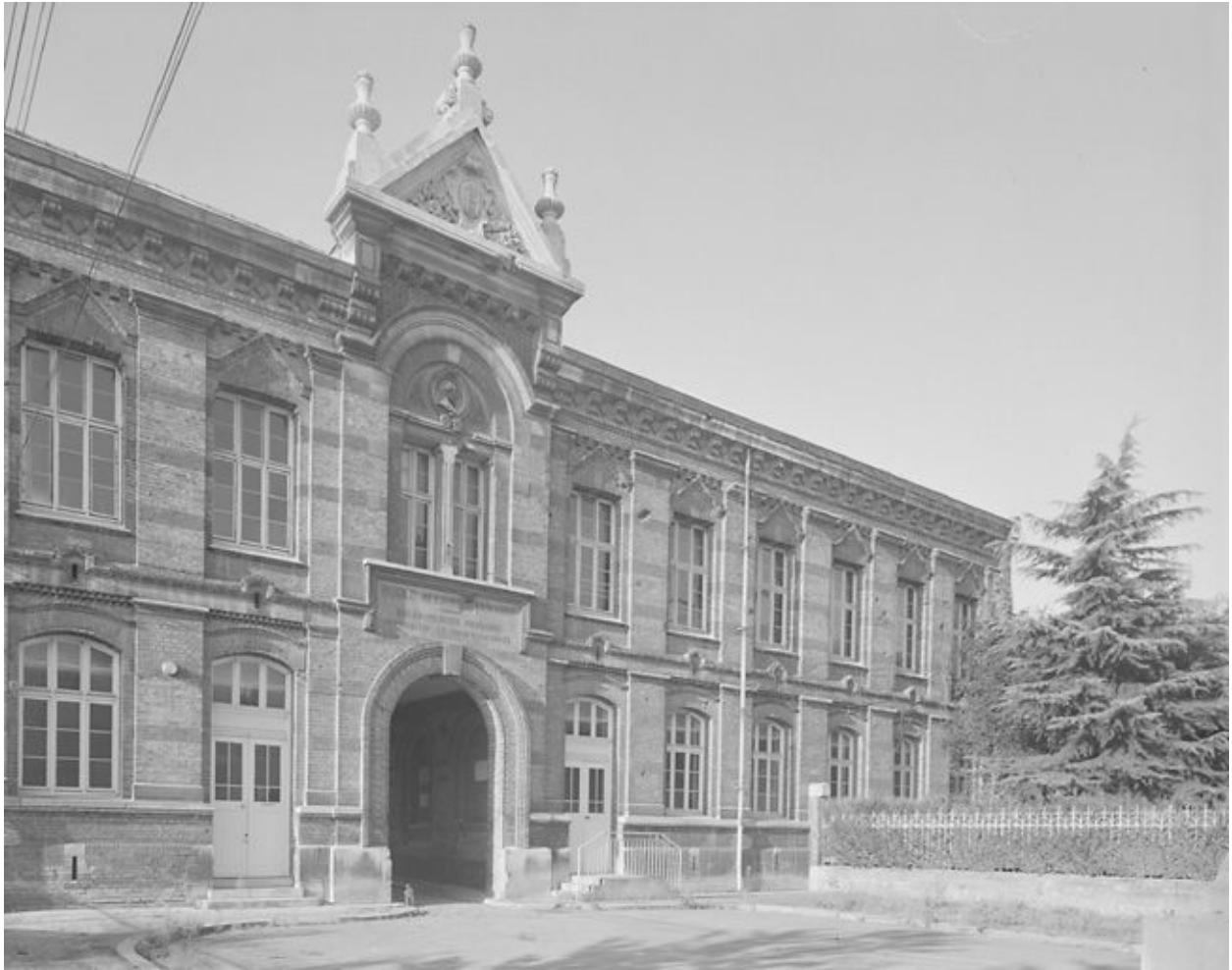
Vue partielle de la façade principale sur la cour d'honneur.