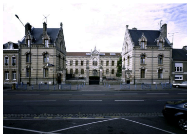
Vue générale. IVR22_20038000391PA