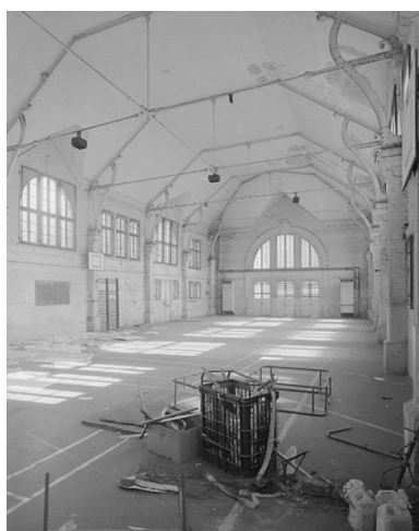
Le gymnase. Vue intérieure. IVR22_19978000711V