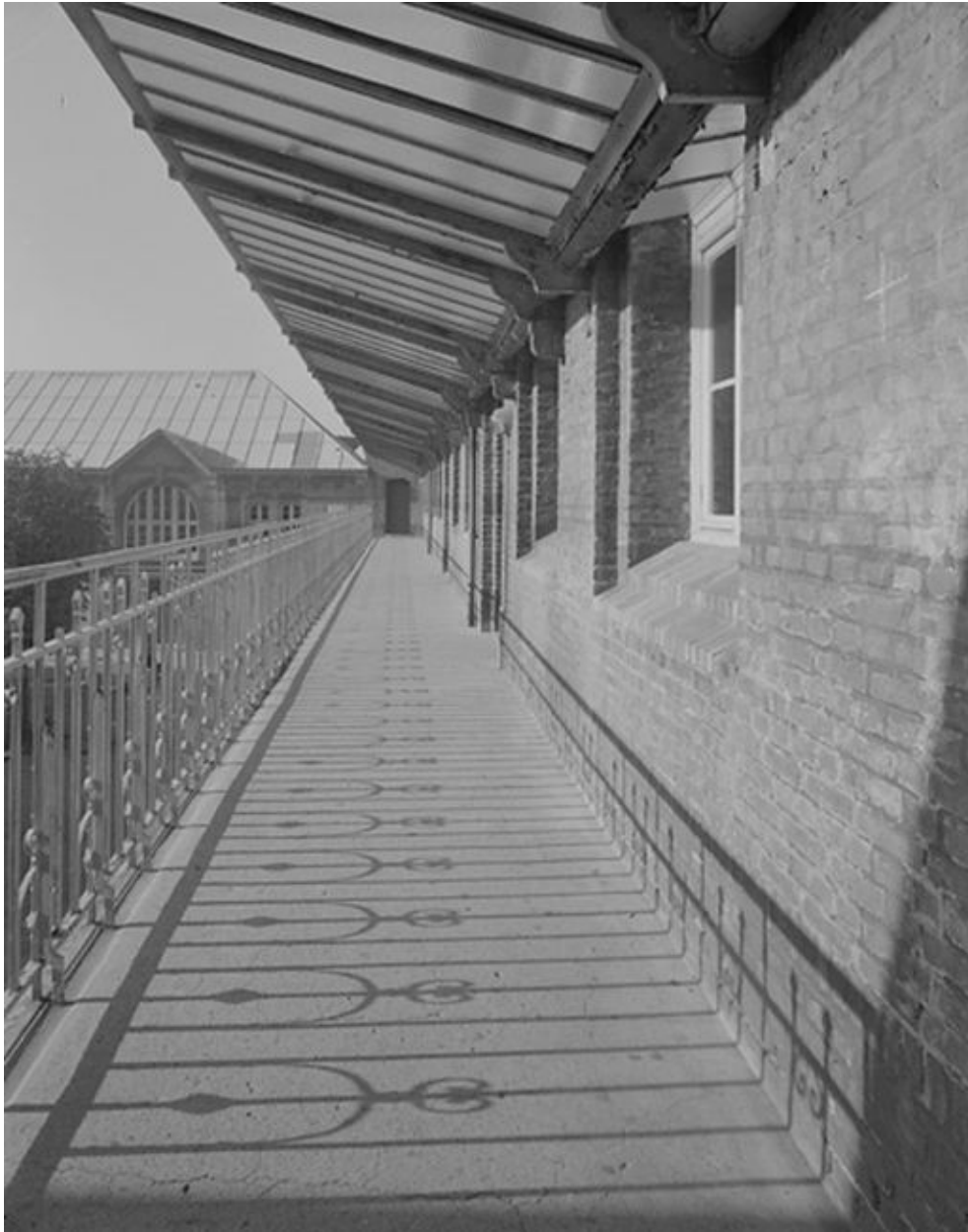
Coursière de distribution de l'étage.