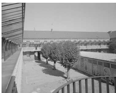
Cour intérieure. IVR22_19978000706V