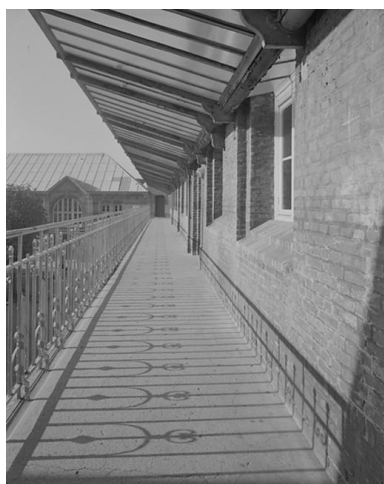
Coursière de distribution de l'étage.