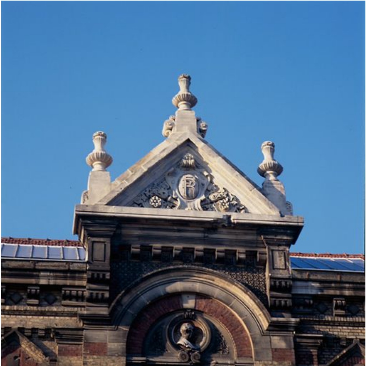
Détail sur le fronton de la façade principale.