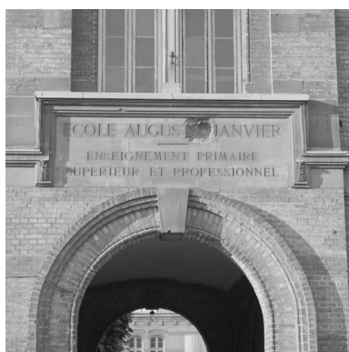
Détail sur l'inscription relative à la dénomination de l'édifice. IVR22_19978000721X