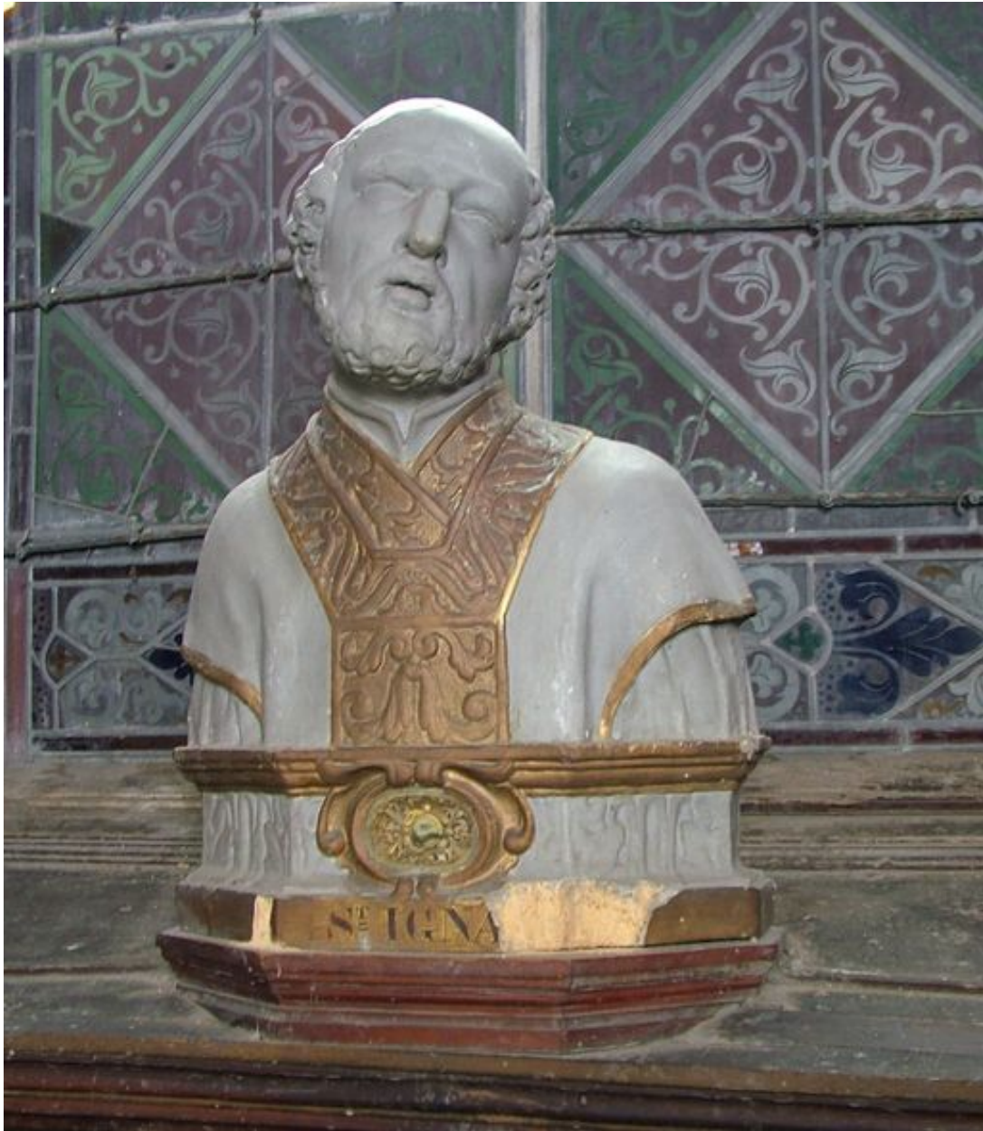
Buste reliquaire de saint Ignace de Loyola.