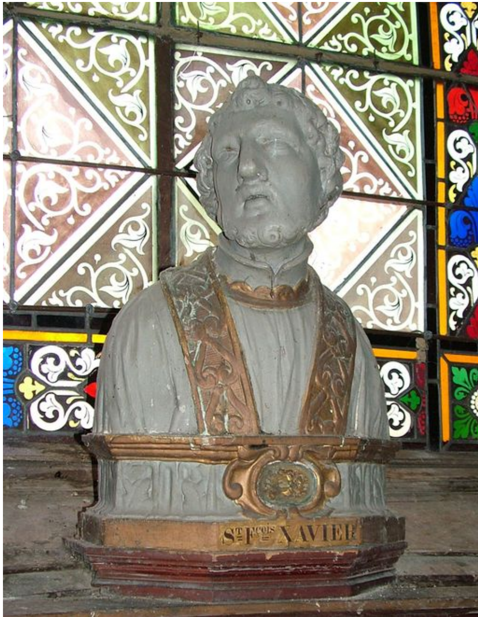
Buste-reliquaire de saint François Xavier.