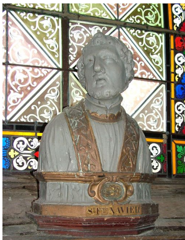
Buste-reliquaire de saint François Xavier.