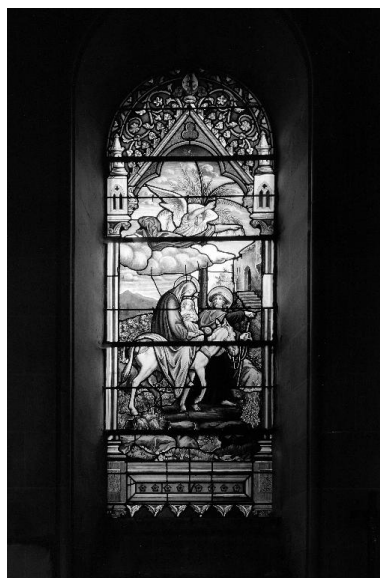
Verrière (baie 4) : Fuite en Egypte.