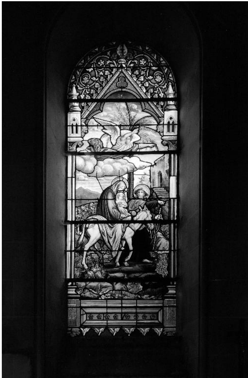
Verrière (baie 4) : Fuite en Egypte.