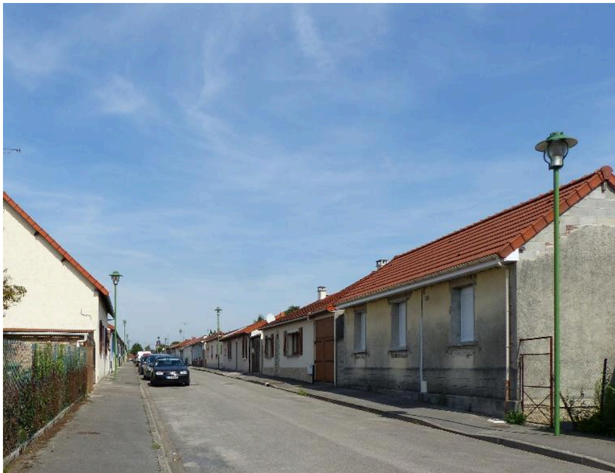
Rue de Belgique, vue depuis le sud.