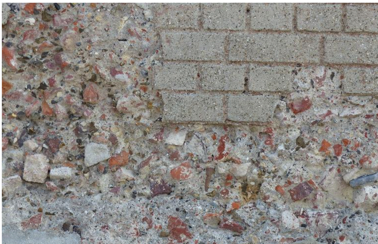
Maison, rue d'Angleterre. Détail de la mise en oeuvre.