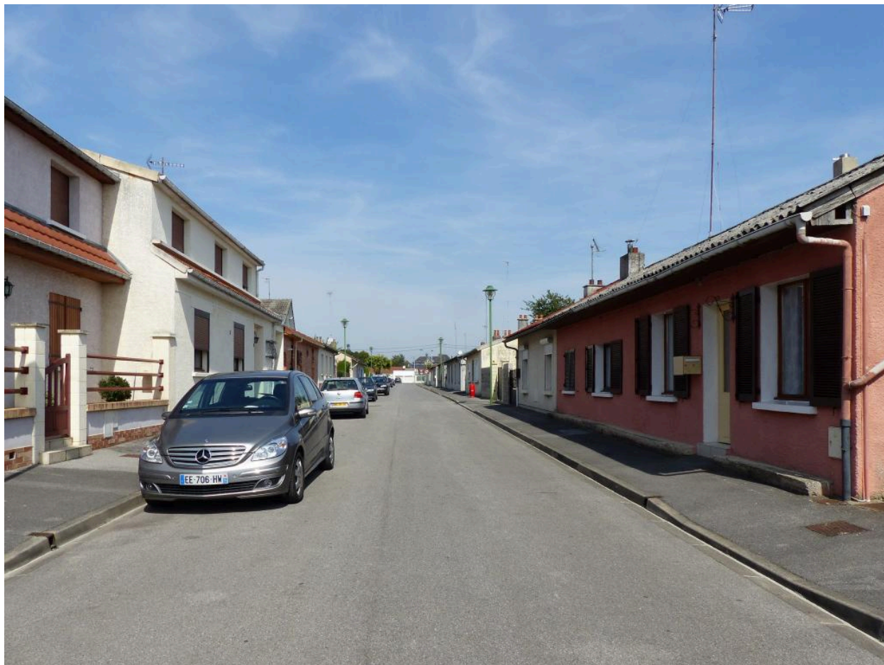
La rue d'Angleterre, vue depuis le sud.