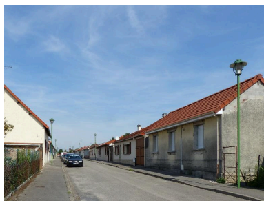
Rue de Belgique, vue depuis le sud. IVR32_20170205286NUCA