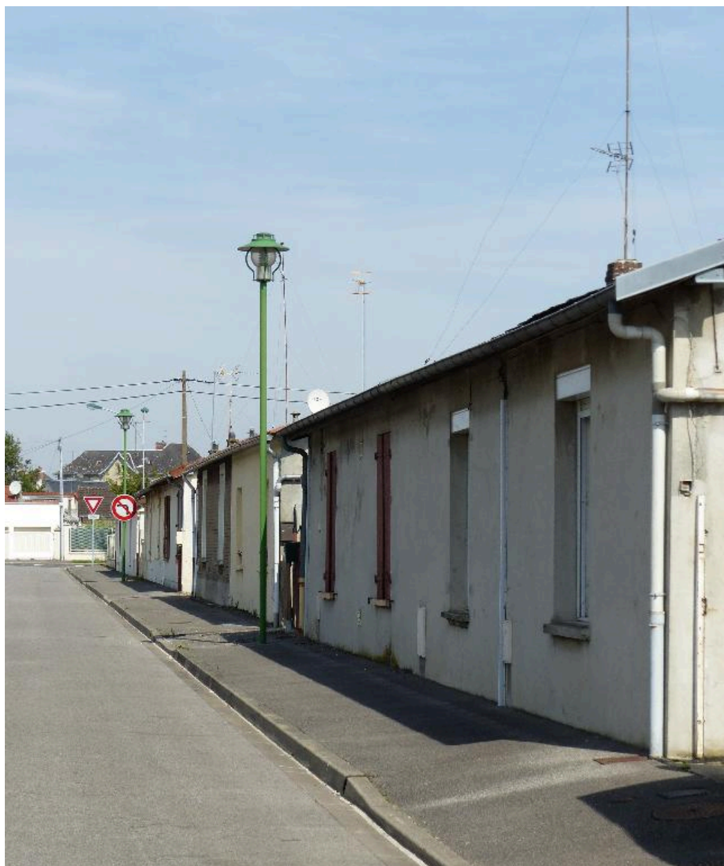
Maisons, rue d'Angleterre.