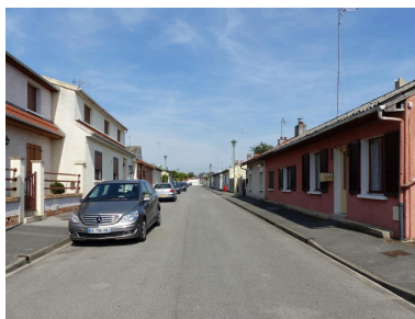
La rue d'Angleterre, vue depuis le sud.