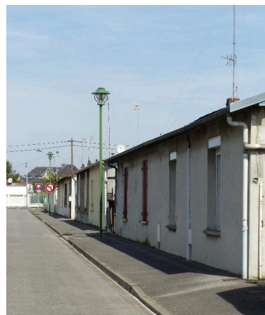
Maisons, rue d'Angleterre. IVR32_20170205287NUCA