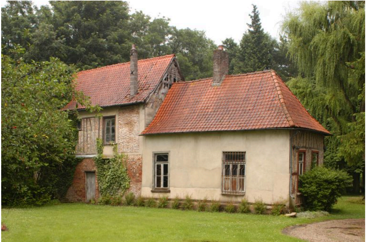
Ancien manoir (?) du fief des moulins.