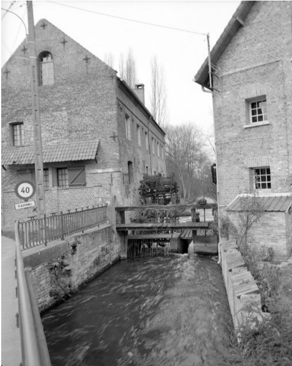
Atelier de fabrication, roue hydraulique verticale, vanne.