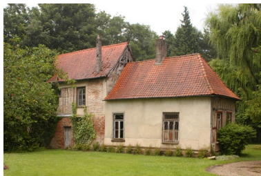
Ancien manoir (?) du fief des moulins.