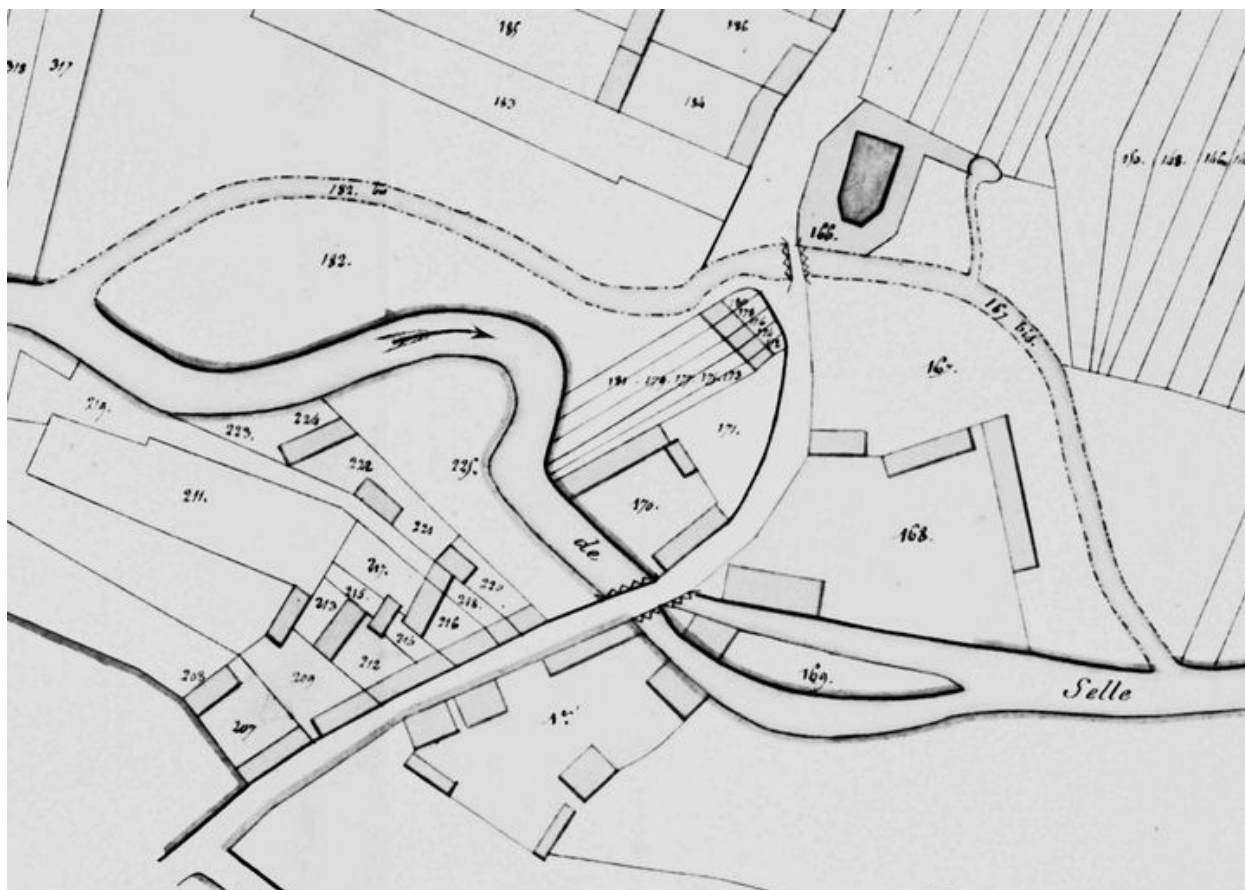
Extrait du cadastre napoléonien (AD Somme ; 3P 1240).