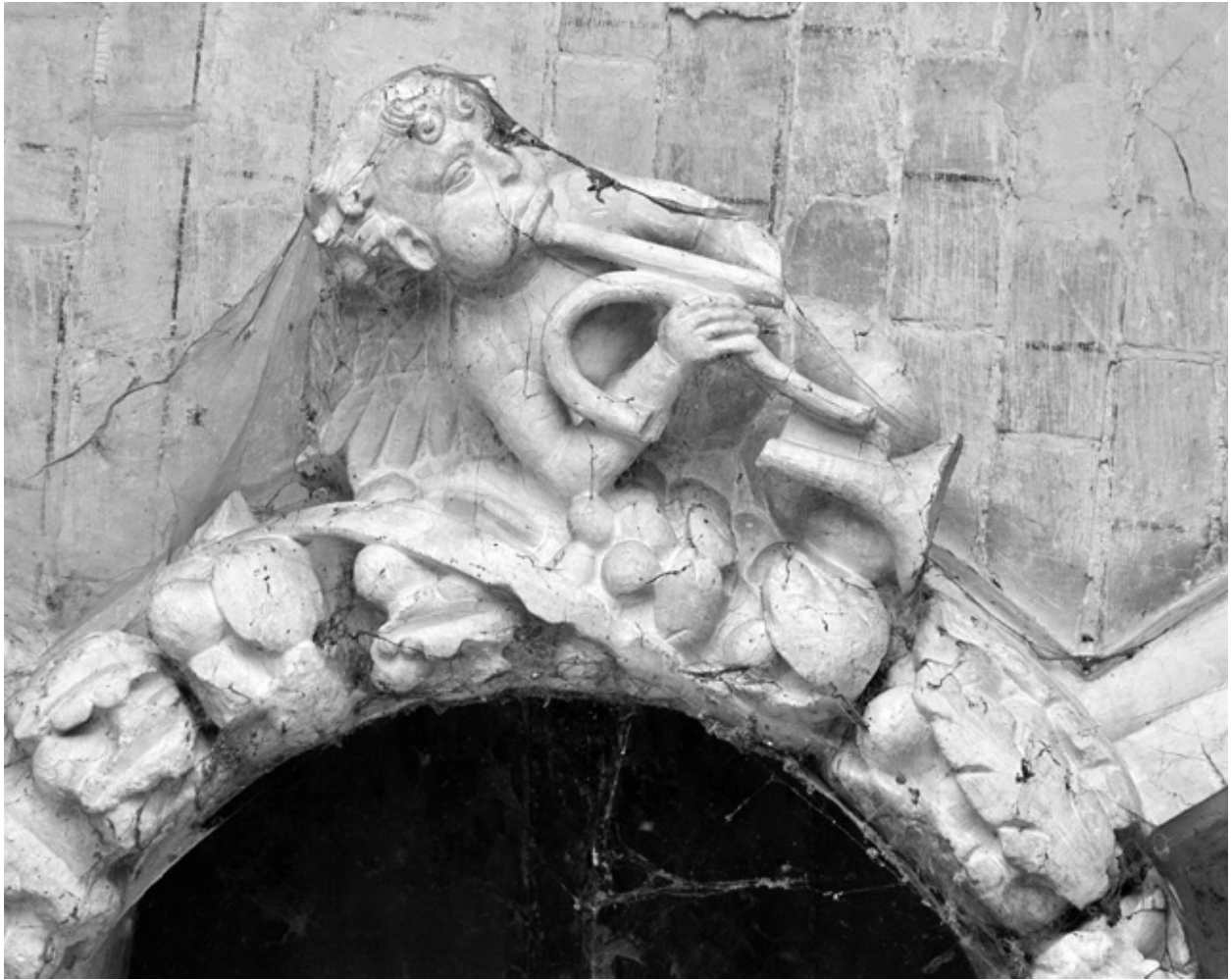
Ange jouant de la trompette.