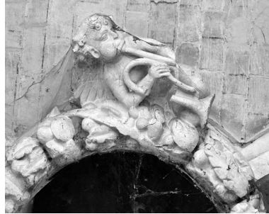
Ange jouant de la trompette.

IVR22_19940201008X