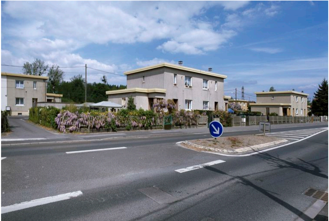
Vue de trois maisons de la cité jardin.