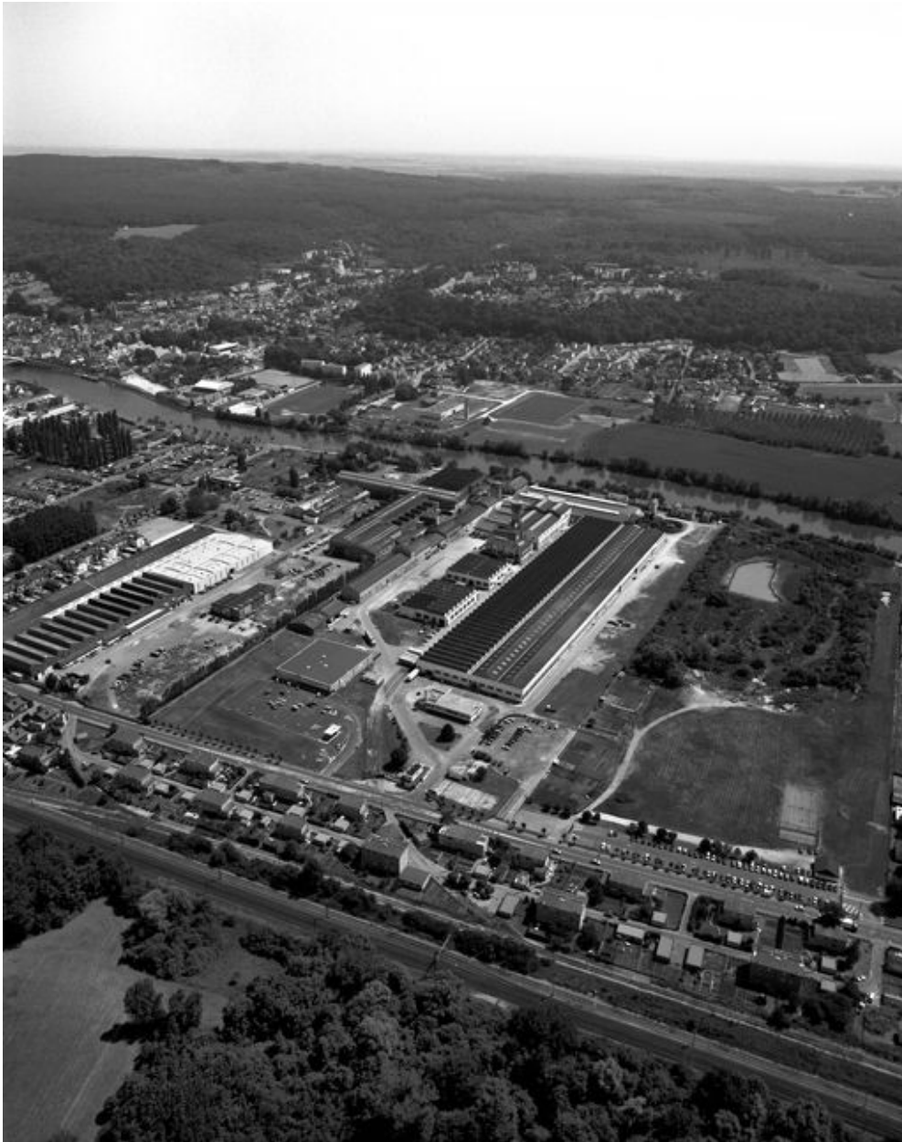
Jardin entourant les maisons de la cité-jardin.