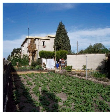
Jardin entourant les maisons de la cité-jardin. IVR22_20106000351XA