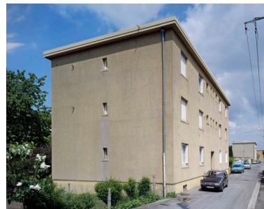
Immeuble à six unités d'habitation.