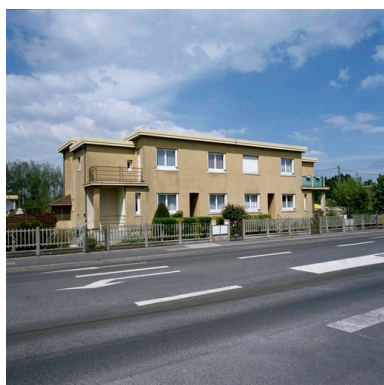
Maison à quatre unités d'habitation.