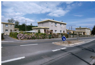
Vue de trois maisons de la cité jardin. IVR22_20106000357NUCA