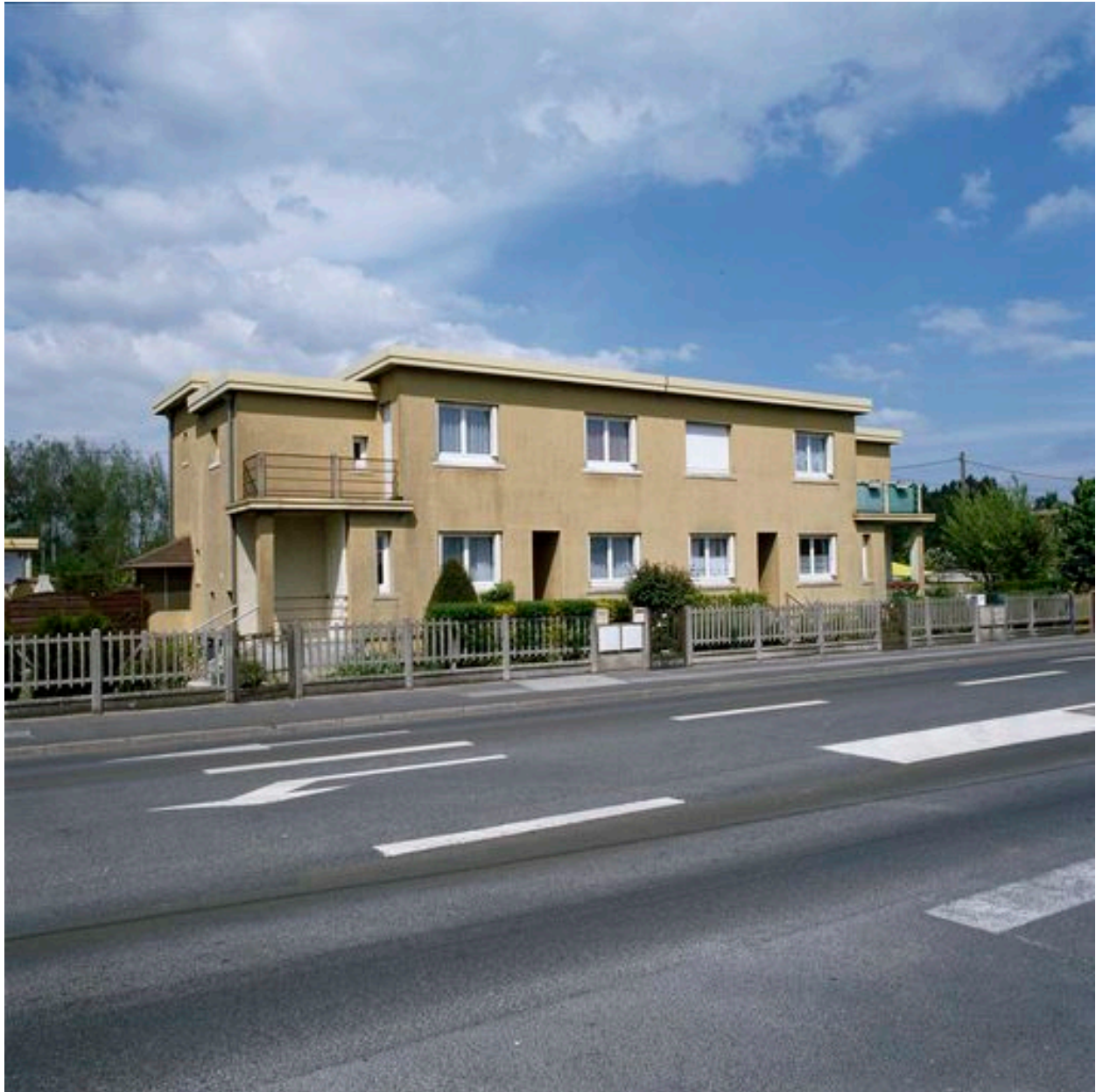
Maison à quatre unités d'habitation.