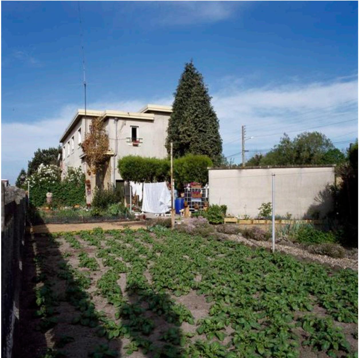
Jardin entourant les maisons de la cité-jardin.