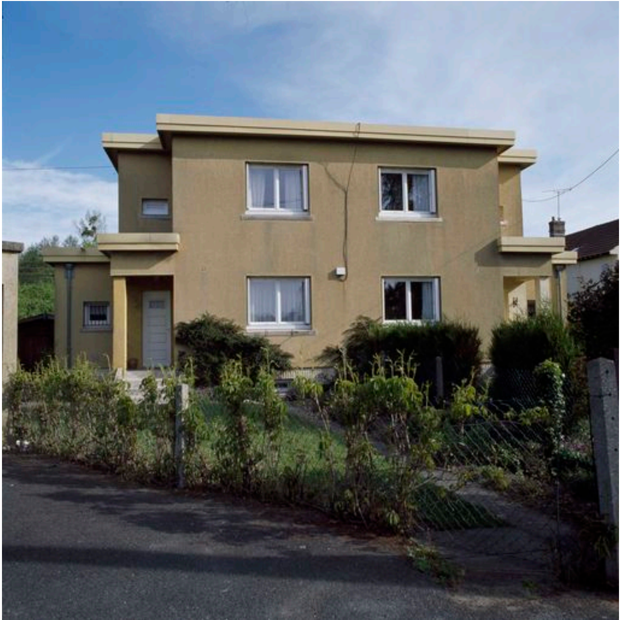
Maison à deux unités d'habitation.