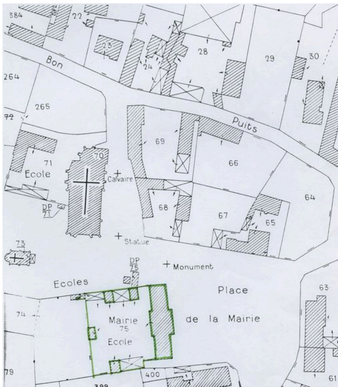
Plan de situation. Extrait du plan cadastral de 1982, section AD 75.