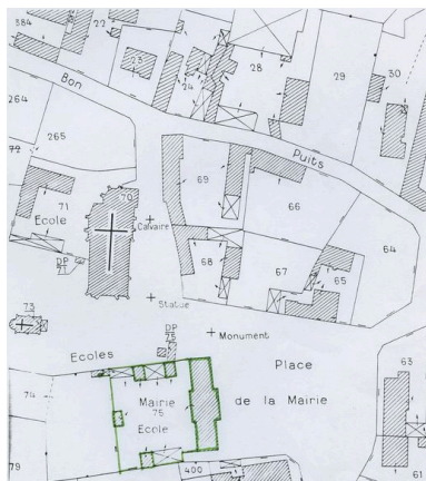
Plan de situation. Extrait du plan cadastral de 1982, section AD 75. IVR22_20096000201NUCA