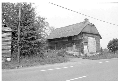
Vue générale. IVR22_19980203017Z