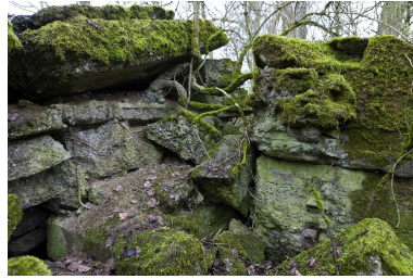
Elévation nord-est IVR31_20145904420NUCA