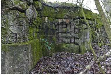
Elévation nord-est IVR31_20145904418NUCA