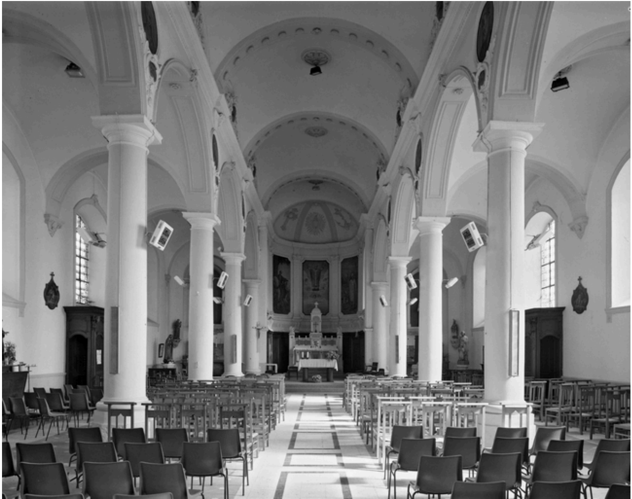
Vue générale intérieure, vers le choeur.