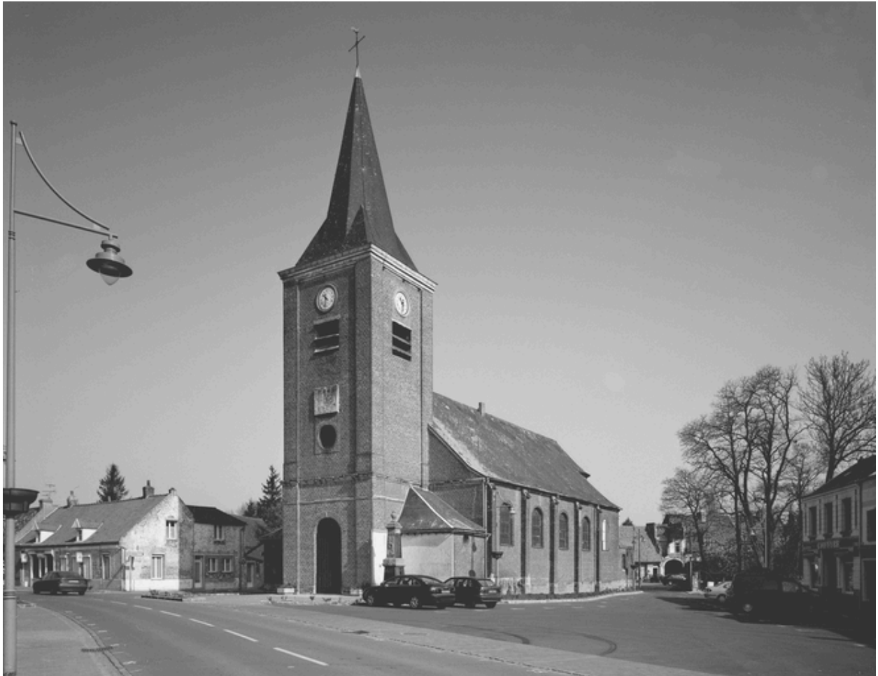
Vue générale extérieure, depuis la rue.