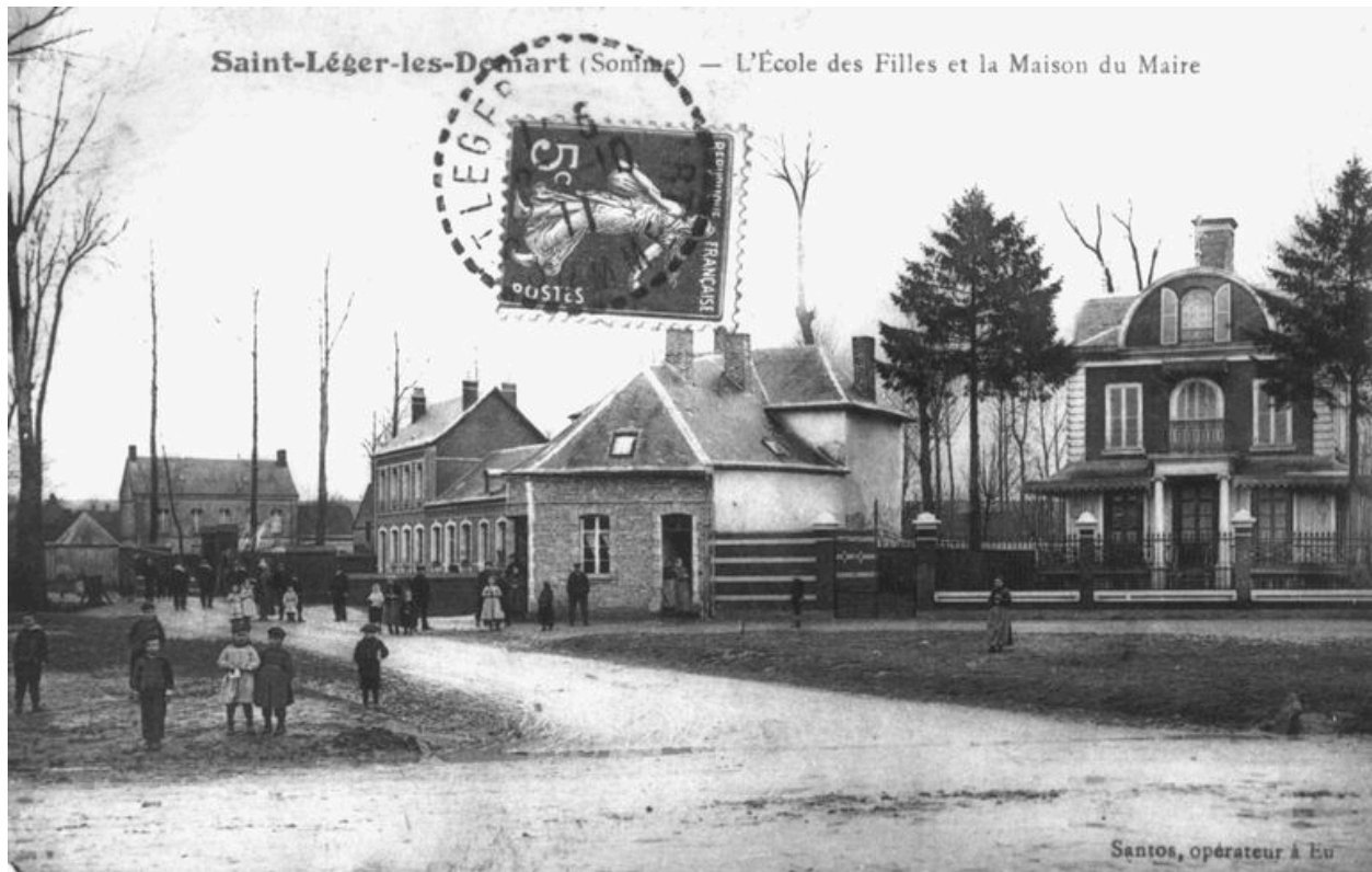
Vue générale depuis la place publique, vers 1910 (coll. part).