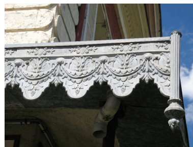
Détail du décor de la courbe.