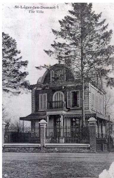
Vue d'ensemble, vers 1910 (coll. part.). IVR22_20088015053NUCA