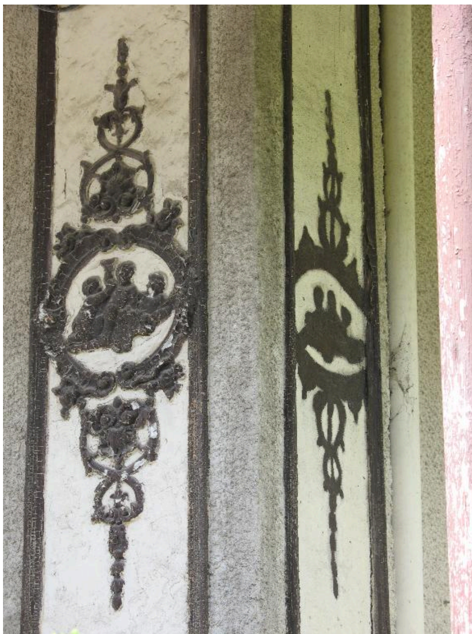
Décor des pilastres de la façade.