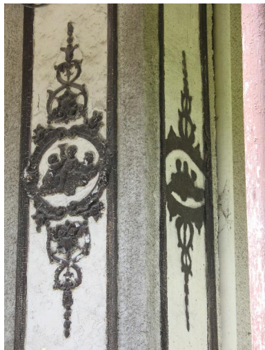
Décor des pilastres de la façade. IVR22_20088015516NUCA

IVR22_20088015515NUCA