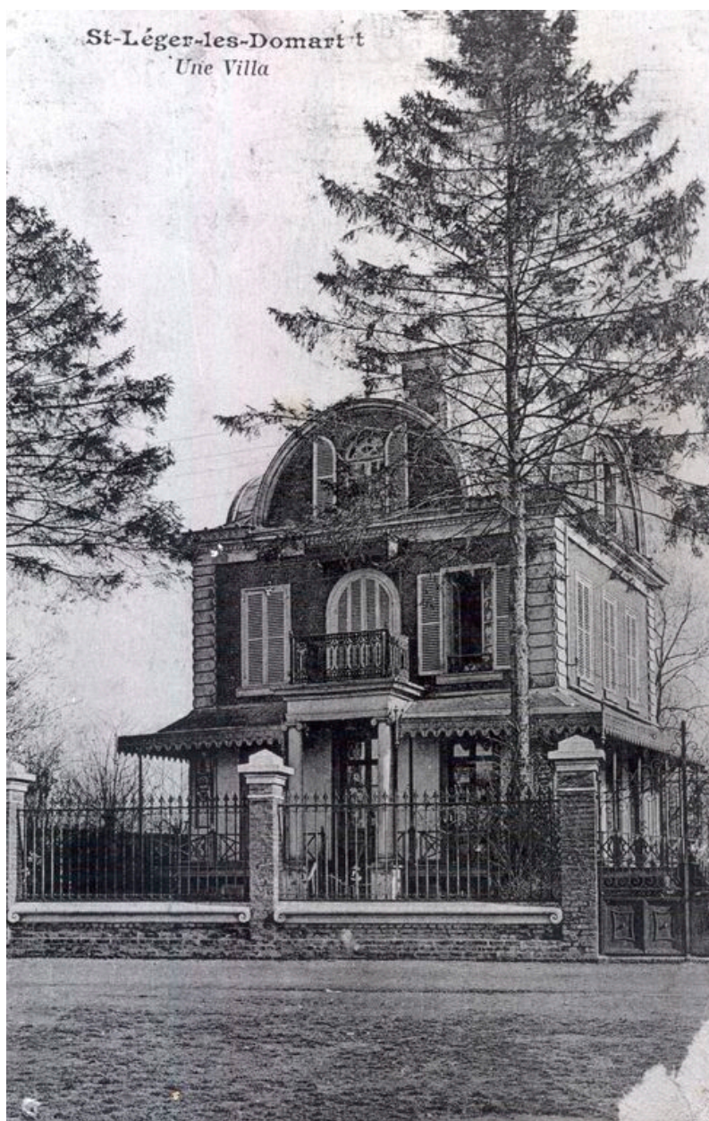
Vue d'ensemble, vers 1910.