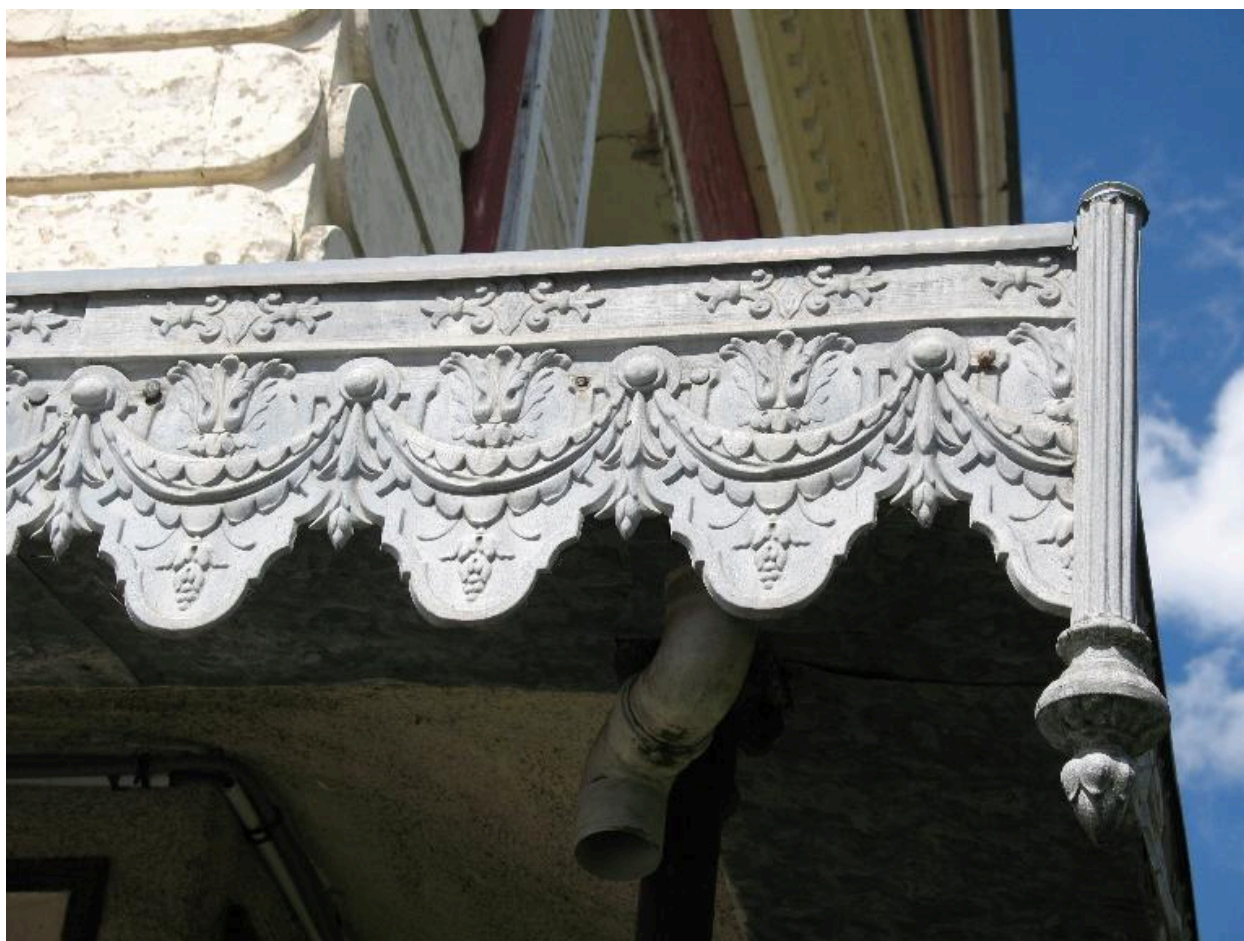
Détail du décor de la coursive.