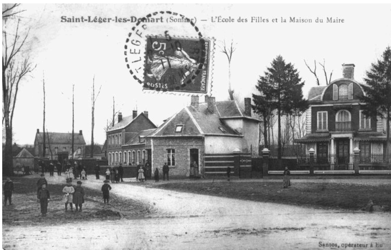
Vue générale depuis la place publique, vers 1910.