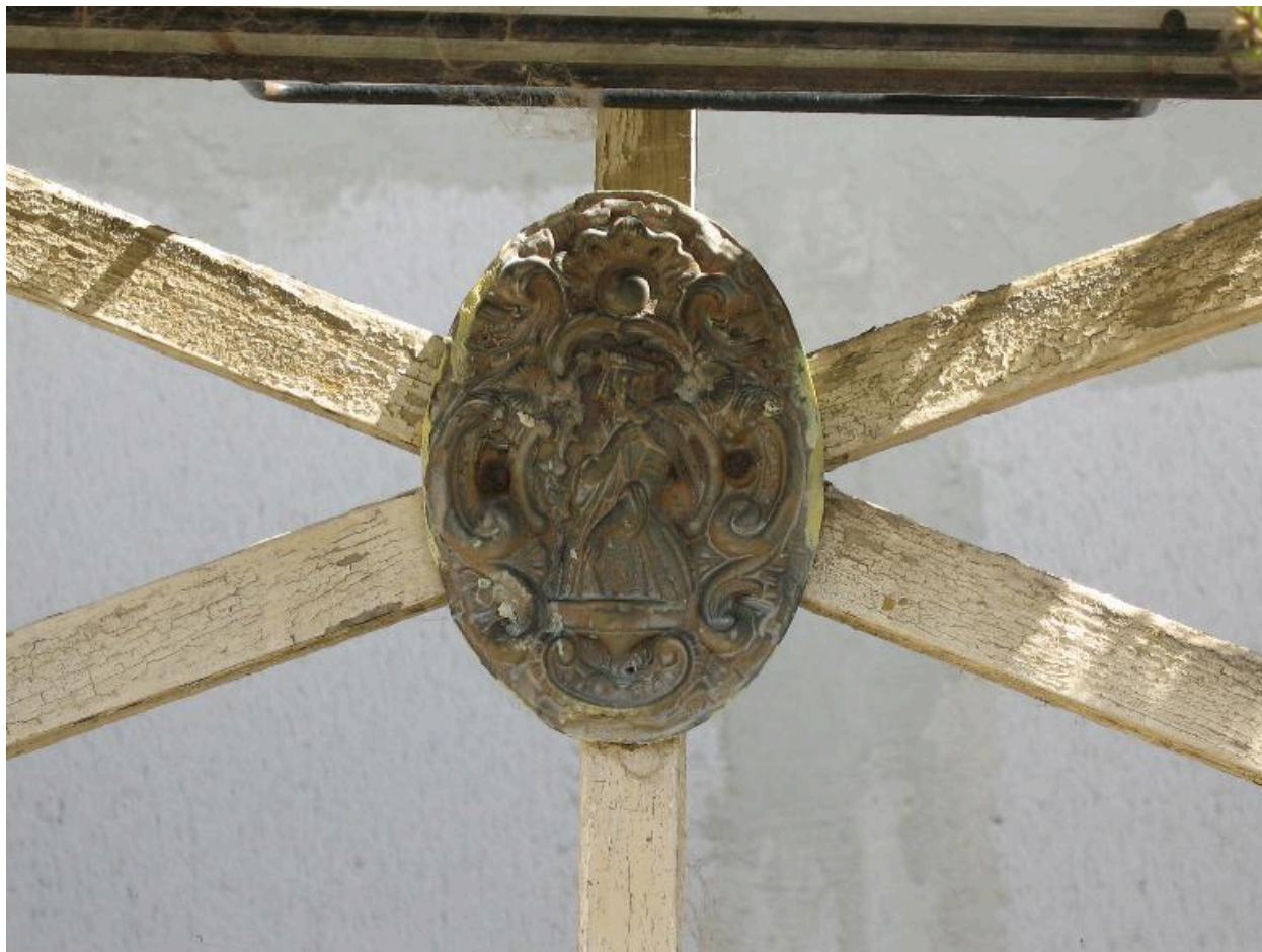
Médallions du garde-corps de la coursive.