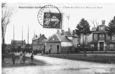
Vue générale depuis la place publique, vers 1910 (coll. part.).