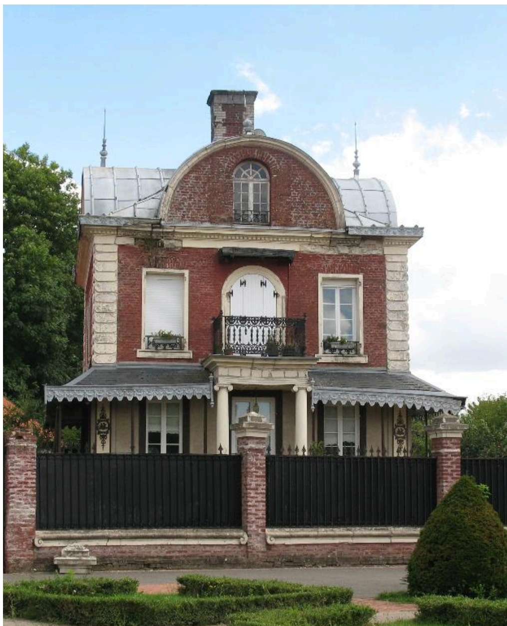
Vue générale, depuis le sud.