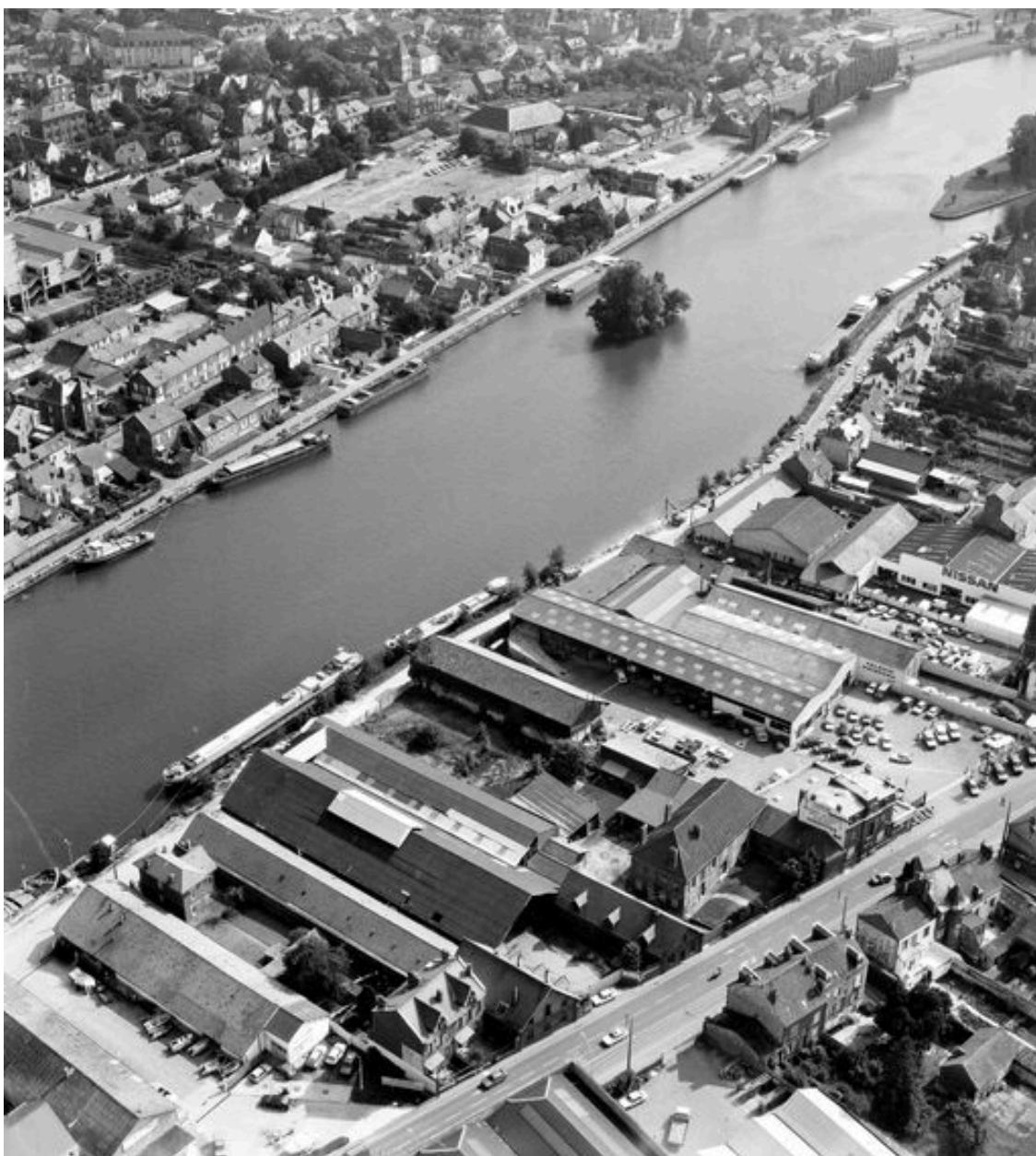
Vue aérienne, en 1991.