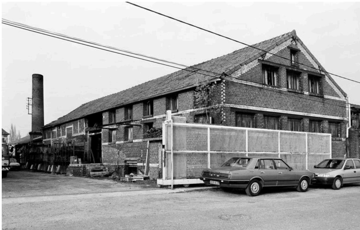
Atelier de fabrication, flanc est.