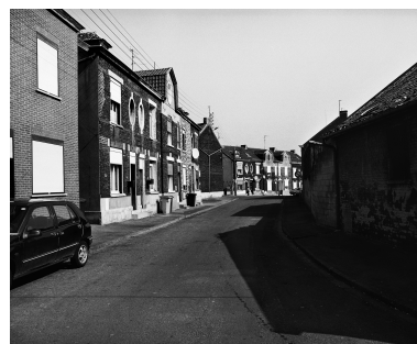
Vue générale de la cité. IVR31_20025901207X