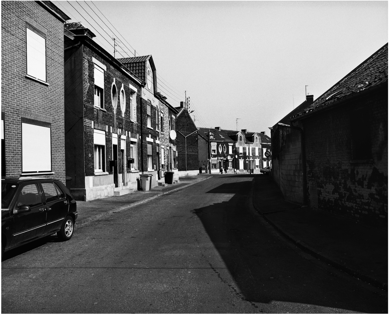
Vue générale de la cité.