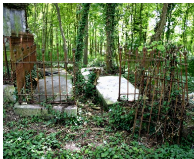
Vue générale. IVR22_20078001016NUCA