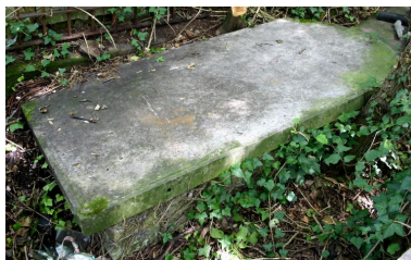
Dalle funéraire (antérieure gauche), vers 1833. IVR22_20078001017NUCA