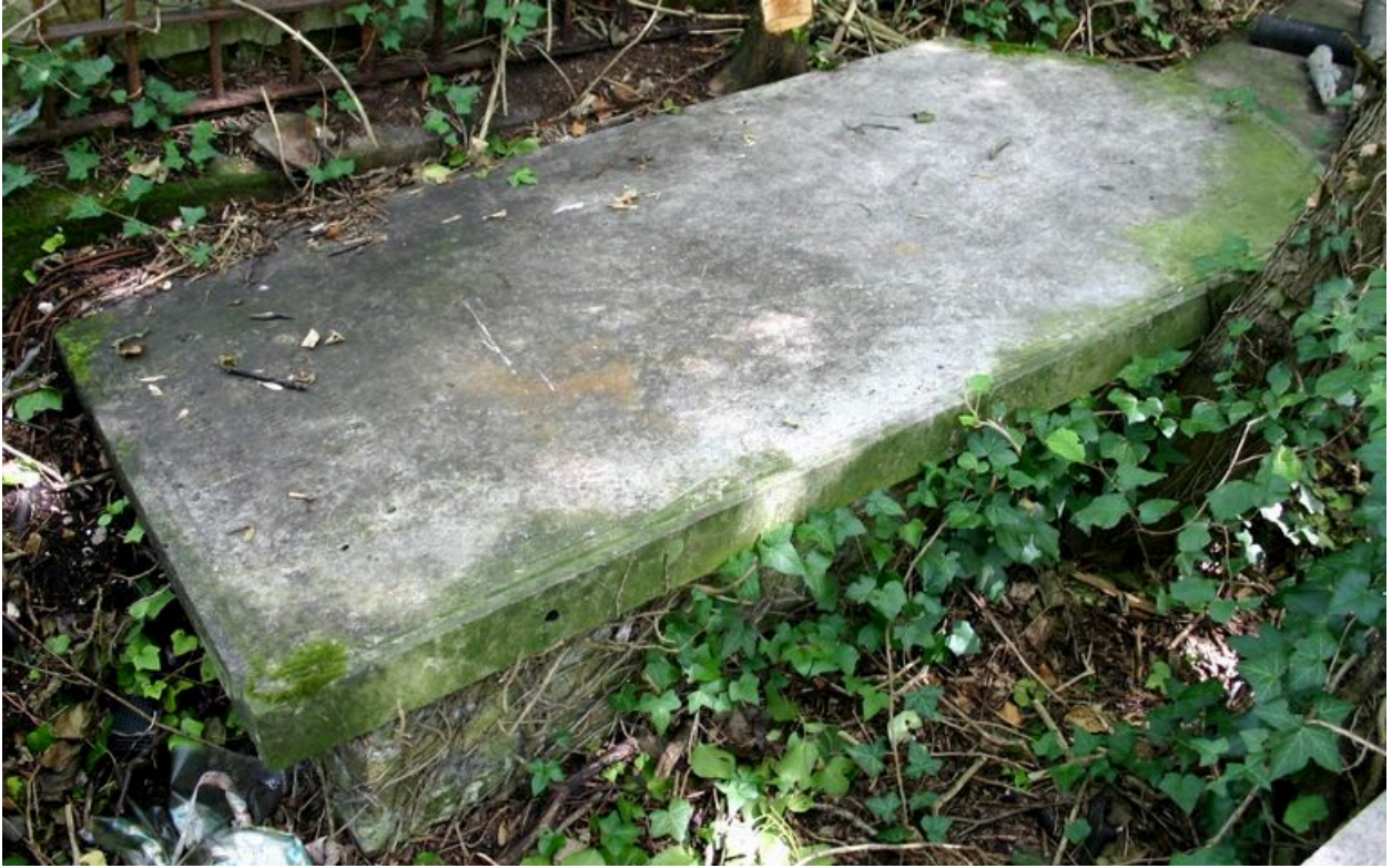
Dalle funéraire (antérieure gauche), vers 1833.