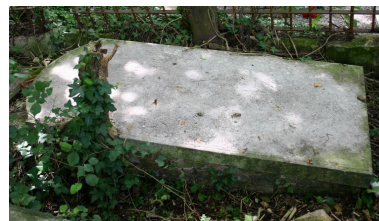
Dalle funéraire (antérieure droite), vers 1833.