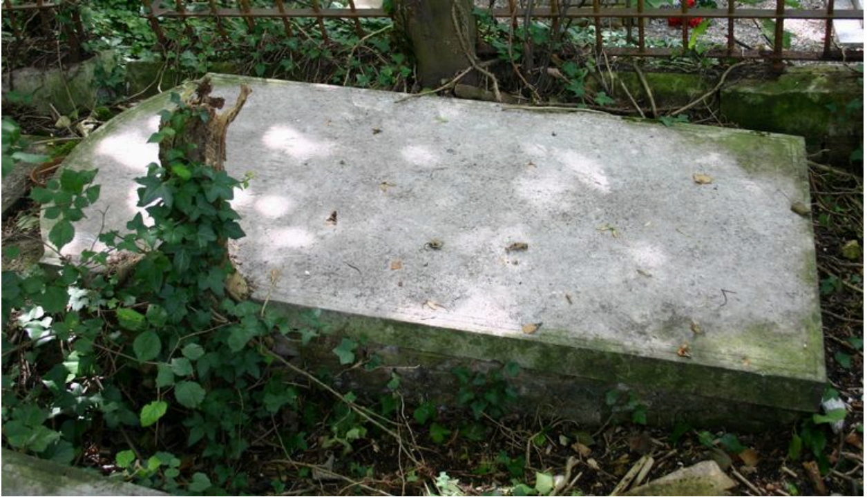
Dalle funéraire (antérieure droite), vers 1833.