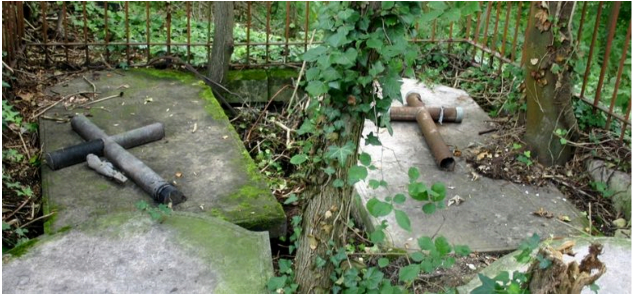
Dalles funéraires (postérieures), vers 1838 et 1866.