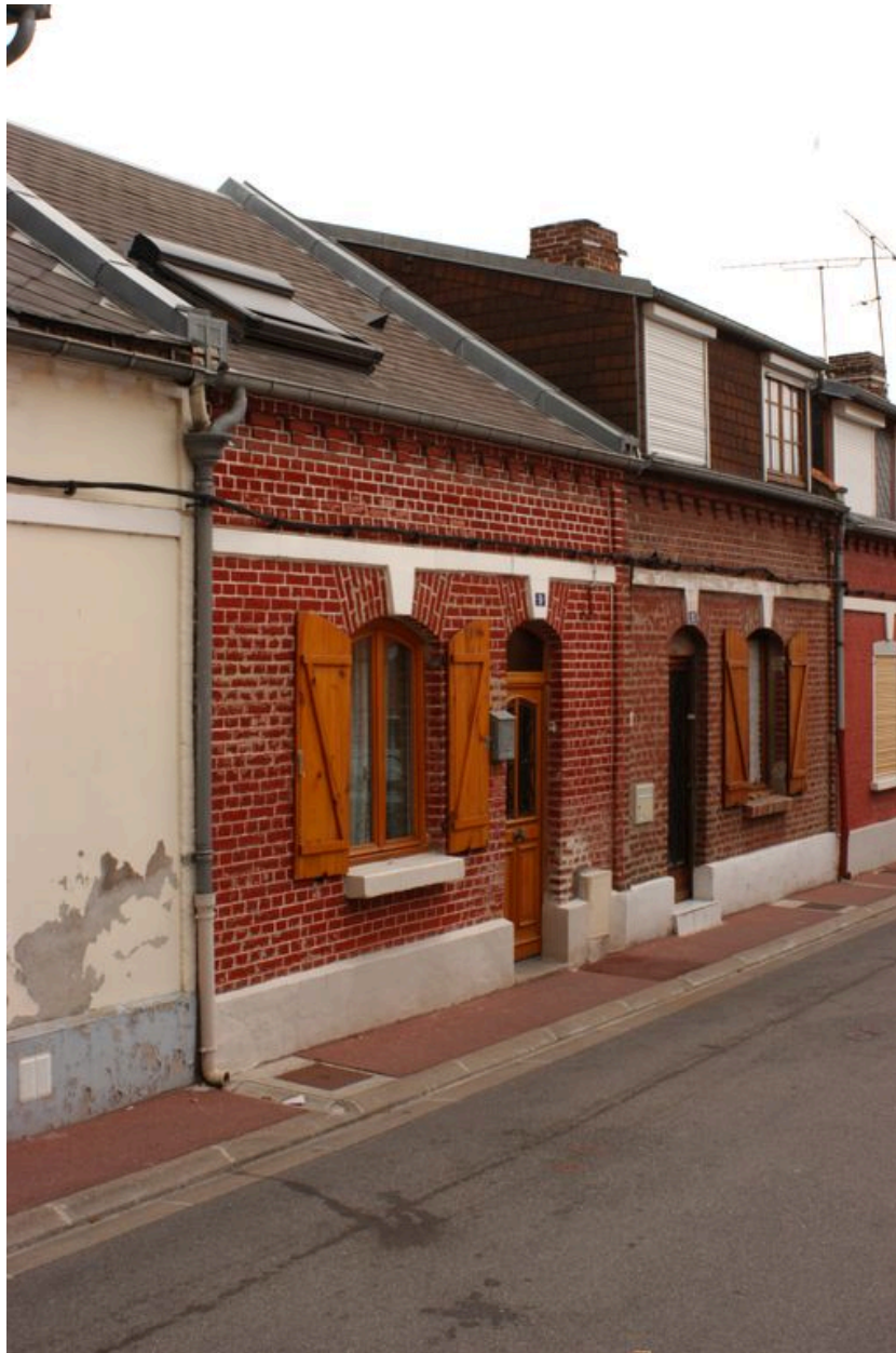
Maisons, 9 et 11 rue Saint-Maurice.