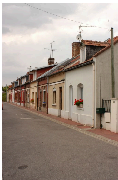
Vue générale, depuis le sud-est. IVR22_20038000705NUCA