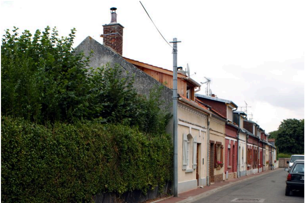
Vue générale depuis le sud-ouest.