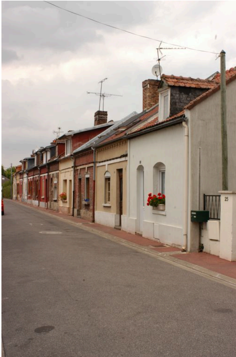
Vue générale, depuis le sud-est.