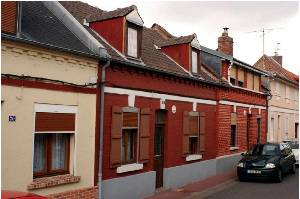
Maisons, 18 et 16 rue Saint-Maurice.