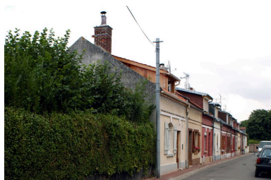
Vue générale depuis le sud-ouest. IVR22_20038000711NUCA