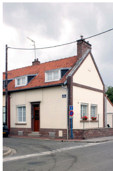
2 rue Saint-Maurice. Vue partielle d'une maison construite en 1858. IVR22_20038000709NUCA