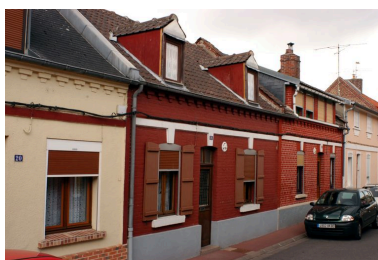
Maisons, 18 et 16 rue Saint-Maurice. IVR22_20038000707NUCA