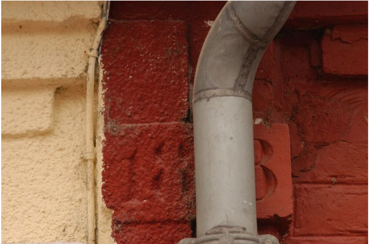
Maison, 14 rue Saint-Maurice, détail sur la date portée : 1883.