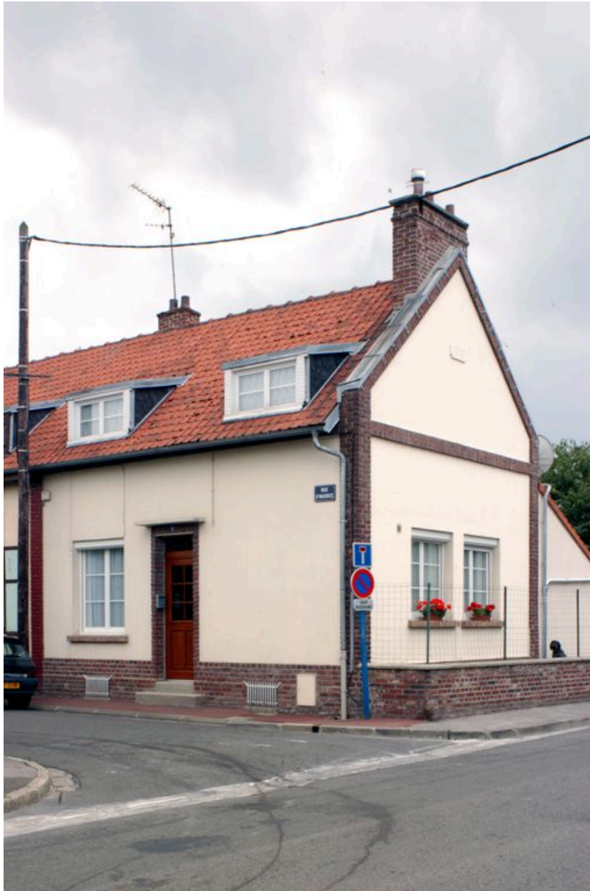
2 rue Saint-Maurice. Vue partielle d'une maison construite en 1858.