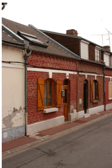
Maisons, 9 et 11 rue Saint-Maurice.