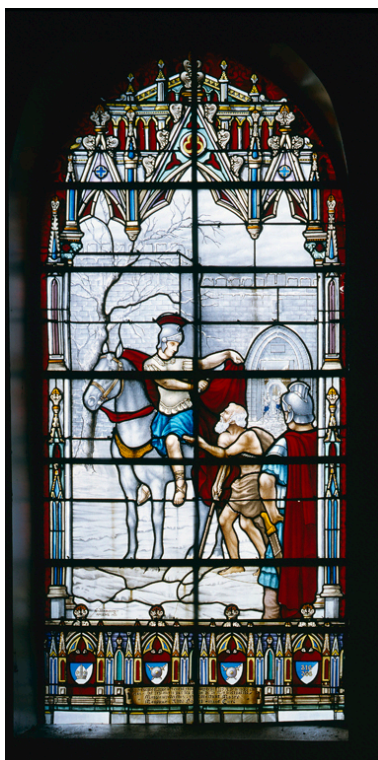
La charité de saint Martin, par Georges Tembouret, Amiens, 1923.

IVR22_19910202072XA