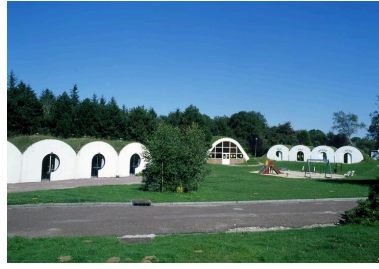
Camping municipal de Mers-les-Bains.

IVR22_20038001137XAB