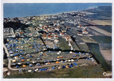
Camping au Crotoy, 2e moitié 20e siècle.

IVR22_20038001137XAB