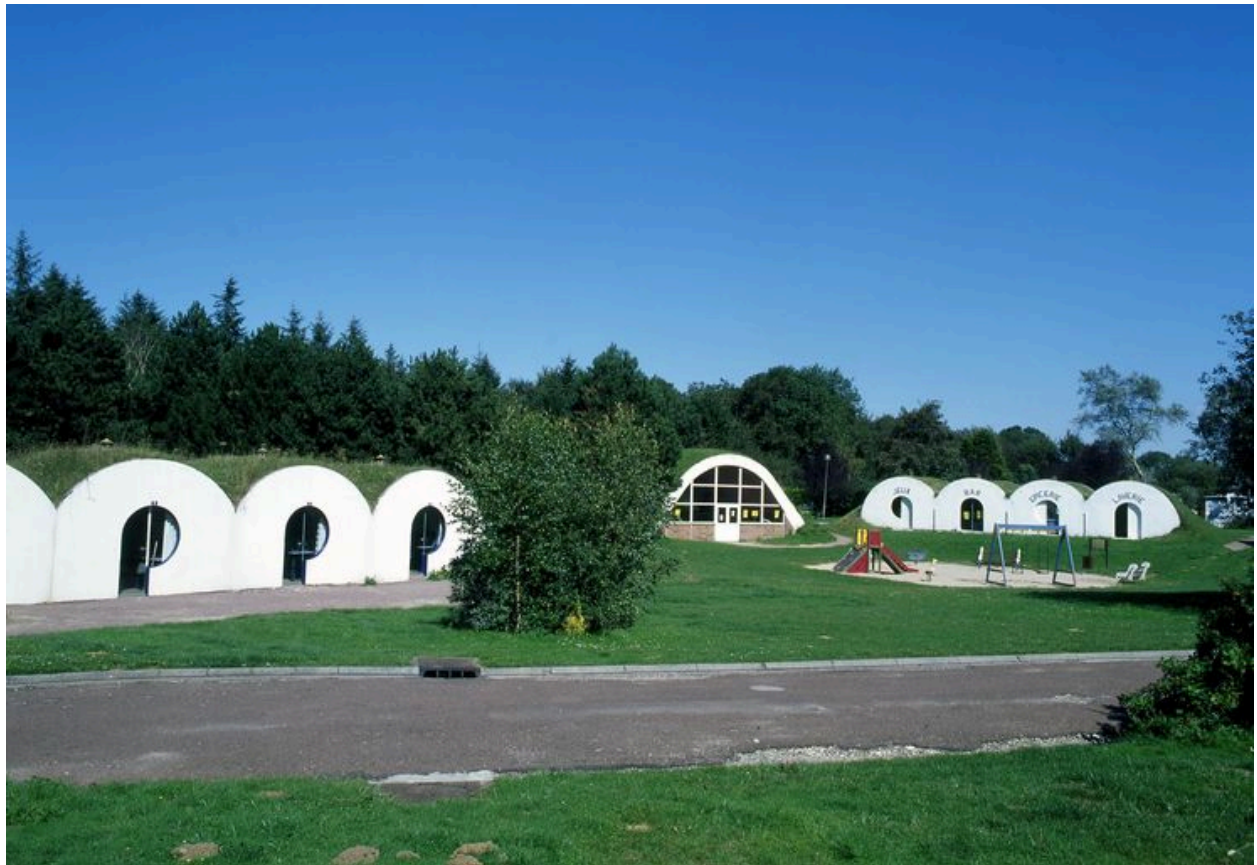
Camping municipal de Mers-les-Bains.