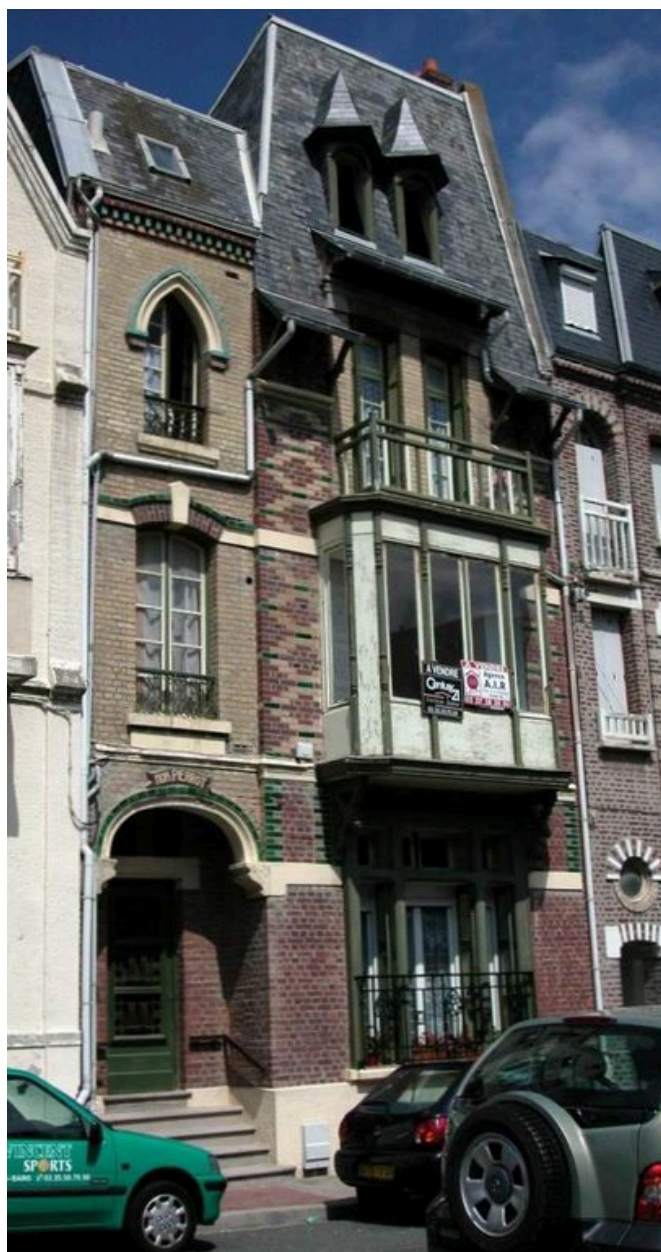
Vue d'ensemble en 2003, avant la mise en couleur actuelle.