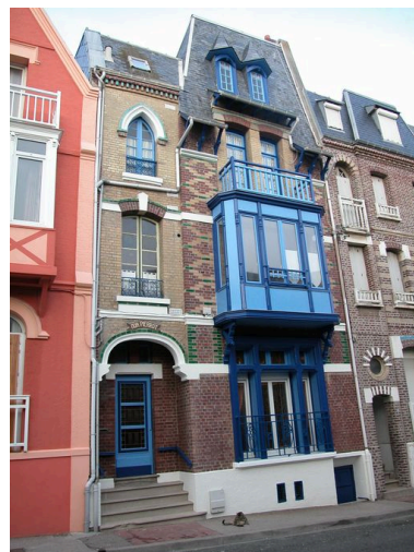
Vue d'ensemble en 2005, après mise en couleur.