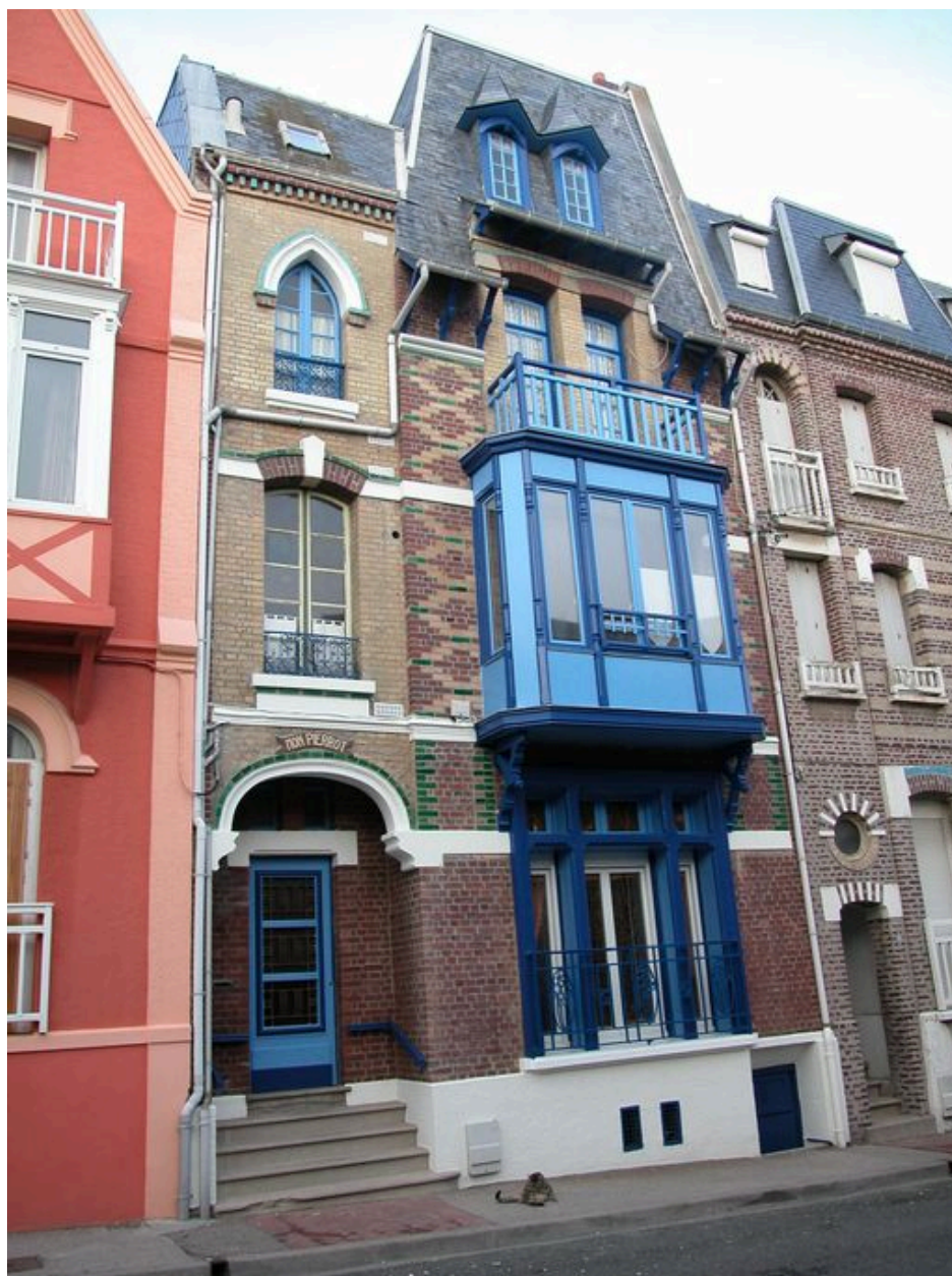
Vue d'ensemble en 2005, après mise en couleur.