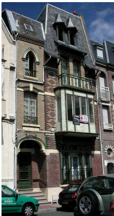
Vue d'ensemble en 2003, avant la mise en couleur actuelle.