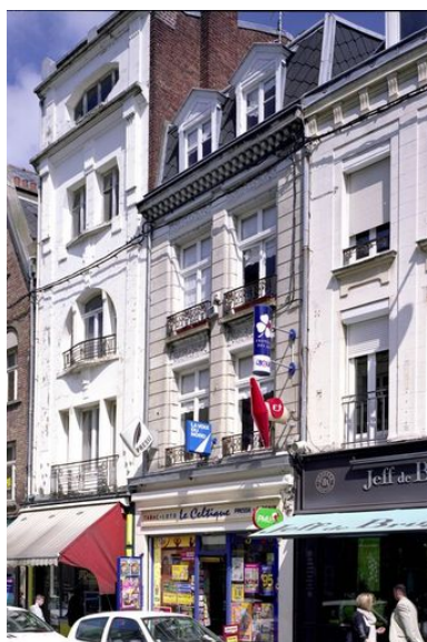
Vue générale. IVR31_20086200154XE