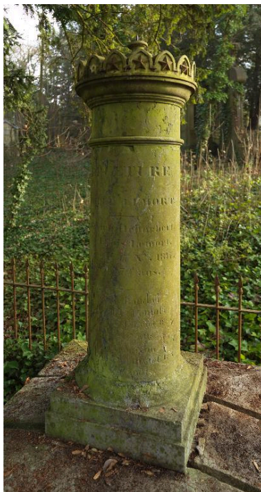
Colonne funéraire de la famille Lemort, vers 1817.

IVR22_20138000605NUC2A